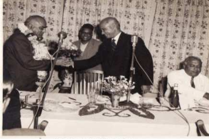
Dr.Sivaram at a public Function