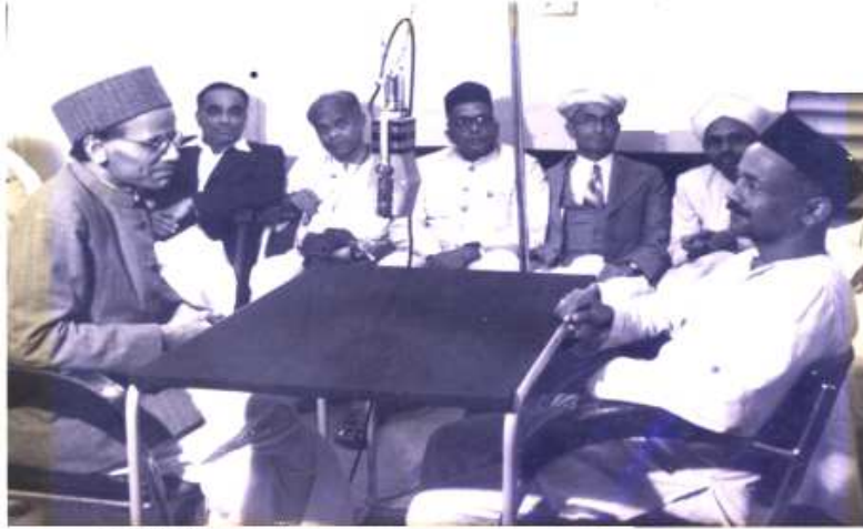
From left to right: Masthi, Ra.Shi., T.P.Kailasam, Na. Kasturi, C.K.Venkara ramalah, Vee.Cee.,and D.R.Bendre.