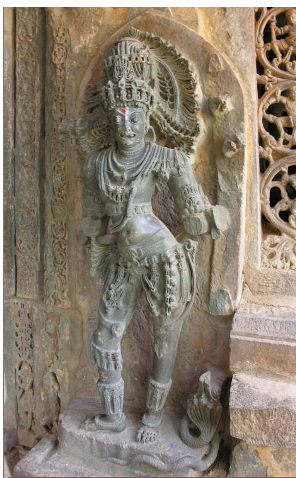
ಪ್ರಾಚ್ಯವಸ್ತು, ಸಂಗ್ರಹಾಲಯಗಳು ಮತ್ತು ಪರಂಪರೆ ಇಲಾಖೆ ಬೆಂಗಳೂರು