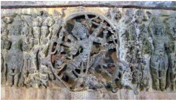
UkA AgP AzD EA

C®APhTUMK e EPgIAUZÁ PVEIAIÁ PÁ ÁPÁghA EFYÁtÁMUE »rzÁ PEñrAiiÁVZÉ F 2®UMÁ °KEAiMÁ 2®UMÁ PÁ ÁAwPUÉ °ÁAEñRUMAwZÁY EIAVgA ¥BZD°ÁAEPE SZAÁ °KEAiMÁ EÁREÁ 2®UMÁ »AZÉ S¼UÁ«AiÁ 2®UMÁ ¥BZD°ÁkZÉ JASÁZEñB PÁyD, ÁVPE, MEPA PVEÉ °ÁEGKE DAIÁÁ°ÁUMKEñB ©r¹qÁ°Á D¼PÁZÁ GSÁÁ PVEÉ «EÁÁ, UMKEñB M¼V°AZÁ mE¼ÁUPE½, Á°ÁZÁ °ÁUME EÁtÁ¥UPE½, Á°ÁZÁ F ©PñTUMK®e wÁgÁ ¥EapÁV E°e