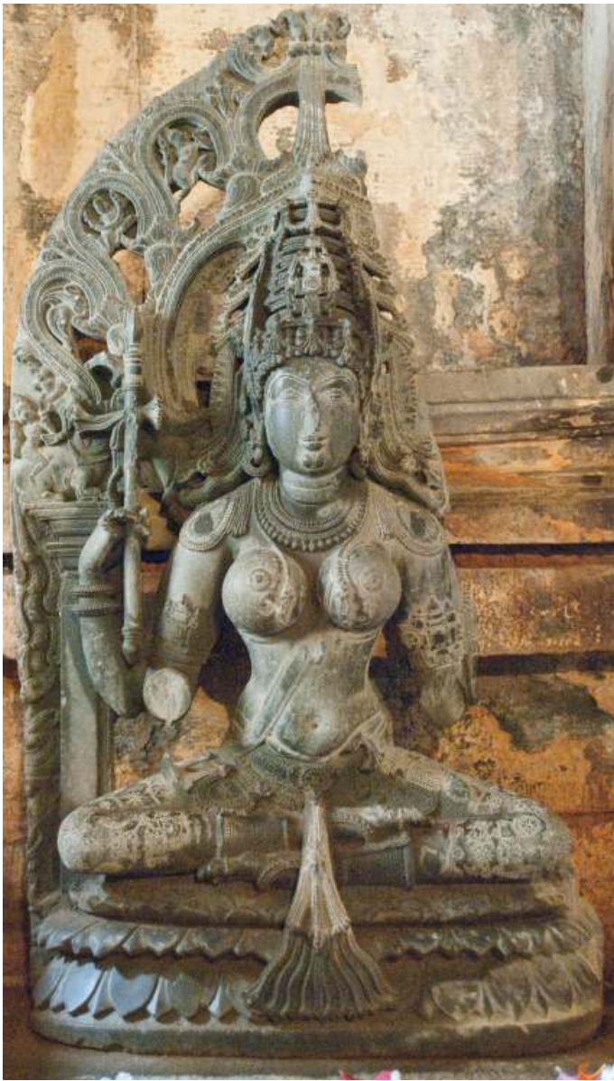
ḡāḡ - wāḡāVPI zāā@Aiā