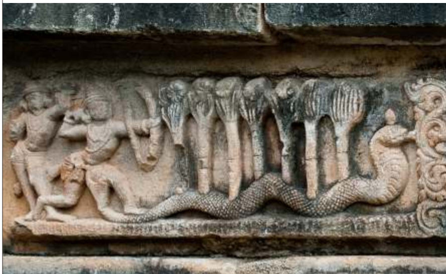
gA°AAiM t PKAÉPA zE±UMK ¥hPÈ