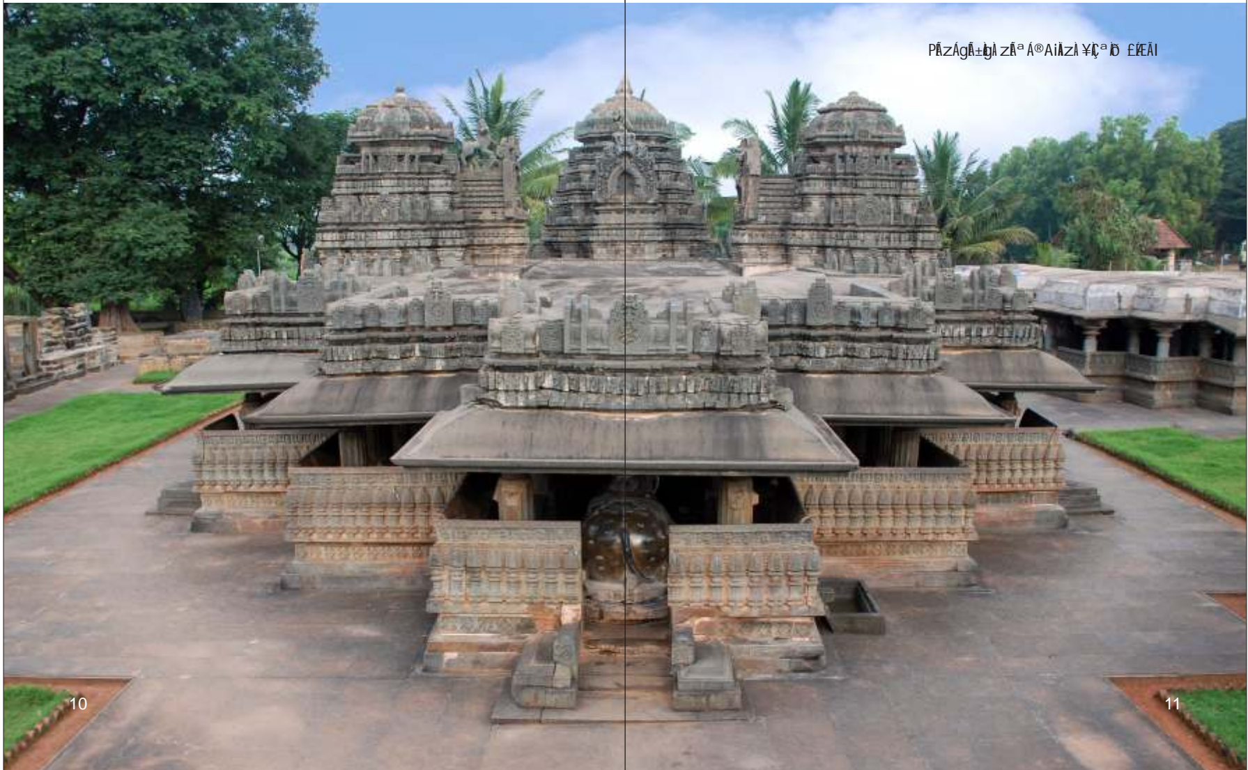
Pāzāgāzā Aṅgīrṣī JAI A

Śrī Jāgaddīśa- zā Aṅgīrṣī a Gzā Śazā Cvā Aṅgīrṣī JAI A Pāzāgāzā F Jāgaddīśa- zā Aṅgīrṣī JAI A zā Aṅgīrṣī F zā Aṅgīrṣī zā Aṅgīrṣī CAeP zē F zā Aṅgīrṣī Pāzāgāzā Aṅgīrṣī JAI A