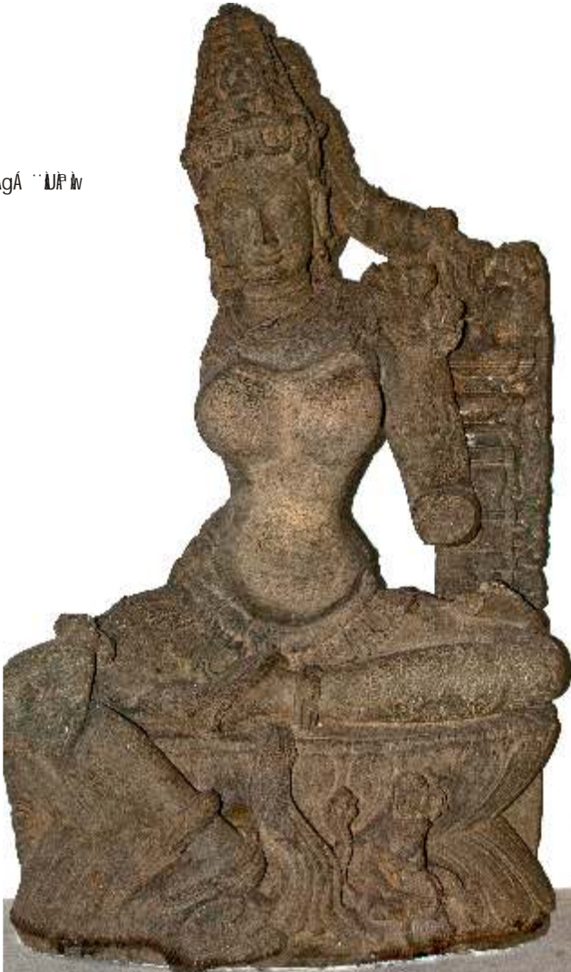
vÁGÁ ··U P w

a A E w o A i A A z g P Á V Z Á V , P P Á ® z Á a Á Á - É P Á V z É C z g Á P E U K Á a Á A j C a e