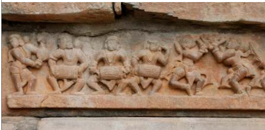
a°AZPbā a°AVU EMBDAiAgā zE±

1. zDēt °°AUMKAZA ¥BÁ², A°AUA S°PÈ a°AAUA a°E, MÈPKÉ I UgbAUMK EgbA°É °QI EJ ,AAiM a°APKUMK avte«zē