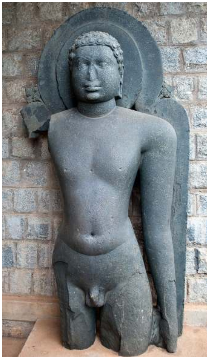
w Á X i D A P g Á

E o E Á e E Á 2 ® U M E Á B w Á G Á A V P Á z Á a A A i A z Á a Á A i A a P E E g Á a J g Á S Á U K Á C a A A U M A Z a g D e