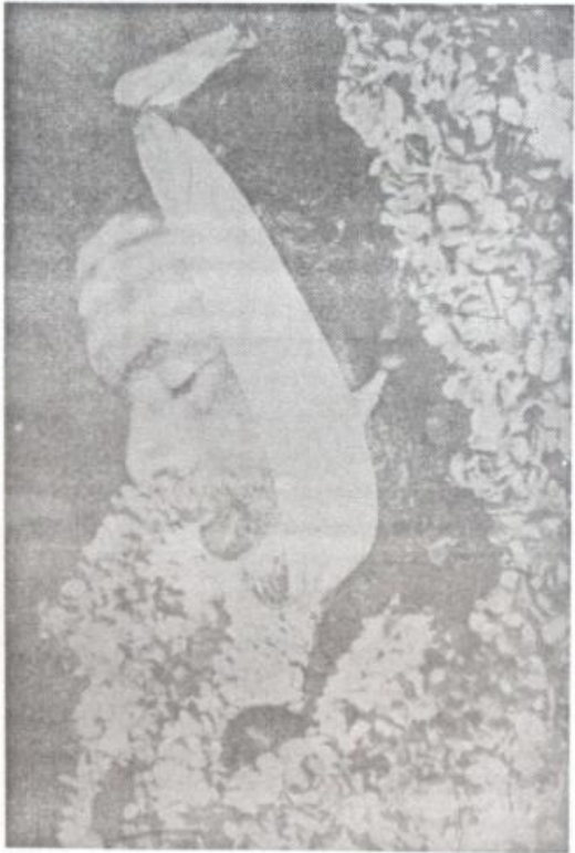
ರಬರ ಆಯಾಕೆ ಸೇರಿಸಿ ರಬರ ಅರಿದಿನ, ಪುರ್ವಿ, ಮಾರ್ಚ್ ೧೯೫೫