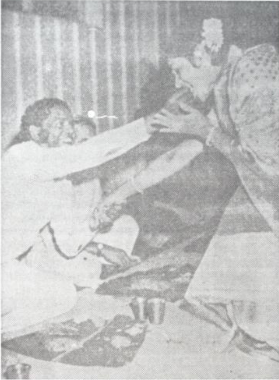
ಪುಟ್ಟಣ್ಣ ಮತ್ತು ಕಲ್ಪನ

“ನನ್ನ ಇದುವರೆಗಿನ ಈ ಚಿತ್ರರಂಗದ ಅನುಭವವನ್ನು ಯಾವುದಾದರೊಂದು ತಿಲ್ಲದಲ್ಲಿ ಕಡೆಯಬೇಕೆಂದು ಮಹದಾಸೆಯಿತ್ತು ಆ ಯೋಗ್ಯತೆಯನ್ನು ಕಲ್ಪನಾಳಲ್ಲಿ ಗುರುತಿಸಿದೆ. ಆಕೆಗೆ ನನ್ನ ಶಕ್ತಿಯನ್ನು ಧಾರೆ ಎರೆದೆ. ಅವಳು ಅದನ್ನು ಪ್ರೀತಿಯಿಂದ, ಭಕ್ತಿಯಿಂದ ಸ್ವೀಕರಿಸಿ ನನ್ನ ಕಲ್ಪನೆಯ ತಿಲ್ಲವಾಗಿದ್ದಾರೆ. ಅಲ್ಲದೆ ನನ್ನ ಬಗ್ಗೆ ಅತ್ಯಂತ ಕೃತಜ್ಞತಾ ಭಾವ ಇರಿಸಿದ್ದಾರೆ.” -ಪುಟ್ಟಣ್ಣ ಕಣಗಾಲ್