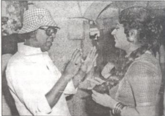
"ಫರೀತಾಂಕ" ಚಿತ್ರದ ಚಿತ್ರೀಕರಣದಲ್ಲಿ ಪುಟ್ಟಣ್ಣ ಮತ್ತು ನಟ ಪುಳ.