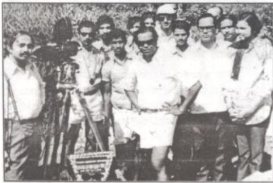
ಚಿತ್ರೀಕರಣ ಸಂದರ್ಭವೊಂದರಲ್ಲಿ ಚಿತ್ರ ತಂಡದೊಡನೆ ಪುಟ್ಟಣ್ಣ ಕಣಗಾಲ್.