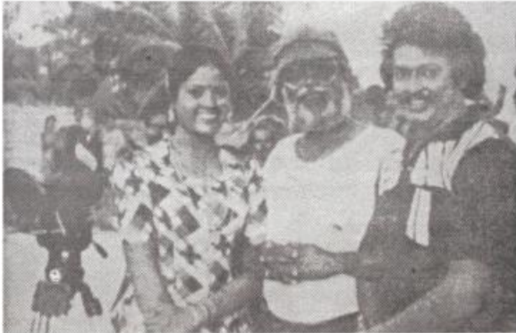
“ಮಸಗದ ಹೂವು” ಚಿತ್ರದ ಚಿತ್ರೀಕರಣದ ಸಮಯದಲ್ಲಿ ಅರ್ಜುನ್, ಪುಟ್ಟಣ್ಣ ಕಣಗಾಲ್, ಶಿವಕುಮಾರ್