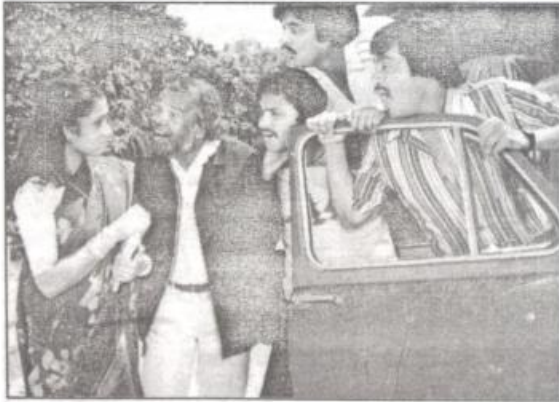
"ಧರಣಿ ಮಂಡಲ ಮಧ್ಯದೊಳಗೆ" ಚಿತ್ರದ ಒಂದು ಪಾತ್ರದಲ್ಲಿ ಪುಟ್ಟಣ್ಣ ಕಣಗಾಲ್. ನಟರುಗಳಾದ ಚಂದ್ರಶೇಖರ್, ಜೈಜಗದೀಶ್, ಶ್ರೀನಾಥ್.