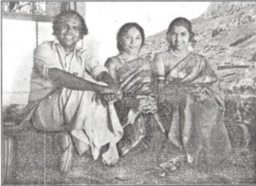
“ರಂಗನಾಯಕಿ” ಚಿತ್ರದ ಚಿತ್ರೀಕರಣದ ಸಂದರ್ಭದಲ್ಲಿ ಪುಟ್ಟಣ್ಣ ಕಣಗಾಲ್ ಮತ್ತು ಅರಕಿ ಚಿತ್ರಕಲಾವಿದೆಯೊಬ್ಬರೊಡನೆ.