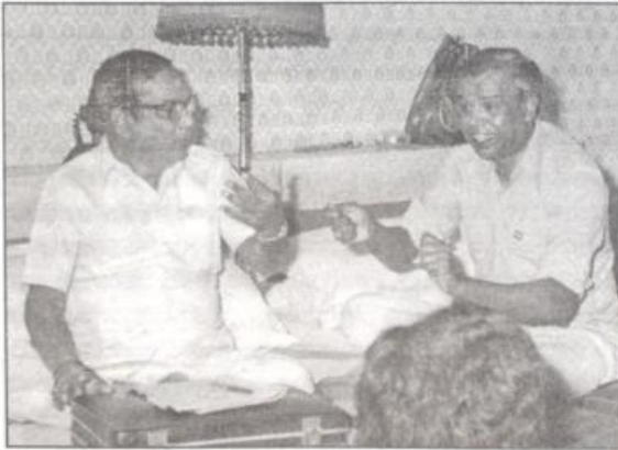
"ರಂಗನಾಯಕಿ" ಚಿತ್ರದ ಹಾಡುಗಳ ರಾಗ ಸಂಯೋಜನೆಯ ಸಂದರ್ಭದಲ್ಲಿ ಸಂಗೀತ ನಿರ್ದೇಶಕ ಎಂ. ರಂಗರಾವ್ ಮತ್ತು ಪುಟ್ಟಣ್ಣ ಕಣಗಾಲ್.