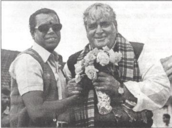
“ಸಾಕ್ಷಾತ್ಕಾರ” ಚಿತ್ರದ ಚಿತ್ರೀಕರಣದ ಸಂದರ್ಭದಲ್ಲಿ ಪುಟ್ಟಣ್ಣ ಕಣಗಾಲ್ ಹಾಗೂ ಹಿಂದಿಯ ಹಿರಿಯ ನಟ ಪೃಥ್ವಿರಾಜ್ ಕಪೂರ್.

ಅತಿ ಭವುಕತೆ ಒಬ್ಬನಲ್ಲಿ ತೀವ್ರತೆಯನ್ನೂ, ತೀಕ್ಷ್ಣತೆಯನ್ನೂ ತರೋದಕ್ಕೆ ಸಾಧ್ಯವಾಗುತ್ತೆ. ಚೂಪಾದ ಸೂಜಿ ಆಳಕ್ಕೊಗುತ್ತೆ. ಆಗ ನೋವಿನ ತೀವ್ರತೆ ಗಮನಕ್ಕೆ ಬರುತ್ತೆ. ಸಣ್ಣ ಮುಳ್ಳು ಸಣ್ಣದಾಗಿ ನೋವನ್ನು ಹುಟ್ಟಿಸುತ್ತೆ. ಆದರೆ ಅತಿ ಭಾವುಕತೆಯಿಂದ ನನಗಾವ ರೀತಿಯ ಹಾನಿಯೂ ಆಗಿಲ್ಲ. ಇದಕ್ಕೆ ಕಾರಣ ಭವಿಷ್ಯ ನಾನು ತುಂಬಾ ಭಾವುಕ ಅಂತ ಕಾಣುತ್ತೆ. ಸಣ್ಣ ಮಾತಿಗೆ ಅತ್ತು ಬಿಡ್ತೀನಿ. ಸಣ್ಣ ಮಾತಿಗೆ ಕೋಪ ಮಾಡಿಕೊಳ್ತೀನಿ, ನಕ್ಕೂ ಬಿಡ್ತೀನಿ, ನನ್ನ ಈ ಗುಣ ನನ್ನ ಚಿತ್ರಗಳಲ್ಲಿಯೂ ಕಂಡು ಬಂದಿರಬಹುದು.