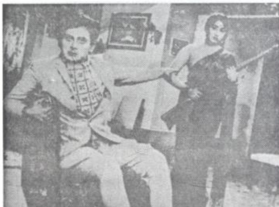
ಪುಟ್ಟಣ್ಣ ಕರಗಾಲ್ ನಿರ್ದೇಶಿಸುತ್ತಿದ್ದ "ಮೈತ್ರಿ ಫಿಲಂಸ್"ರವರ ಅಪರೂಪ ಚಿತ್ರ "ಸಾವಿರ ಮೆಟ್ಟಿಲು"ನಲ್ಲಿ ವಜ್ರಮುನಿ ಮತ್ತು ಜಯಂತಿ