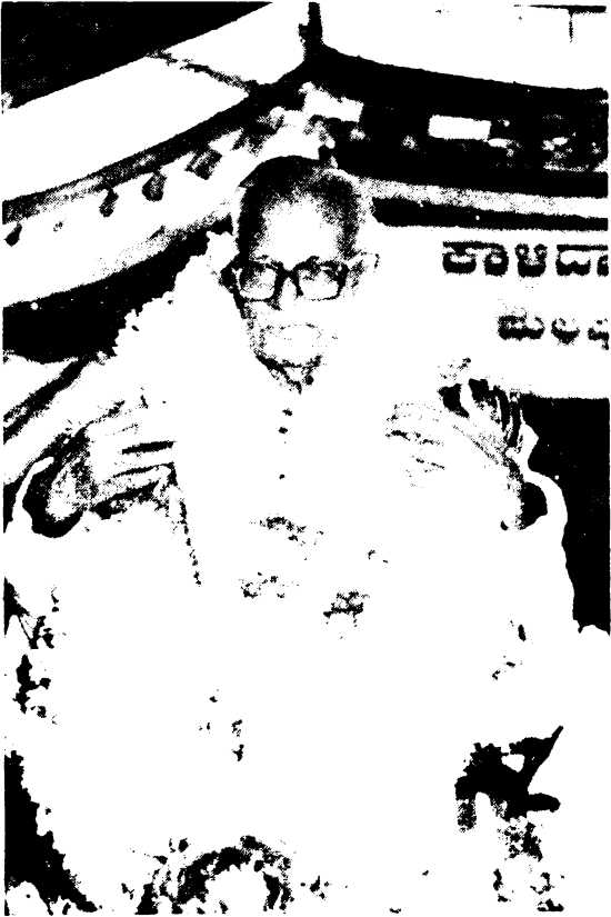
ಪೂವು ನನಗೆ ಭಾರವಾಗಿ ಕಂಡ ದಿನ