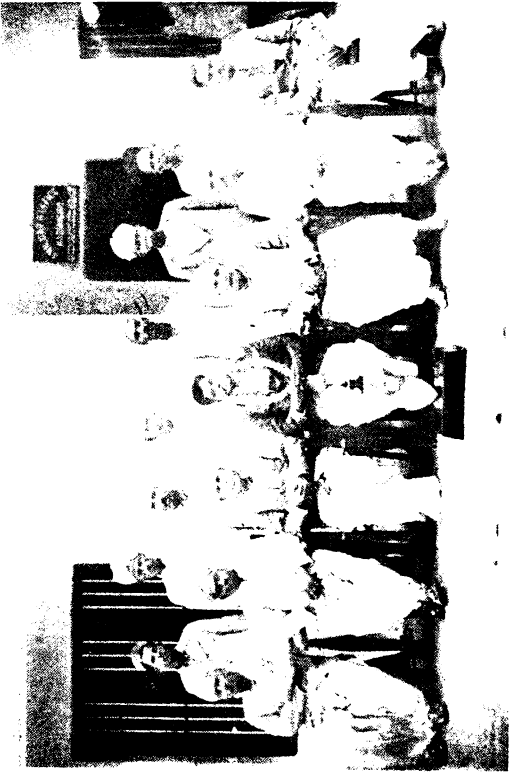
ಮುಧುಗಿರಿ ಸ್ಥಳೀಯ ಜಮೀನು ಅಡವರಾನ ಸಹಕಾರ ಬ್ಯಾಂಕಿನ ಅಧಿಕಾರಿಯುಕ್ತ ಅಧ್ಯಕ್ಷನಾಗಿದ್ದಾಗ