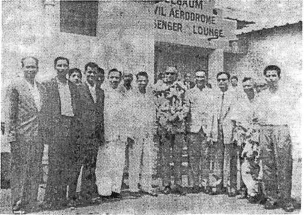
ಬಸವರಾಜ ಕಟ್ಟೀಮನಿಯವರು ರಶಿಯಾಕ್ಕೆ ಹೊರಟಾಗ ಬೆಳಗಾವಿ ವಿಮಾನ ನಿಲ್ದಾಣದಲ್ಲಿ ತಮ್ಮ ಆತ್ಮೀಯ ಮಿತ್ರ ವೃಂದದೊಡನೆ.