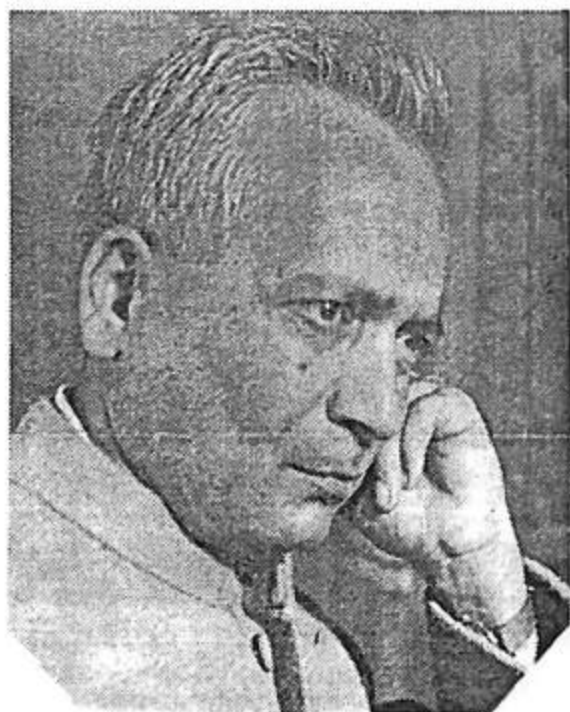
ಖ್ಯಾತ ಕಾದಂಬರಿಕಾರ ಬಸವರಾಜ ಕಟ್ಟೀಮನಿ