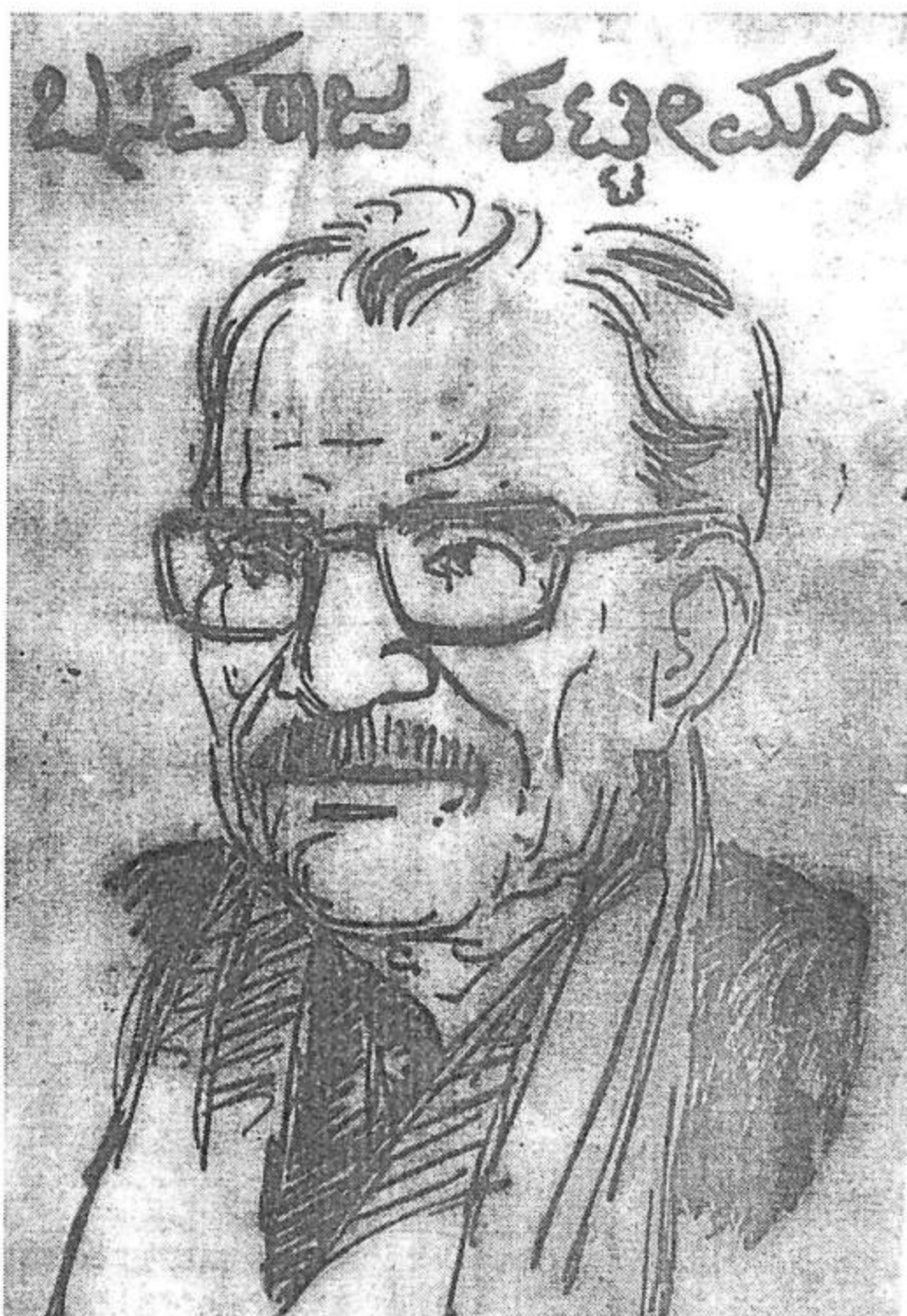
ರೇಖಾಚಿತ್ರದಲ್ಲಿ ಬಸವರಾಜ ಕಟ್ಟೀಮನಿ