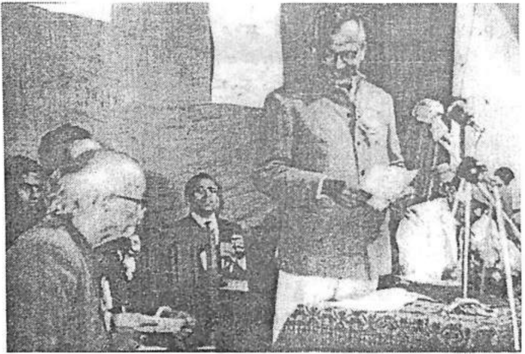
1970ರಲ್ಲಿ ಜರುಗಿದ ಧಾರವಾಡ ಜಿಲ್ಲಾ ಸಾಹಿತ್ಯ ಸಮ್ಮೇಳನದಲ್ಲಿ ಬಸವರಾಜ ಕಟ್ಟೀಮನಿಯವರು ಮಾತನಾಡುತ್ತಿರುವುದು. ಚಿತ್ರದಲ್ಲಿ ವರಕವಿ ಡಾ. ದ.ರಾ. ಬೇಂದ್ರೆಯವರು ಇದ್ದಾರೆ.