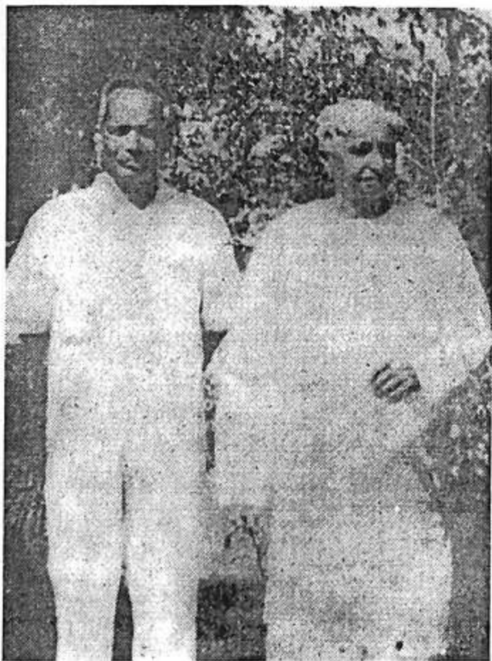
ರಾಷ್ಟ್ರಕವಿ ಕುವೆಂಪು ಅವರೊಂದಿಗೆ ಬಸವರಾಜ ಕಟ್ಟೀಮನಿ