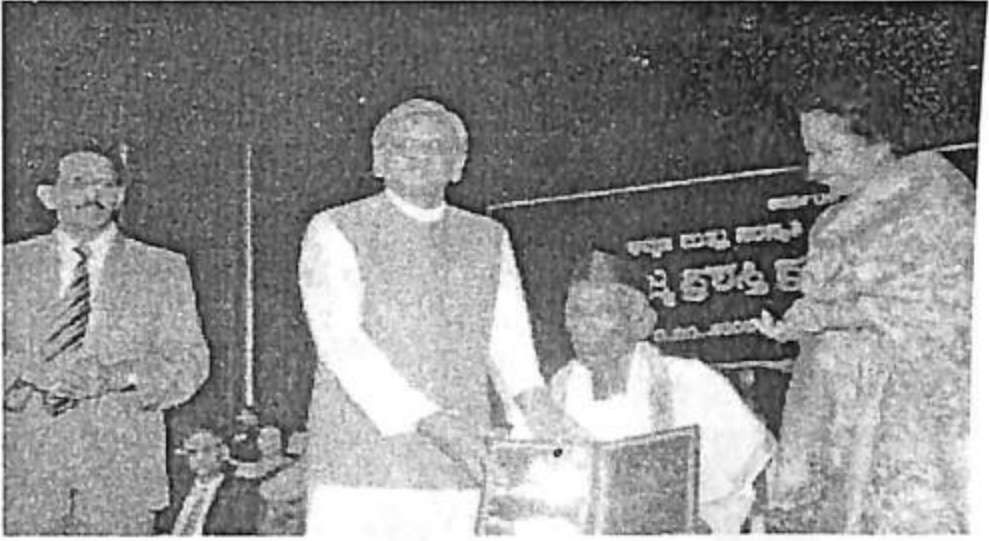
ಕರ್ನಾಟಕದ ಮಾಜಿ ಮುಖ್ಯಮಂತ್ರಿಗಳಾದ ಶ್ರೀ ಎಸ್.ಎಂ.ಕೃಷ್ಣ ಅವರಿಂದ ರಾಜೋತ್ಸವ ಪ್ರಶಸ್ತಿ ಸ್ವೀಕರಿಸುತ್ತಿರುವುದು