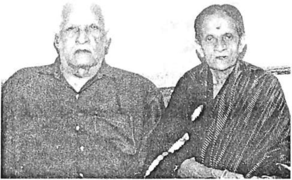
ಕೆ. ಆರ್. ಕಾರಂತರು ಪತ್ನಿ ರಮಾ ಅವರೊಂದಿಗೆ