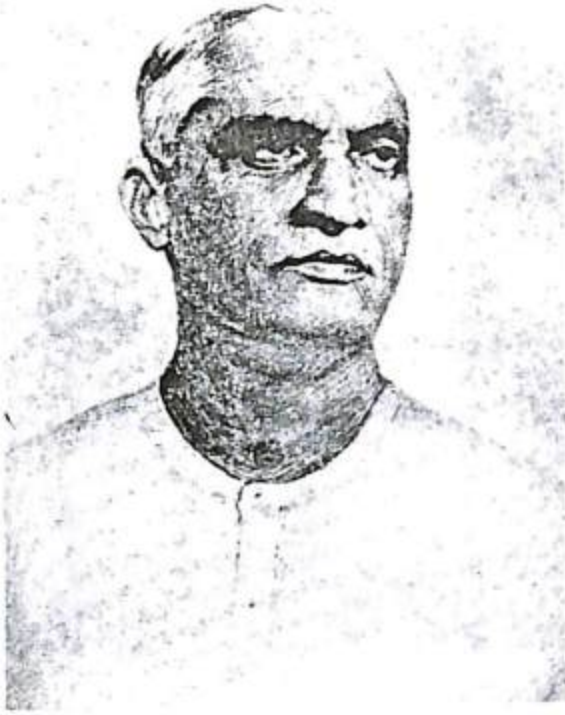
ಕೆ. ಆರ್. ಕಾರಂತ