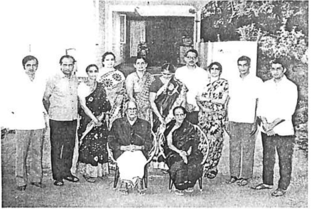
ಕೆ.ಆರ್. ಕಾರಂತರ ಕುಟುಂಬವರ್ಗದವರ ಭಾವಚಿತ್ರ (ಕಾರಂತರ ೮೦ ನೇ ಹುಟ್ಟುಹಬ್ಬದ ಸಂದರ್ಭದಲ್ಲಿ ತೆಗೆದದ್ದು).