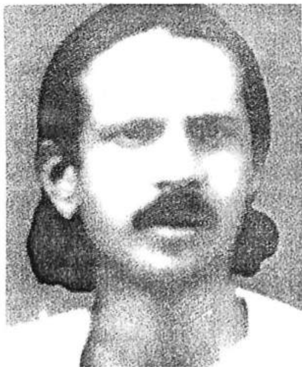
ಸಹೋದರ ನರಸಿಂಹ ಕಾರಂತ