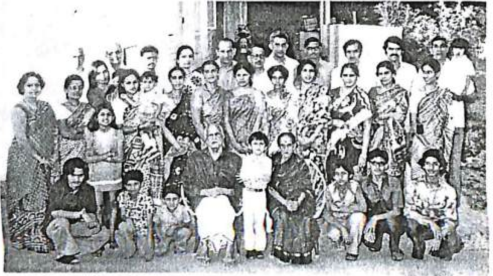
ತಮ್ಮ ೮೦ನೇ ಹುಟ್ಟುಹಬ್ಬದ ಸಂದರ್ಭದಲ್ಲಿ ಕುಟುಂಬವರ್ಗದವರೊಂದಿಗೆ ತೆಗೆಸಿಕೊಂಡ ಛಾಯಾಚಿತ್ರ