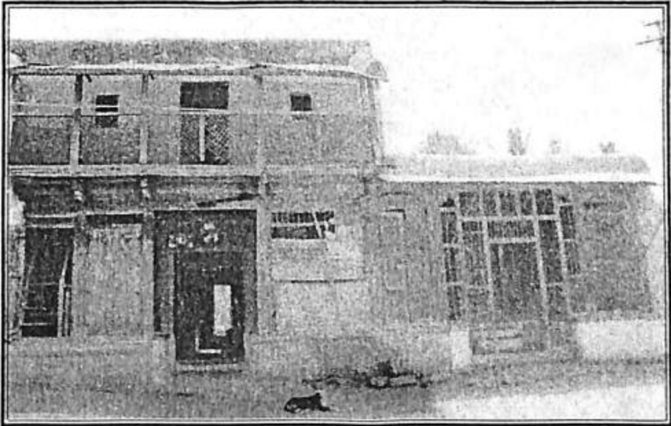
ಪ್ರೊ. ಭೂಸನೂರಮಠರು ಹುಟ್ಟಿದ ಮನೆ - ನಿಡಗುಂದಿ