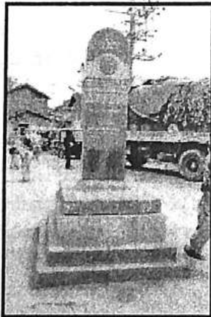
ಧಾರವಾಡದಲ್ಲಿ ಶಹರ ಪೊಲೀಸ್ ಠಾಣೆ ಬಳಿ ಗೋಳಿಬಾರು ನಡೆದ ಸ್ಥಳ.

ಇದಾಗಿ ಒಂದೇ ದಿನದ ಅಂತರದಲ್ಲಿ ಅಂದರೆ ಜುಲೈ ೧ ರಂದು ಇಬ್ಬರು ಮುಸ್ಲಿಂ ಸ್ವಯಂಸೇವಕರನ್ನು ಪೊಲೀಸರು ಬಂಧಿಸಿದರು. ಯಾಕೆಂದರೆ ಹಿಂದಿನ ದಿನ ಅವರು ಮದ್ಯದ ಅಂಗಡಿಯ ಎದುರು ಪಿಕೆಟಿಂಗ್ ಮಾಡಿದ್ದಕ್ಕೆ. ಜುಲೈ ೧ ರಂದು ಈ ಬಗ್ಗೆ ವಿಚಾರಣೆ ನಡೆದು ಅವರಿಗೆ ಆರುತಿಂಗಳ ಶಿಕ್ಷೆ ವಿಧಿಸಲಾಗಿತ್ತು. ಈ ಸುತಾ ಕಾಳ್ಜಿಚ್ಚಿನಂತೆ ಧಾರವಾಡದ ತುಂಬೆಲ್ಲ ಹಬ್ಬಿತು. ನೂರಾರು ಜನ ನ್ಯಾಯಾಲಯದ ಅಂಗಳದಲ್ಲಿ ಜಮಾಯಿಸತೊಡಗಿದರು. ಜನಜಂಗುಳಿ ನ್ಯಾಯಾಲಯದಿಂದ ಜೈಲಿನವರೆಗೆ