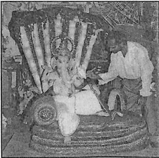
ತಾವು ನಿರ್ಮಿಸಿದ ಗಣಪತಿ ಮೂರ್ತಿಗೆ ಬಣ್ಣ ನೀಡಿ ಸಿದ್ಧ ಪಡಿಸುತ್ತಿರುವುದು