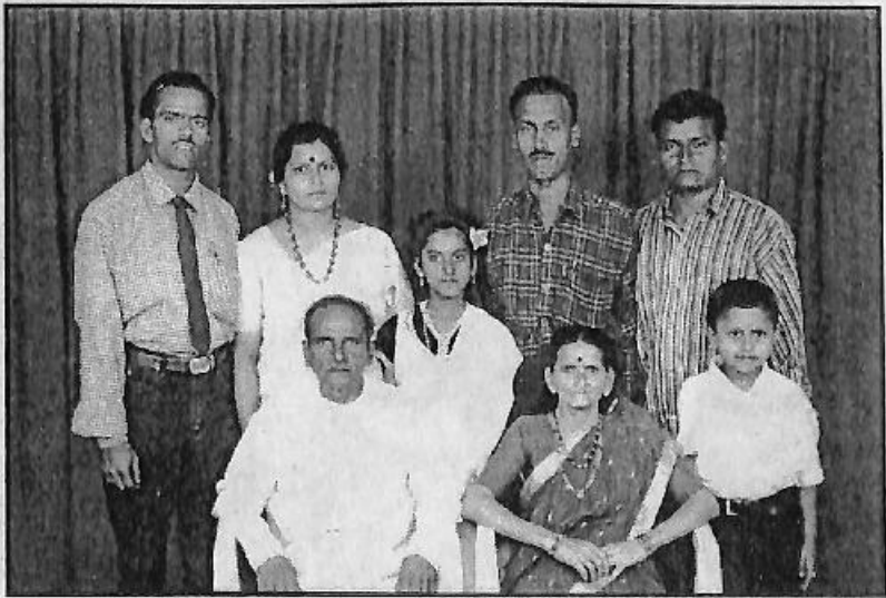
ಕುಟುಂಬದ ಸದಸ್ಯರೊಂದಿಗೆ ಮಹಾಲೆ ದಂಪತಿಗಳು