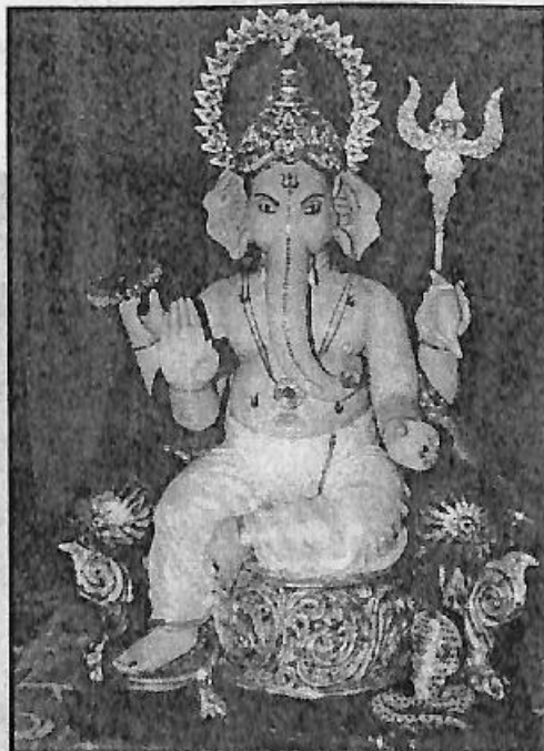
ಗಜಾನನ ಮಹಾಲೆ ನಿರ್ಮಿಸಿದ ಅನೇಕ ಗಣಪತಿ ಮೂರ್ತಿಗಳಲ್ಲಿ ಒಂದು