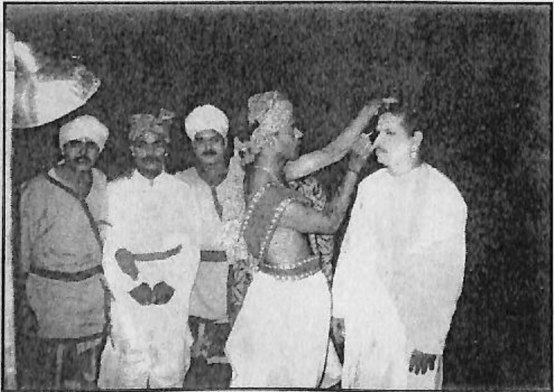
ಪುತ್ರ ಸಂತೋಷನೊಂದಿಗೆ ಗಜಾನನರು ಮಾಡಿದ ಇನ್ನೊಂದು ಪ್ರಸಾಧನಬಂಧ