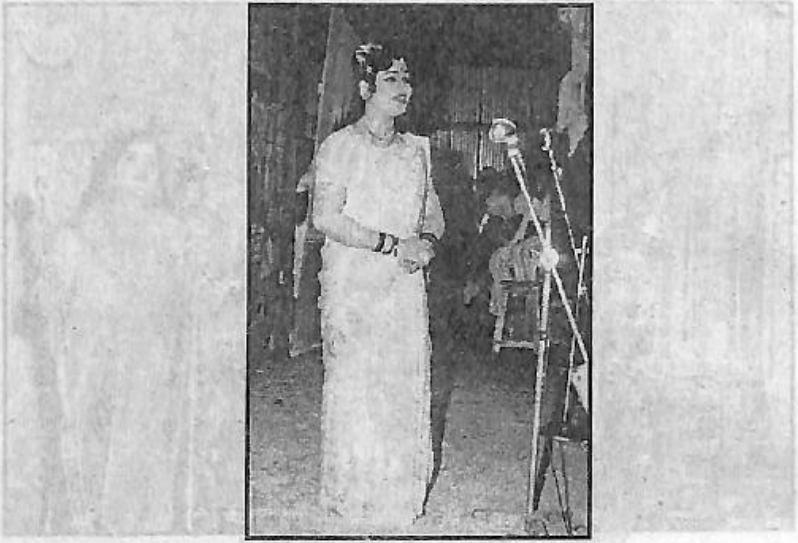
ದೊಡ್ಡದಿ ಮಂಟಪದಲ್ಲಿ ಚಿತ್ರಾಂಗದಾ ನಾಟಕದಲ್ಲಿ ಚಿತ್ರಾಂಗದಯಾಗಿ