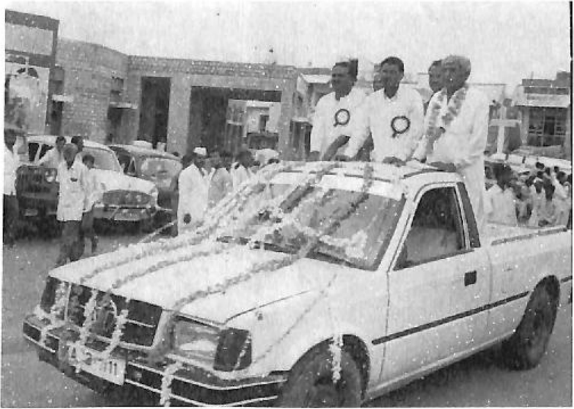
ಜೀವರಗಿ ತಾಲ್ಲೂಕು ಸಾಹಿತ್ಯ ಸಮ್ಮೇಳನದಲ್ಲಿ ಮೆರವಣಿಗೆ