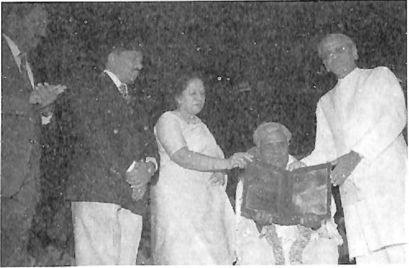
ರಾಜ್ಯೋತ್ಸವ ಪ್ರಶಸ್ತಿ - ಮುಖ್ಯಮಂತ್ರಿ ಎಸ್.ಎಂ. ಕೃಷ್ಣ ಮತ್ತು ಕನ್ನಡ ಮತ್ತು ಸಂಸ್ಕೃತಿ ಸಚಿವರಾದ ರಾಣಿ ಸತೀಶ್ ಅವರಿಂದ ಪ್ರದಾನ

ವರದರಾಜ ಪ್ರಶಸ್ತಿ ಸ್ವೀಕಾರ - ಲೋಕನಾಥ್, ಬರಗೂರು ರಾಮಚಂದ್ರಪ್ಪ ಮತ್ತು ಶಿವರಾಜ ಕುಮಾರ್ ಸಮ್ಮುಖದಲ್ಲಿ