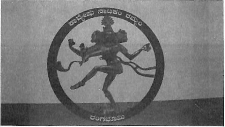
ಖೇಡಗಿಯವರ ಪರಿಕಲ್ಪನೆಯ ರಂಗಭಾವುಟ