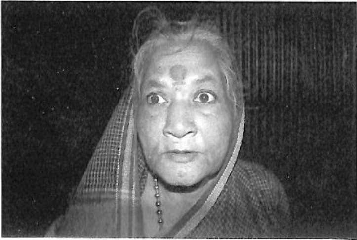
'ಚನ್ನಪ್ಪ ಚನೆಗೌಡ' ನಾಟಕದ ಈರಮ್ಮ