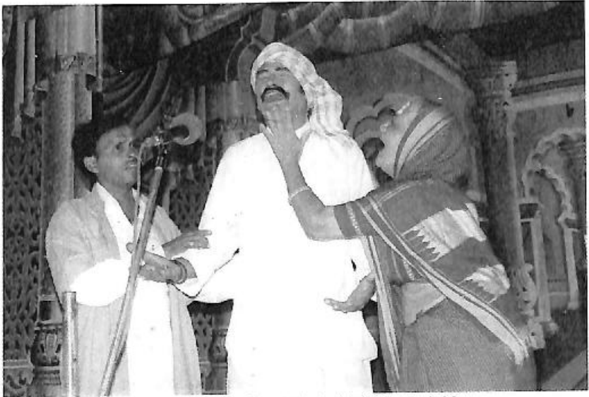
'ಸಿಂಧೂರ ಲಕ್ಷ್ಮಣ' ನಾಟಕದ ಸರಸವ್ವನ ಪಾತ್ರದಲ್ಲಿ