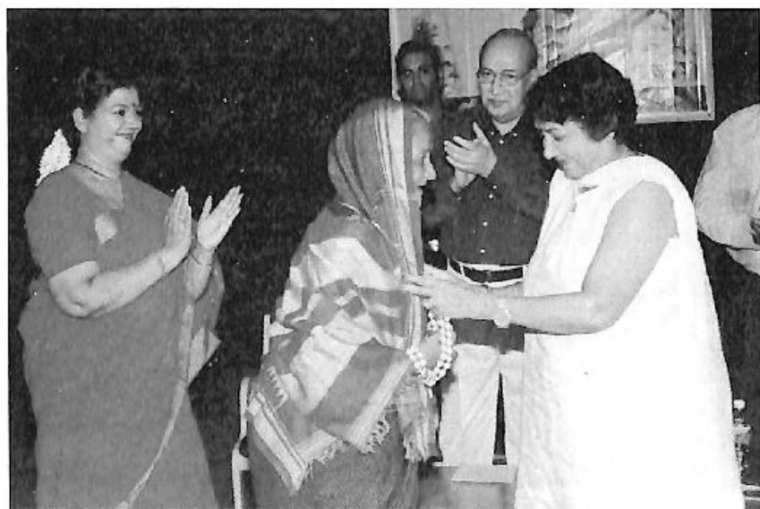
ಚಿತ್ರನಟಿ ಜಯಂತಿ ಅವರಿಂದ ಪುರಸ್ಕಾರಗೊಳ್ಳುತ್ತಿರುವ ಸನ್ನಿವೇಶ.