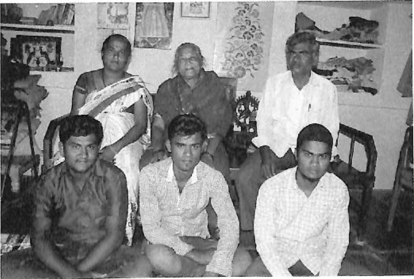
ಪ್ರಮೀಳದ್ವೈ ಕುಟುಂಬದ ಸದಸ್ಯರೊಂದಿಗೆ