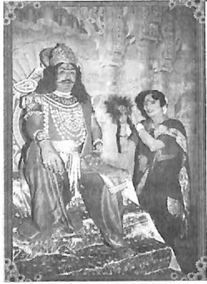
'ಶಿವಶರಣೆ ಅಕ್ಕಮಹಾದೇವಿ' ನಾಟಕದಲ್ಲಿ ಕೌಶಿಕ ಮಹಾರಾಜನ ಜೊತೆ ದಾಸಿ ಪಾತ್ರದಲ್ಲಿ