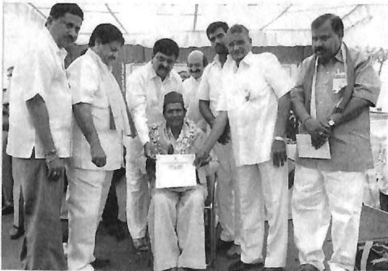
'ರಾಯಚೂರು ಬೆಲ್ಲಾ ರಾಜ್ಯೋತ್ಸವ ಪ್ರಶಸ್ತಿ-೨೦೦೮'