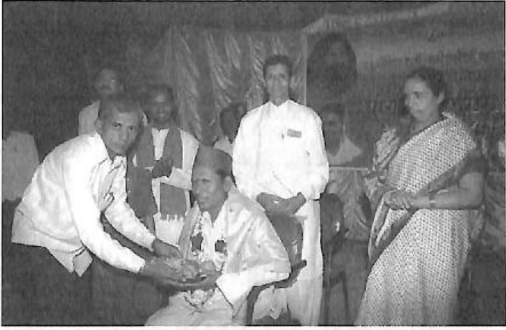
'ಯೋಗಗುರು ಬಾಬಾ ರಾಮದೇವ ಪ್ರತಿಷ್ಠಾನ ಗಬ್ಬೂರು ಅವರಿಂದ ಸನ್ಮಾನ'