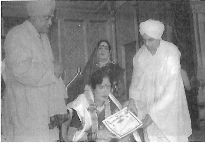
ಸಂಪೂರ್ಣ ಹೇಮರೆಡ್ಡಿ ಮಲ್ಲಮ್ಮ ನಾಟಕ 'ಹಾನಗಲ್ಲಿನ ಬೊಮ್ಮನಳ್ಳಿ ಶ್ರೀಗಳಿಂದ ಸನ್ಮಾನ'