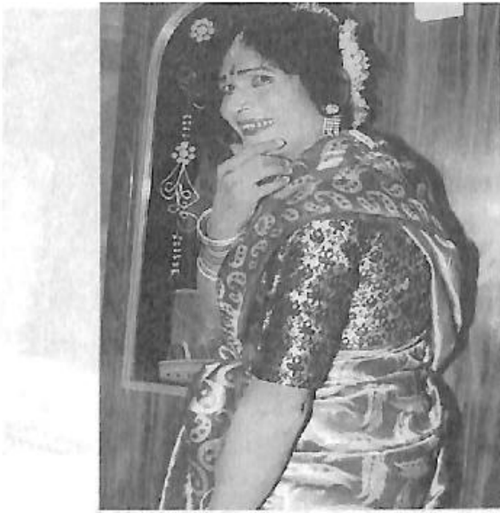
'ಶಿವಶರಣೆ ಅಕ್ಕಮಹಾದೇವಿ' ನಾಟಕದಲ್ಲಿ 'ದಾಸಿ' ಪಾತ್ರ