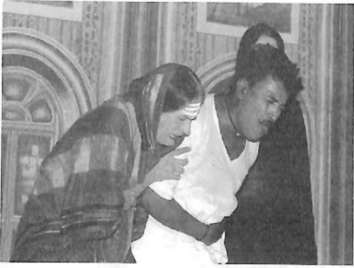
'ಚನ್ನಪ್ಪಚನ್ನಪ್ಪಗೌಡ' ನಾಟಕದ ರುದ್ರಮ್ಮನ ಪಾತ್ರ