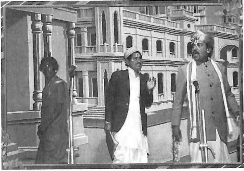
'ಮಲಮಗಳು' ನಾಟಕದಲ್ಲಿ 'ಅಚ್ಚಮ್ಮ'ನ ಪಾತ್ರ