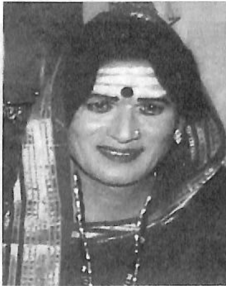
'ವರನೋಡಿ ಹೇಣ್ಣುಕೊಡು' ನಾಟಕದಲ್ಲಿ 'ಚಿನ್ನಮ್ಮ'ನ ಪಾತ್ರ