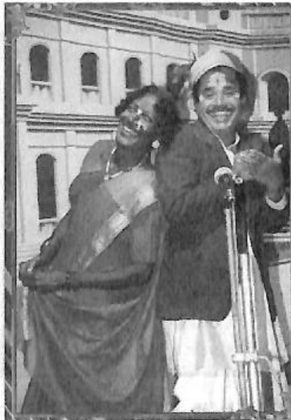
'ಮುದುಕನ ಮದುವೆ' ನಾಟಕದಲ್ಲಿ 'ಅಚ್ಚಮ್ಮ'ನ ಪಾತ್ರ