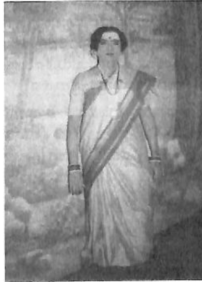
'ಶಿವಶರಣೆ ಅಕ್ಕಮಹಾದೇವಿ' ನಾಟಕದಲ್ಲಿ ಸಖಿ ಪಾತ್ರದಲ್ಲಿ