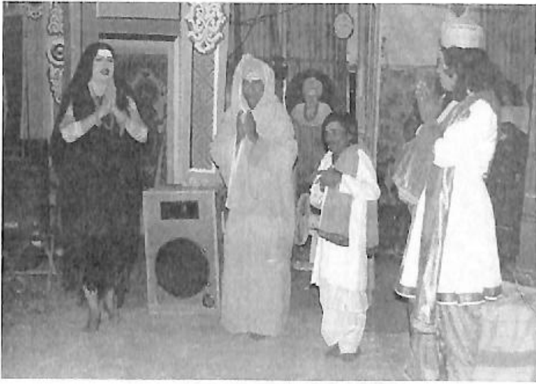
‘ಶಿವಶರಣೆ ಅಕ್ಕಮಹಾದೇವಿ’ ನಾಟಕದಲ್ಲಿ ‘ಶರಣ’ನ ಪಾತ್ರ