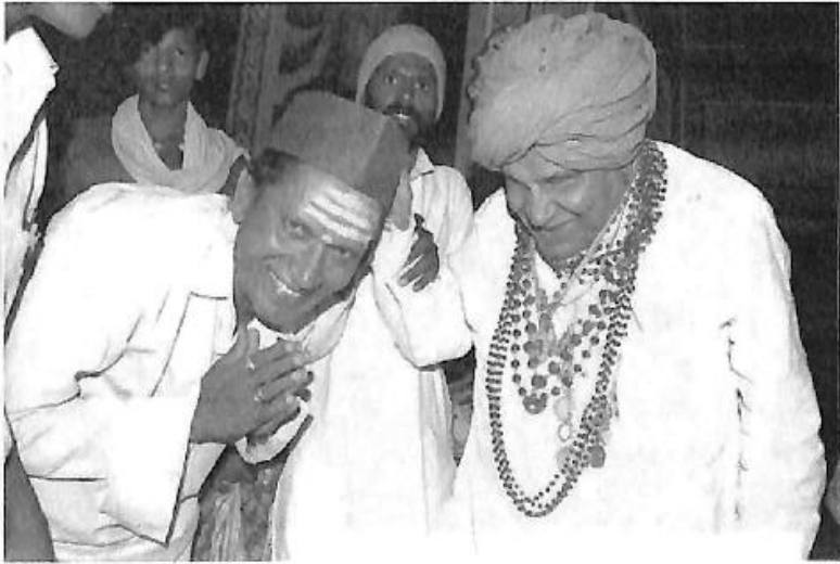
'ಗಾನಯೋಗಿ ಪಂ.ಪುಟ್ಟರಾಜ ಗವಾಯಿಗಳ ದರ್ಶನ'