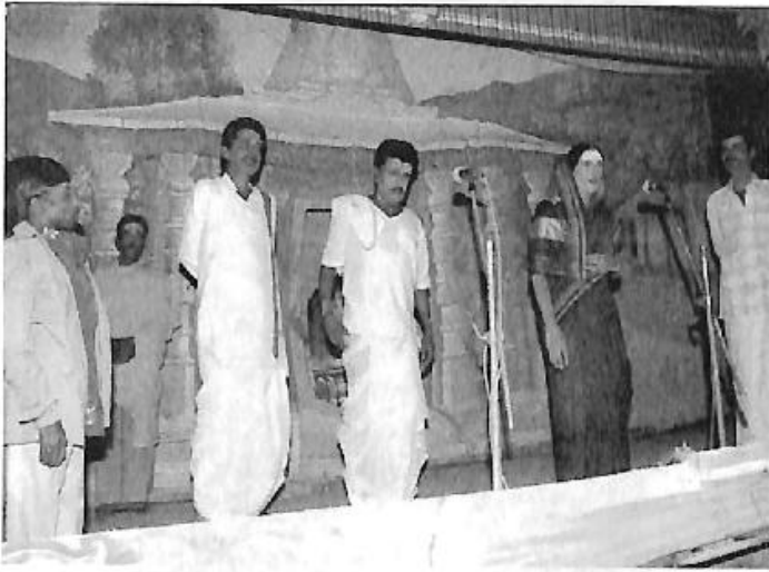
'ಚನ್ನಪ್ಪ ಚನ್ನಗೌಡ' ನಾಟಕದಲ್ಲಿ 'ರುದ್ರಮ್ಮ'ನ ಪಾತ್ರ