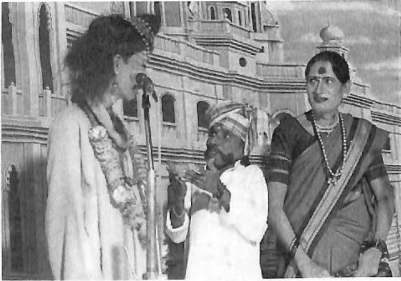
'ರತ್ನಮಾಂಗಲ್ಯ' ನಾಟಕದಲ್ಲಿ 'ಮಾಳಿ'ಯ ಪಾತ್ರ