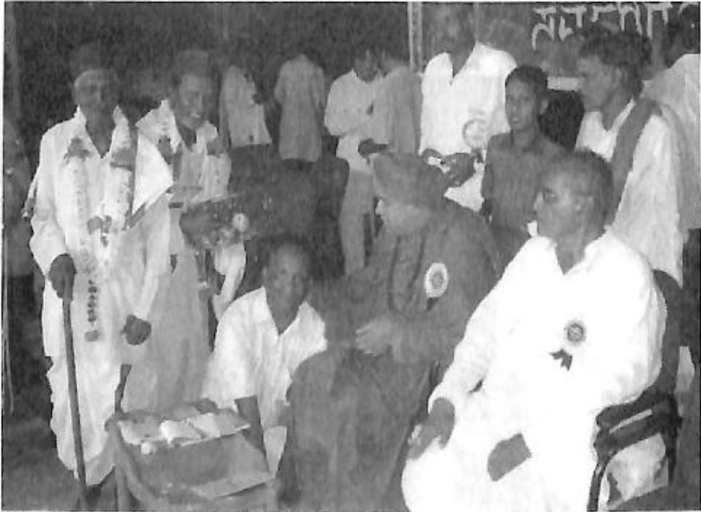
ಗುಡಿಗೇರಿ ಬಸವರಾಜರ ೪೫ನೇ ರಂಗ ಸಂಭ್ರಮ 'ಕೊಡಲಸಂಗಮ ಶ್ರೀಗಳಿಂದ ಸನ್ಮಾನ'