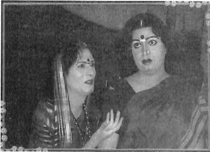
‘ಆದವಾನಿ ಮಹಾಯೋಗಿ ಲಕ್ಷ್ಮಮ್ಮ’ ನಾಟಕದಲ್ಲಿ ‘ಮಂಗಳಮ್ಮ’ನ ಪಾತ್ರ