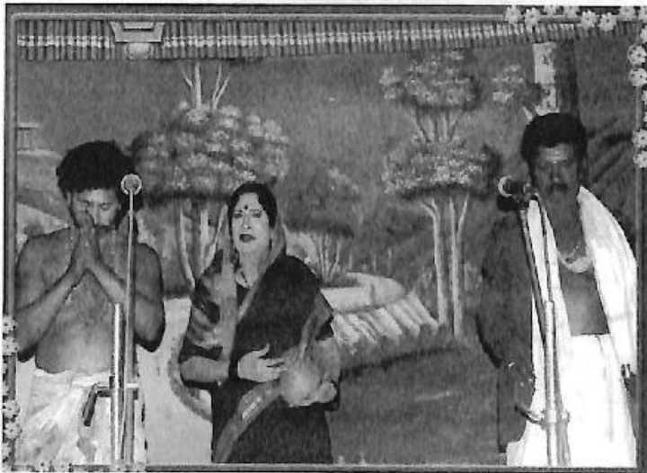
'ಸಂಪೂರ್ಣ ಹೇಮರೆಡ್ಡಿ ಮಲ್ಲಮ್ಮ' ನಾಟಕದಲ್ಲಿ 'ನಾಗಮ್ಮ'ನ ಪಾತ್ರ