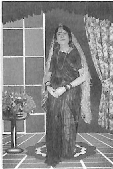
'ಶ್ರೀಕೃಷ್ಣಗಾರುಡಿ' ನಾಟಕದಲ್ಲಿ 'ಮೋಹಿನಿ' ಪಾತ್ರ