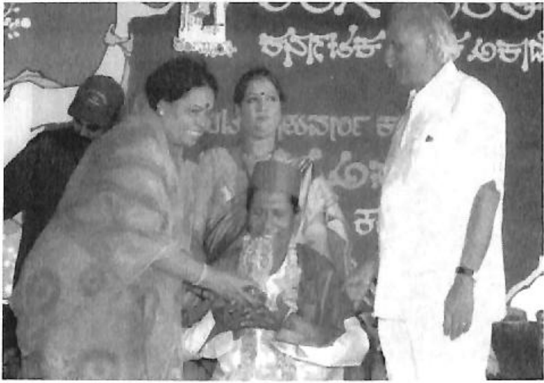
'ರಂಗಭಾರತಿ ಲಂ'ರ ಸಂಭ್ರಮ ಕರ್ನಾಟಕ ನಾಟಕ ಅಕಾಡೆಮಿಯಿಂದ ಸನ್ಮಾನ