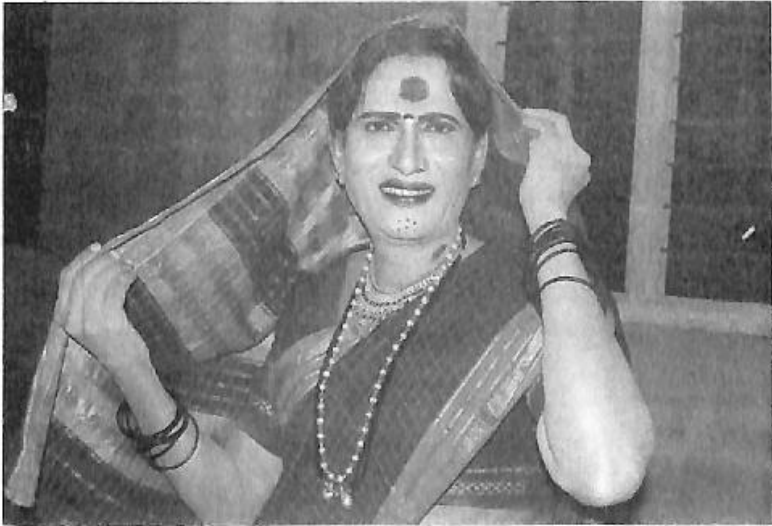
'ಮಾಂಗಲ್ಯಭಾಗ್ಯ' ನಾಟಕದಲ್ಲಿ 'ಮಾಳಿ'ಯಾಗಿ