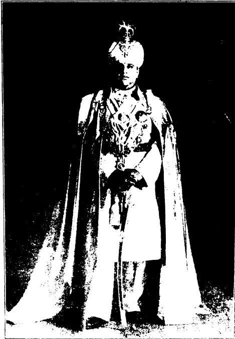
ಯದುವಂಶವಯ್ಯಾಚಾರ್ಯರನ್ನಾಕರಿಸಿ ಕೃಷ್ಣವಾಯುವಿನ ಸಿವಿಲೈಜರ್ವಿಕರೂ ಮುನಿಯ ದೇವಸ್ಥಾನದ ರವಣಶೃಂಗಣಿ ಆದ ಶ್ರೀಮನ್ನಾರಾಜ ಶ್ರೀ ಜಯಚಾಮರಾಜೇಂದ್ರ ವಿಠಯರ್ ಬಹದ್ದೂರ್, ಜೆ.ಸಿ.ಬಿ. ಜೆ.ಸಿ.ಎಸ್.ಐ. ರವರು.