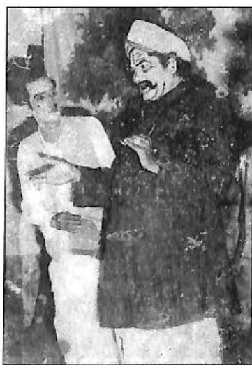
'ಮಲಮಗಳು' ನಾಟಕದ ಸಾಮಕಾರ ರಂಗಣ್ಣನ ಪಾತ್ರದಲ್ಲಿ