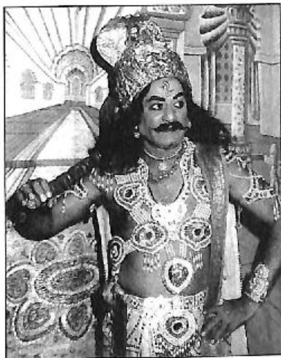
'ರಕ್ಕರಾತ್ರಿ', 'ಕುರುಕ್ಷೇತ್ರ', 'ಅಕ್ಷಯಾಂಬರ', 'ಬಾರಾಸಿಗ ಭೀಮ' ಮುಂತಾದ ನಾಟಕಗಳಲ್ಲಿ ದುರ್ಯೋಧನನ ಪಾತ್ರದಲ್ಲಿ