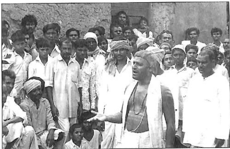
'ಅಲ್ಲಾ ನೀನೇ ನೀನೇ ಈಶ್ವರ' (ಕನ್ನಡ), 'ಈಶ್ವರ ಅಲ್ಲಾ ತೇರೇ ನಾಮ್' (ಹಿಂದಿ) ಚಲನಚಿತ್ರಗಳಲ್ಲಿ ಕಳಸದ ಗೋವಿಂದಭಟ್ಟ ಪಾತ್ರದಲ್ಲಿ