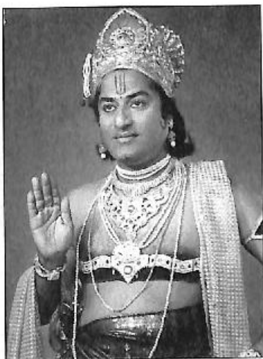
ಸುಳ್ಯದ ಶ್ರೀಶೈಲ ಮಲ್ಲಿಕಾರ್ಜುನ ನಾಟ್ಯಸಂಘದ 'ಕುರುಕ್ಷೇತ್ರ' ನಾಟಕದಲ್ಲಿ ಶ್ರೀಕೃಷ್ಣನ ಪಾತ್ರಧಾರಿ