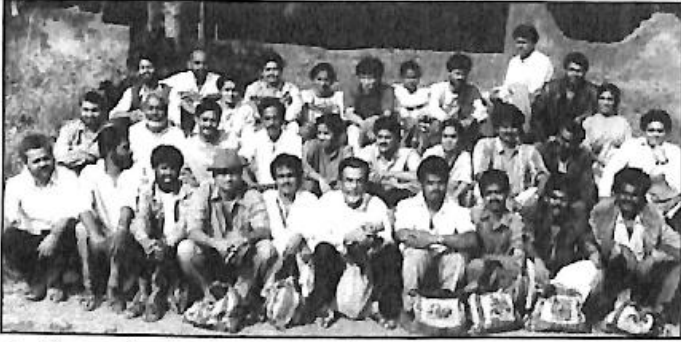
ಕಾರಂತರೊಂದಿಗೆ ರಂಗಾಯಣದ ಕಲಾವಿದರು, ಸಿಬ್ಬಂದಿ - ಅಮೇರಿಕ ಪ್ರವಾಸಕ್ಕೆ ಮುಂಚೆ