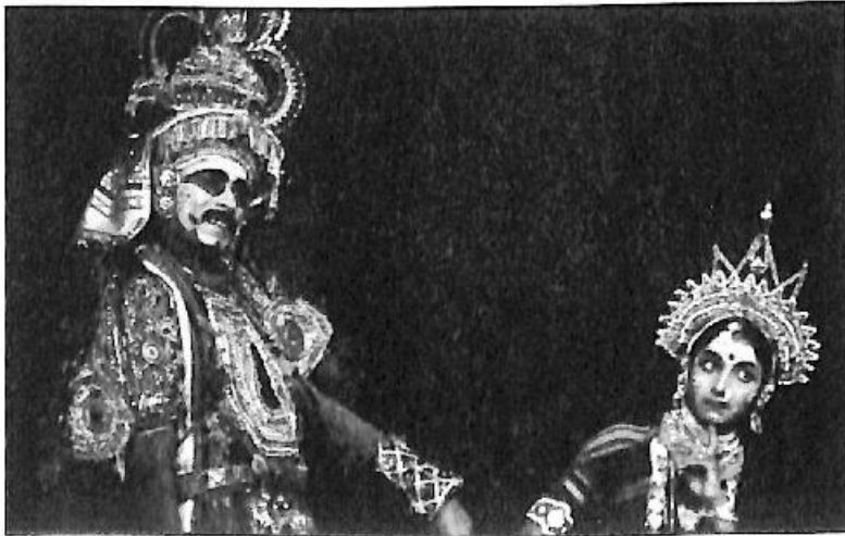
ಹುಲಸೋಗಿಯ ದೊಡ್ಡಾಟಗಳ ಅಡ್ಡಾಟಕ್ಕಾಗಿ ನಿರ್ದೇಶಿಸಿದ 'ಏಳು ಕೊಳ್ಳದ ಎಲ್ಲಮ್ಮ' ದೊಡ್ಡಾಟ