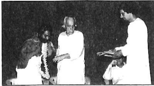
ಶಿವರಾಮಕಾರಂತರಿಂದ ಸನ್ಮಾನ - 'ರಂಗಭೂಮಿ, ಉಡುಪಿ'