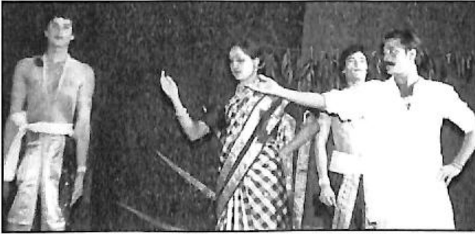
ಸೃಜನ ವೇದಿಕೆ ಬಾಗಲಕೋಟೆ- ದೊಡ್ಡಪ್ಪ ನಾಟಕದ ದೃಶ್ಯ