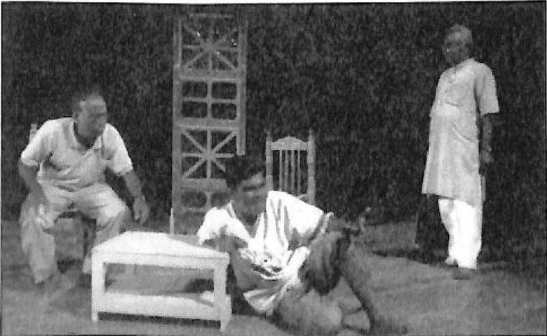
ರಂಗಾಯಣಕ್ಕಾಗಿ ನಿರ್ದೇಶಿಸಿದ ಯಶಸ್ವಿ ನಾಟಕ 'ಬೀಚಿ ಬುಲೆಟ್ಸ್' ತಾಲೀಮಿನಲ್ಲಿ