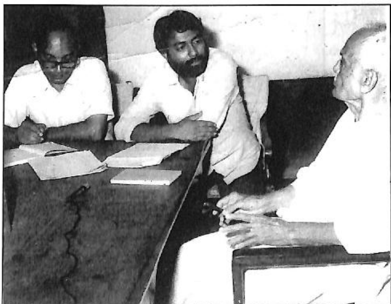
ಕೋ. ಲ. ಕಾರಂತರ ಸಂದರ್ಶನ - ಸಿ. ಆರ್. ಭಟ್ಟರೊಂದಿಗೆ