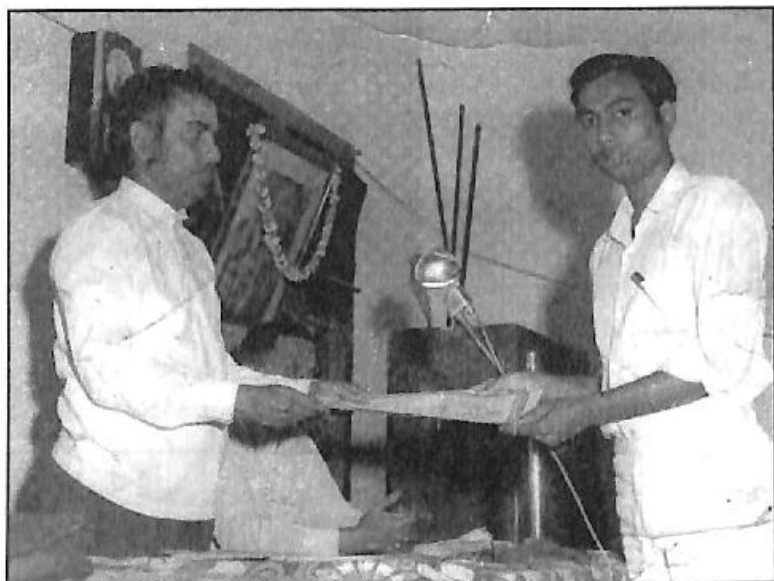
ಹೋಮಿಯೋಪತಿ ಪ್ರಮಾಣ ಪತ್ರ ಪಡೆದ ಕ್ಷಣ