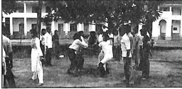
ರಂಗಕಾರ್ಯಾಗಾರ - 'ರಂಗಭೂಮಿ, ಉಡುಪಿ'