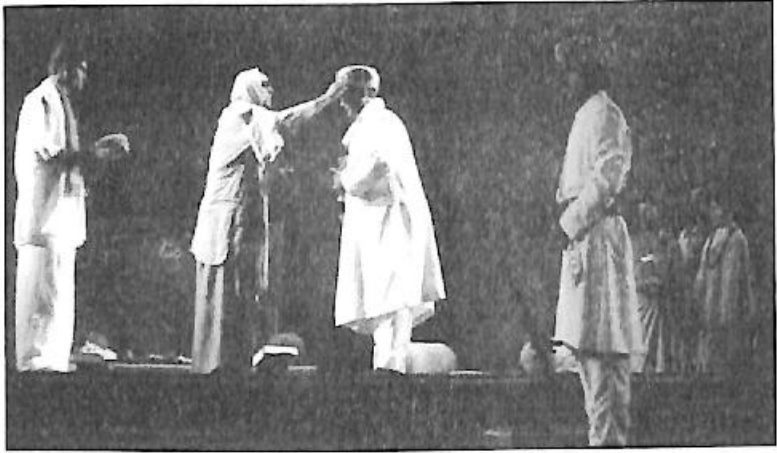
ಮೈಸೂರಿನ ಜಿ. ಎಸ್. ಎಸ್. ಕಲಾಮಂಟಪಕ್ಕಾಗಿ ನಿರ್ದೇಶಿಸಿದ 'ದಿವ್ಯಚೇತನ' ನಾಟಕ