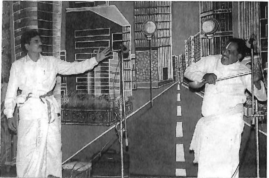
ಕಿವುಡ ಮಾಡಿದ ಕಿತಾಪತಿ