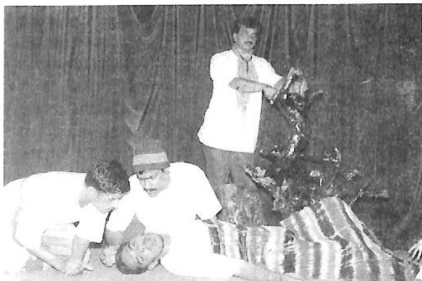
ಕುಬಿ ಮತ್ತು ಇಯಾಲ