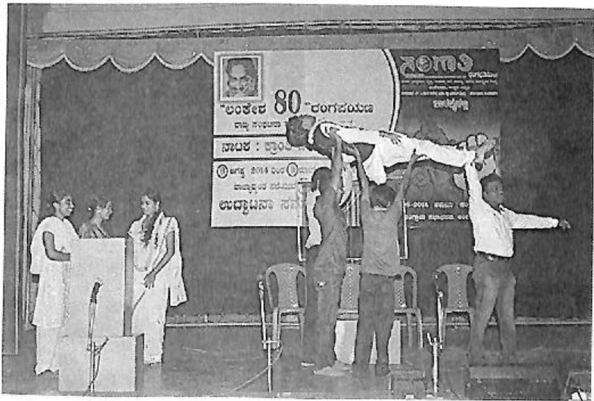
ಸಿದ್ದಿ ವಿನಾಯಕ ಗೋಳ