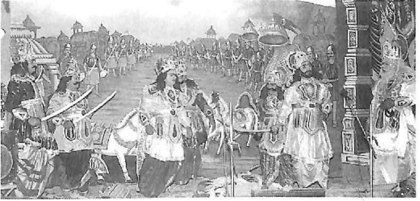
ವಿರುಪಾಕ್ಷ ಕಲಾಮಿತ್ರ ಮಂಡಳಿ