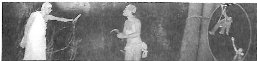
ಪರಿಸರದಲ್ಲಿ ನಾಟಕ - ಅಜ್ಜಿಗುಂಡಿ ಕಾಮ್