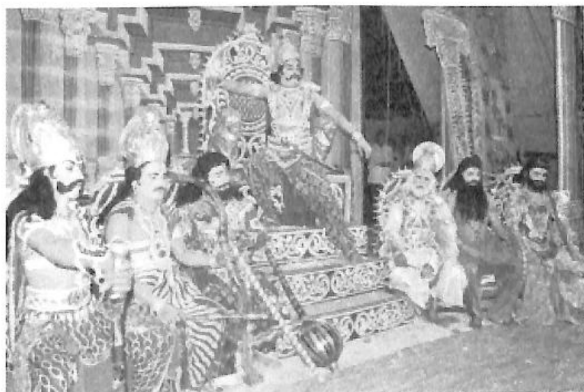
ನಾಟಕ-ಕುರುಕ್ಷೇತ್ರ, ತಂಡ - ಡಾ|| ಬಿ.ಆರ್.ಅಂಬೇಡ್ಕರ್ ಕಲಾಸಂಘ, ಚಾ.ನಗರ