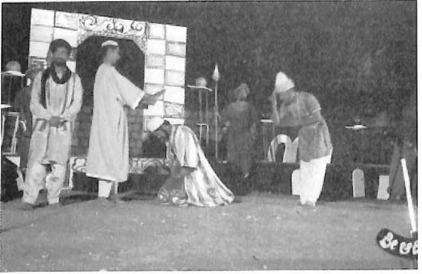
ನಾಟಕ- ತುಘಲಕ್, ತಂಡ- ರಂಗತರಂಗ