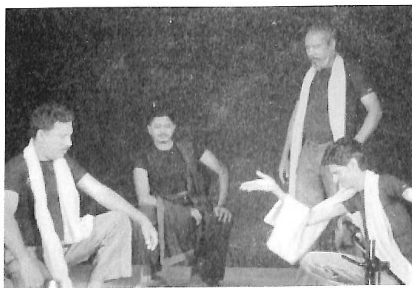
ನಾಟಕ-ಶ್ರೀ ಮತವನುತ್ತರಿಸಲಾಗದೆ?, ತಂಡ - ಅಭಿರುಚಿ