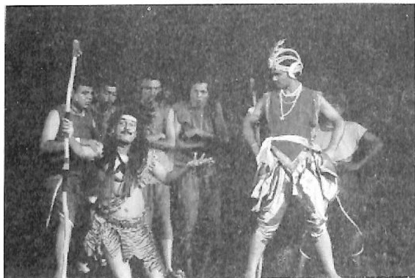
ನಾಟಕ-ಮಂಟೆಸ್ವಾಮಿ ಕಥಾಪ್ರಸಂಗ, ತಂಡ - ರಂಗವಾಹಿನಿ