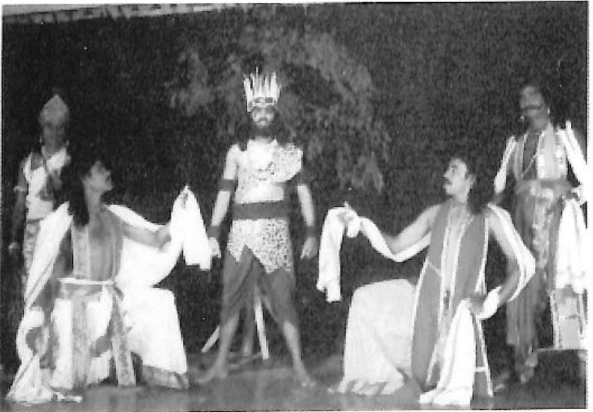
ನಾಟಕ-ಏಕಲವ್ಯ, ತಂಡ - ರಂಗತರಂಗ