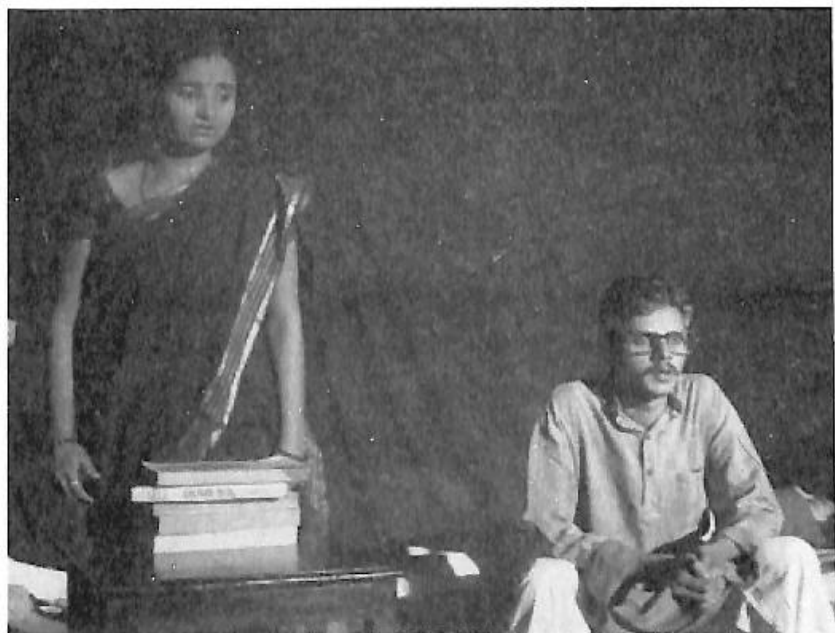
ನಾಟಕ-ಗಂಡಸ್ಯತ್ರಿ, ತಂಡ - ಶಾಂತಲಾ ಕಲಾವಿದರು