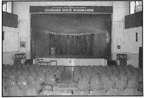
ಗೋಗಟೆ ರಂಗಮಂದಿರ. ಕ್ಯಾಂಪ್ ಬೆಳಗಾವಿ