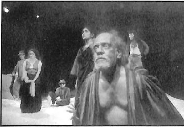
ಮೈಸೂರಿನ ರಂಗಾಯಣದ 'ಓ ಲಿಯರ್' ನಾಟಕದ ಒಂದು ದೃಶ್ಯ ನಿ : ಚಿದಂಬರರಾವ್ ಜಂಜೆ