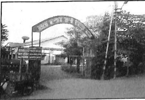
ಕಲಾಮಂದಿರ ಟೆಲಕವಾಡಿ ಬೆಳಗಾವಿ