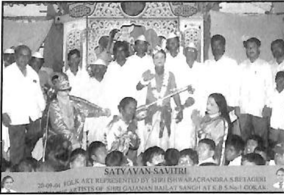
ಗೋಕಾಕಿನ ಈಶ್ವರಚಂದ್ರ ಬೆಟಗೇರಿ ಇವರ 'ಸತ್ಯವಾನ ಸಾವಿತ್ರಿ' ನಾಟಕದ ಒಂದು ದೃಶ್ಯ