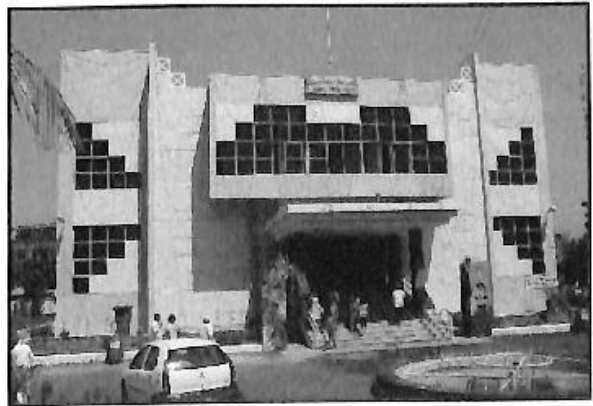
ಕುಮಾರ ಗಂಧರ್ವ ರಂಗಮಂದಿರ. ಕೋಲ್ಹಾಪೂರ ರಸ್ತೆ ಬೆಳಗಾವಿ