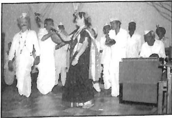
ಬೆಳಗಾವಿಯ ಸಕ್ರವ್ವ ಯಲ್ಲಪ್ಪ ಪಾತ್ರೋಟ ಇವರ ರಾಧಾನಾಟದ ಒಂದು ದೃಶ್ಯ