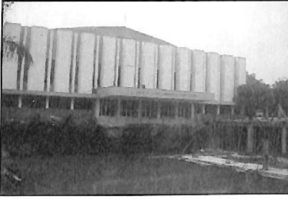
ಡಾ. ಬಿ. ಎಸ್. ಜೀರಗೆ ಸಭಾಗೃಹ, ನೆಹರುನಗರ, ಬೆಳಗಾವಿ