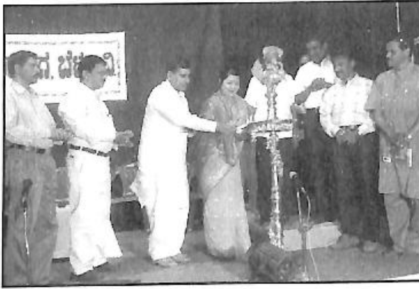
ಮುಂಬೈನ ಮಾತುಂಗದ ಕರ್ನಾಟಕ ಸಂಘದ ನಾಟಕ ಉದ್ಘಾಟನೆಯ ಒಂದು ದೃಶ್ಯ