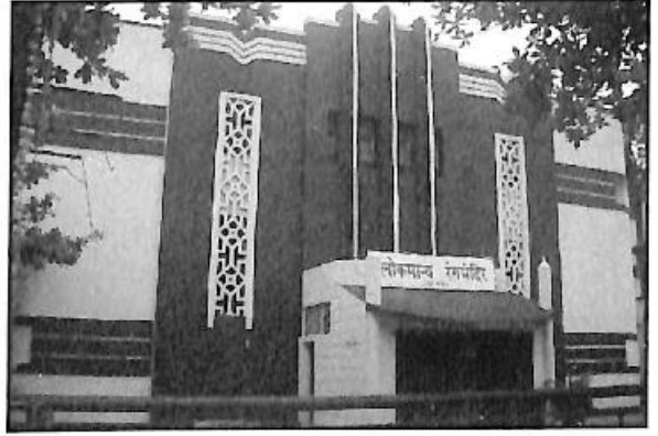
ಲೋಕಮಾನ್ಯ ರಂಗಮಂದಿರ, ಕೋನವಾಳ ಗಲ್ಲಿ ಬೆಳಗಾವಿ