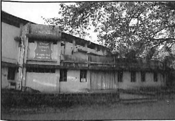
ವರೇಕರ್ ನಾಟ್ಯ ಮಂದಿರ. ಬೆಳಗಾವಿ