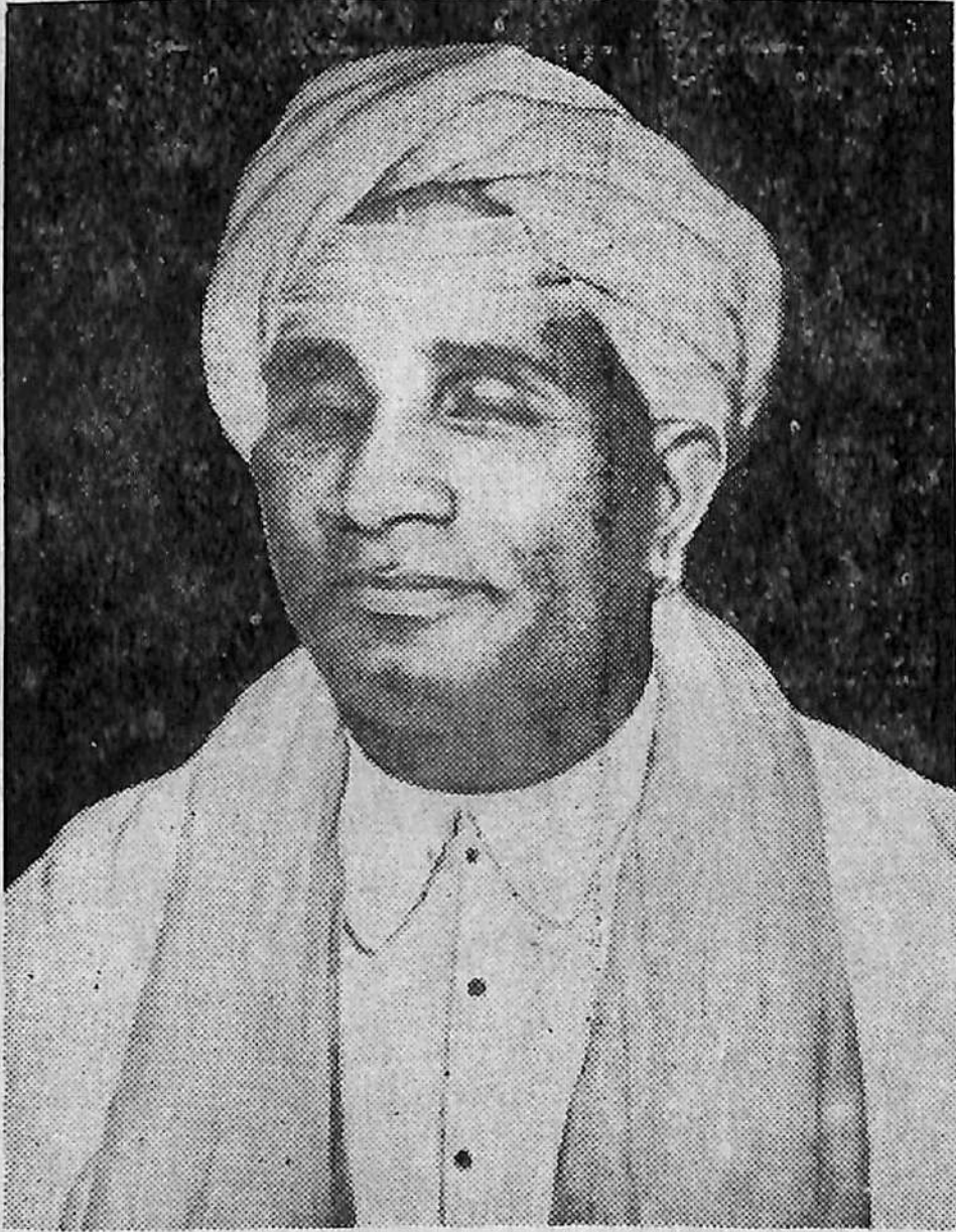
ಪಂಡಿತ್ ಪಂಚಾಕ್ಷರಿ ಗನಾಯಿಗಳು