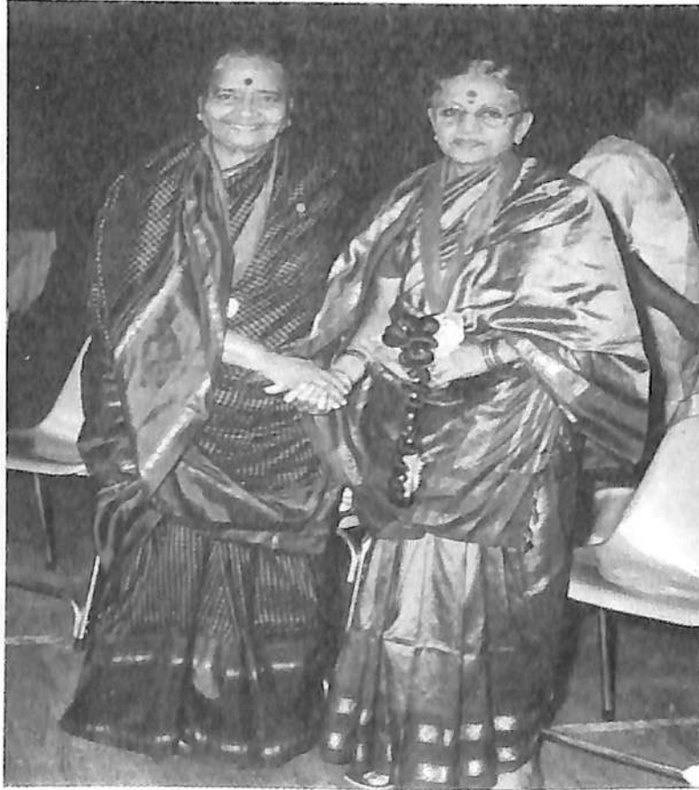
ದಿಗ್ಗಜರ ಸಮ್ಮಿಲನ-ಎಂ.ಎಸ್. ಸುಬ್ಬಲಕ್ಷ್ಮಿಯವರೊಂದಿಗೆ ಡಿ.ಕೆ. ಪಟ್ಟಮ್ಮಾಳ್