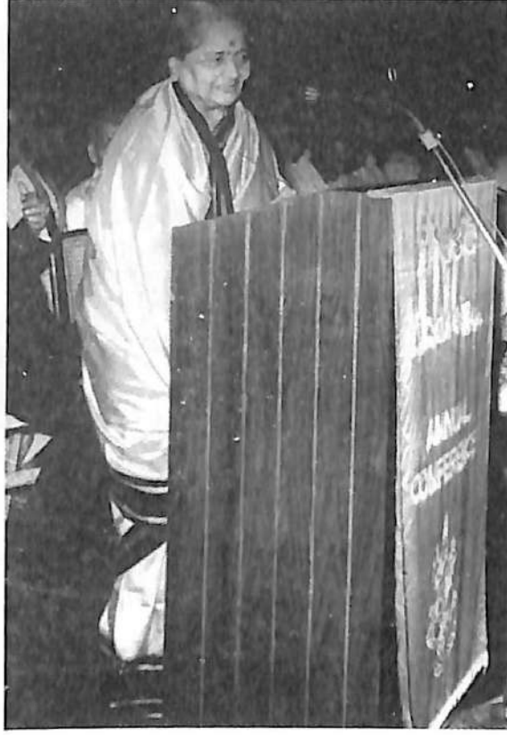
ಸಭೆಯೊಂದರಲ್ಲಿ ಡಿ.ಕೆ. ಪಟ್ಟಮ್ಮಾಳ್ ಭಾಷಣ ಮಾಡುತ್ತಿರುವುದು