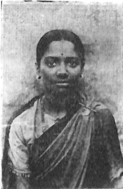
ಯುವ ಸಂಗೀತಜ್ಞರಾದ ಡಿ.ಕೆ. ಪಟ್ಟಮ್ಮಾಳ್

ಪಾದಕಥೆಯಲ್ಲಿ ಅಭಿವೃದ್ಧಿಗಾಗಿ ತನ್ನ ಕಂಪನೆಯನ್ನು ಸ್ಥಾಪಿಸಿ ಕಾರ್ಯ ವಾಹಿನಿ ಕಾರ್ಯಾಚರಣೆಗೆ ಶುರು ಮಾಡಿ ದೇಶಾದ್ಯಂತ ಪಾದಕಥೆಯನ್ನು ಪ್ರಚಾರಿಸಿ ದಿ. ಕೆ. ಪಟ್ಟಮ್ಮಾಳ್