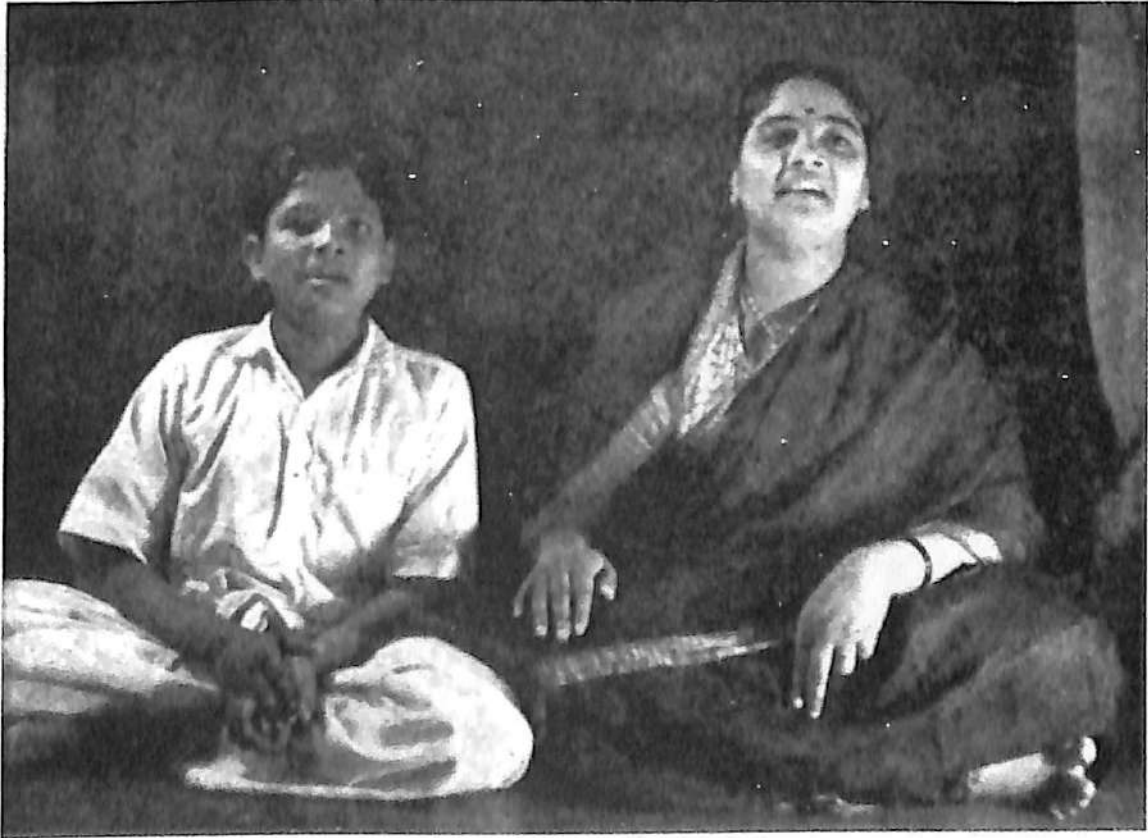
ಸಹೋದರ ಡಿ.ಕೆ. ಜಯರಾಮನ್‌ರೊಂದಿಗೆ ಡಿ.ಕೆ. ಪಟ್ಟಮ್ಮಾಳ್ ಸಂಗೀತ ಅಭ್ಯಾಸ