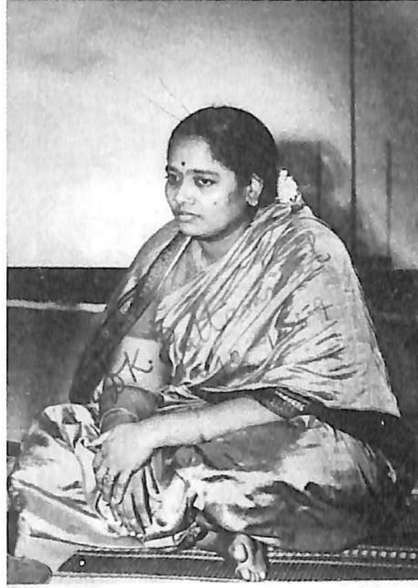
1940ರ ದಶಕದಲ್ಲಿನ ಡಿ.ಕೆ. ಪಟ್ಟಮ್ಮಾಳರ ಚಿತ್ರ