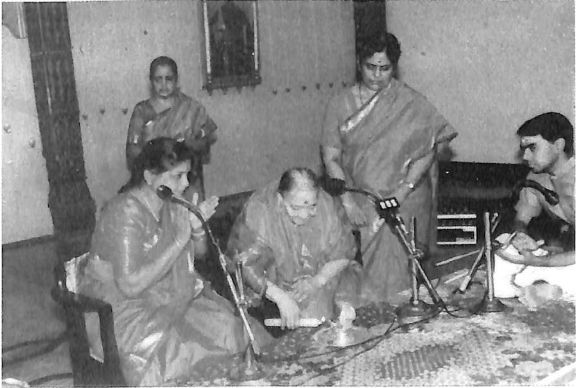
ಸಮಾರಂಭವೊಂದರ ಉದ್ಘಾಟಿಸುತ್ತಿರುವ ಡಿ.ಕೆ. ಪಟ್ಟಮ್ಮಾಳ್