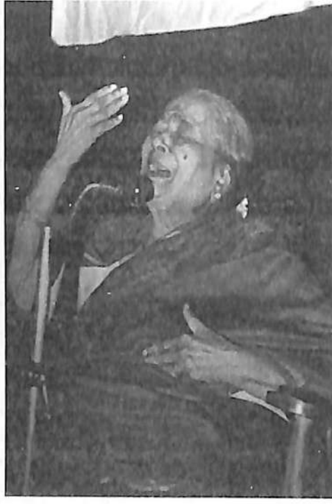
ಡಿ.ಕೆ. ಪಟ್ಟಮ್ಮಾಳರ ಕಲಾರಾಧನೆ