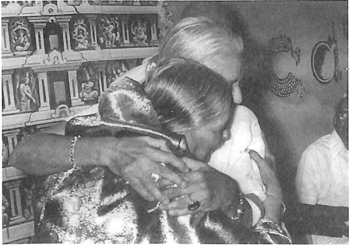
ಸಭೆಯೊಂದರಲ್ಲಿ ಆತ್ಮೀಯರೊಂದಿಗೆ ಡಿ.ಕೆ. ಪಟ್ಟಮ್ಮಾಳ್