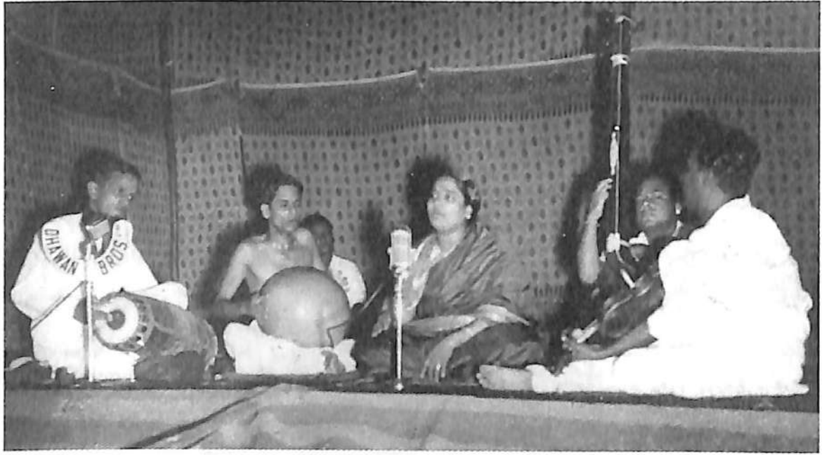
1940ರ ಒಂದು ಸಂಗೀತ ಕಚೇರಿಯಲ್ಲಿ ನಿರತರಾದ ಡಿ.ಕೆ. ಪಟ್ಟಮ್ಮಾಳ್