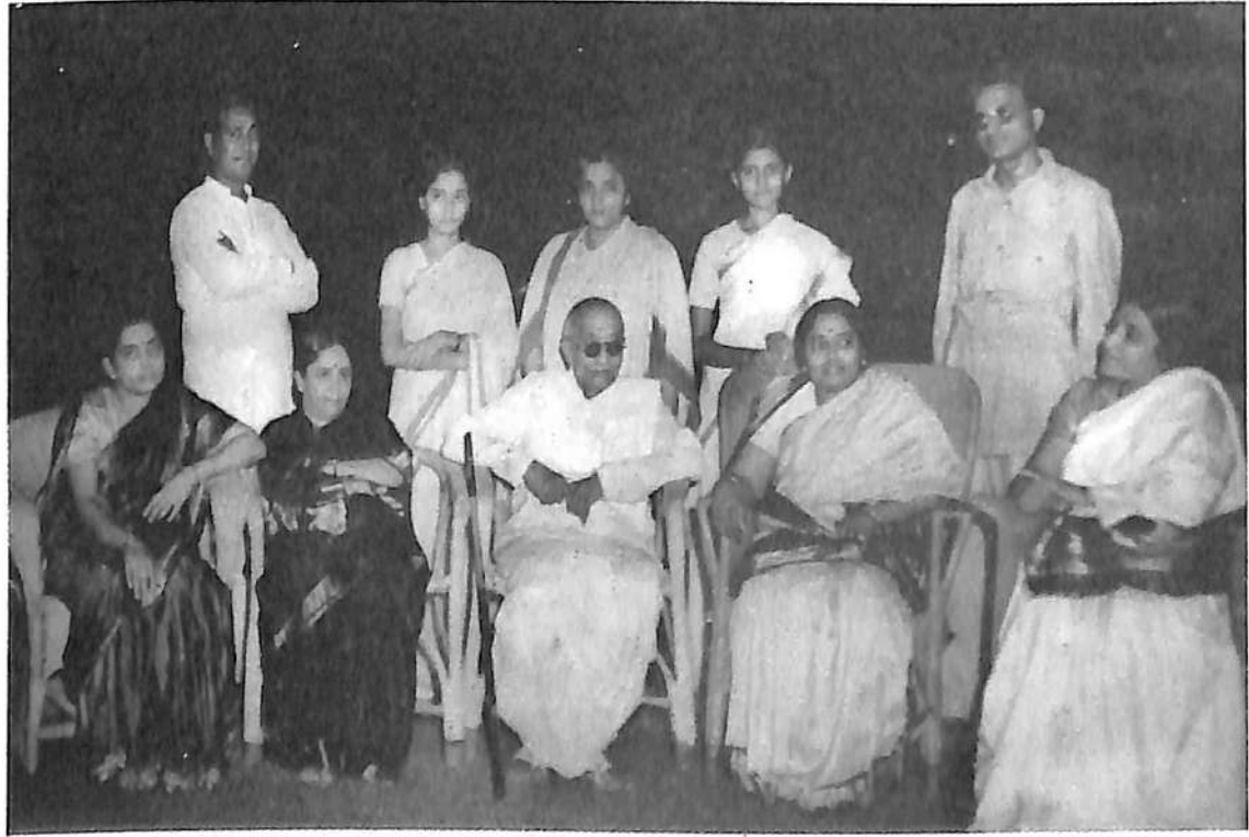
ಶ್ರೀರಾಜಾಜಿಯವರೊಂದಿಗೆ ಡಿ.ಕೆ. ಪಟ್ಟಮ್ಮಾಳ್