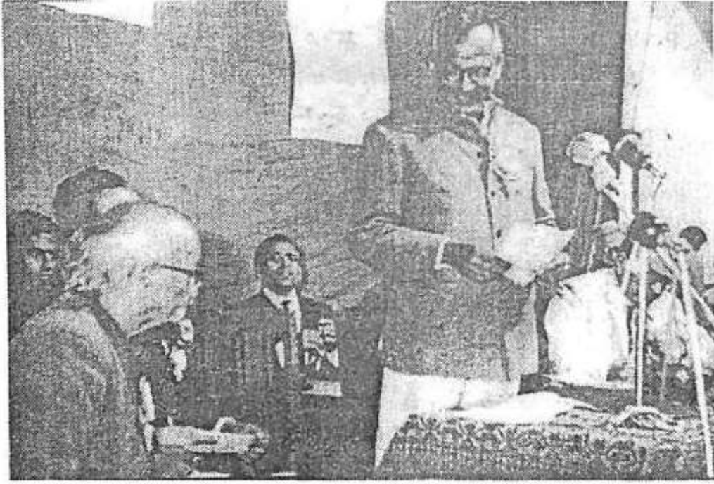
1970ರಲ್ಲಿ ಜರುಗಿದ ಧಾರವಾಡ ಜಿಲ್ಲಾ ಸಾಹಿತ್ಯ ಸಮ್ಮೇಳನದಲ್ಲಿ ಬಸವರಾಜ ಕಟ್ಟೀಮನಿಯವರು ಮಾತನಾಡುತ್ತಿರುವುದು. ಚಿತ್ರದಲ್ಲಿ ವರಕವಿ ಡಾ. ದ.ರಾ. ಬೇಂದ್ರೆಯವರು ಇದ್ದಾರೆ.