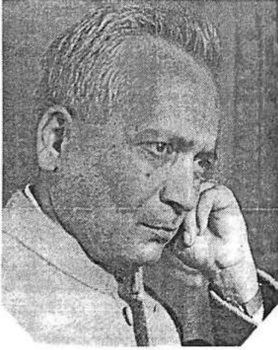
ಖ್ಯಾತ ಕಾದಂಬರಿಕಾರ ಬಸವರಾಜ ಕಟ್ಟೀಮನಿ