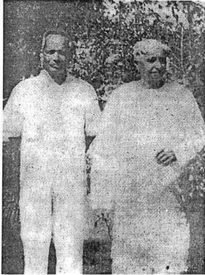
ರಾಷ್ಟ್ರಕವಿ ಕುವೆಂಪು ಅವರೊಂದಿಗೆ ಬಸವರಾಜ ಕಟ್ಟೀಮನಿ