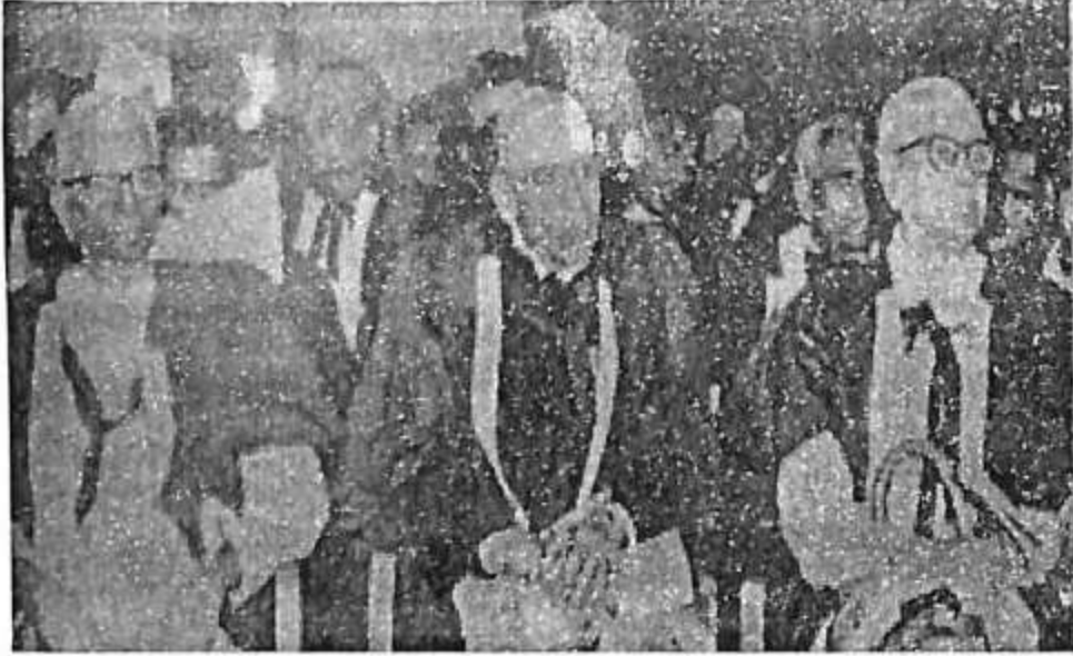
೧೯೭೪ರಲ್ಲಿ ಕರ್ನಾಟಕ ವಿಶ್ವವಿದ್ಯಾಲಯ ಗೌರವ ಡಾಕ್ಟರೇಟ ಪದವಿ ನೀಡಿದ ಸಂಧರ್ಭ. (ಡಾ. ಬೆಟಗೇರಿ ಕೃಷ್ಣರಮ್, ಡಾ. ಮಲ್ಲಿಕಾರ್ಜುನ ಮನ್ಸೂರ್, ಡಾ. ವಾಯ್, ನಾಗೇಶ ಶಾಸ್ತ್ರಿ) (ಬೆಲವಳು)