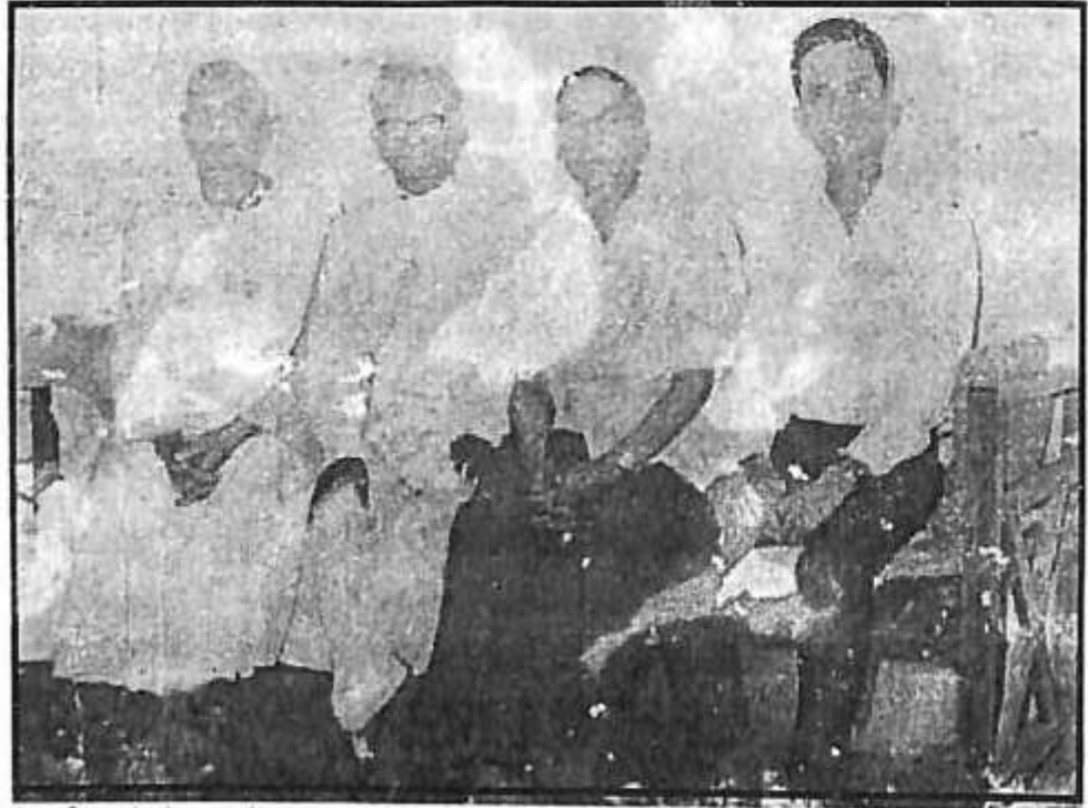
ಶ್ರೀ ಗೋರುರು ರಾಮಸ್ವಾಮಿ ಅಯ್ಯಂಗಾರ ಮುಂತಾದವರು. ಬೆಟಗೆರಿ ಕೃಷ್ಣರಮ್, ಡಾ. ರಂ. ಶ್ರೀ. ಮುಲಗ೯