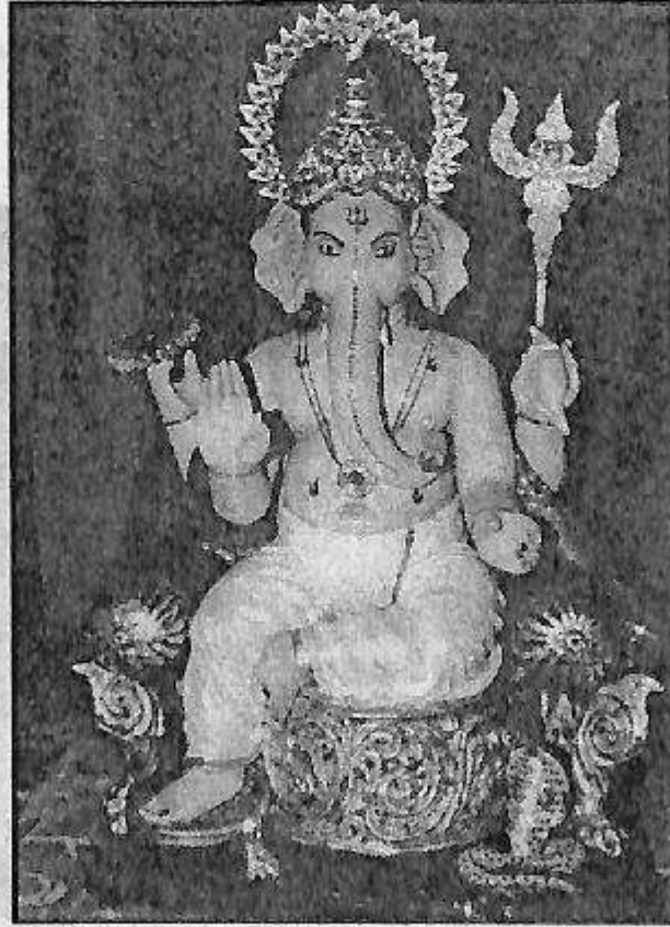
ಗಜಾನನ ಮಹಾಲೆ ನಿರ್ಮಿಸಿದ ಅನೇಕ ಗಣಪತಿ ಮೂರ್ತಿಗಳಲ್ಲಿ ಒಂದು