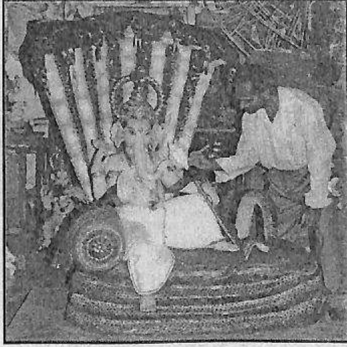
ತಾವು ನಿರ್ಮಿಸಿದ ಗಣಪತಿ ಮೂರ್ತಿಗೆ ಬಣ್ಣ ನೀಡಿ ಸಿದ್ಧ ಪಡಿಸುತ್ತಿರುವುದು