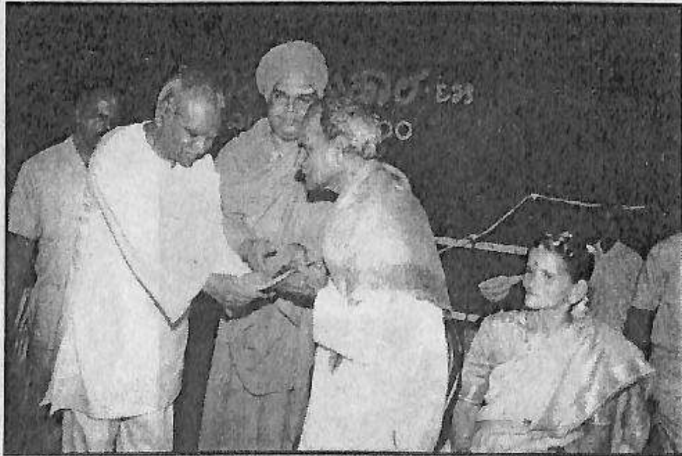
ಗಜಾನನ ಮಹಾಲೆಯವರಿಗೆ ಓಣಿ ತುಂಬಿದಾಗ ಧಾರವಾಡದಲ್ಲಿ ಸಾರ್ವಜನಿಕ ಸಮ್ಮಾನ