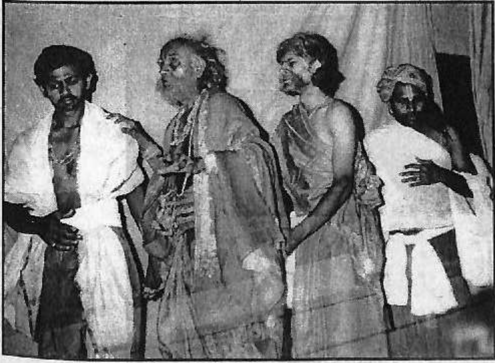
'ಅಂಧಯುಗ' (೧೯೭೯)ದ 'ಧೃತರಾಷ್ಟ್ರ' ಪಾತ್ರ (ಮಧ್ಯದಲ್ಲಿ)