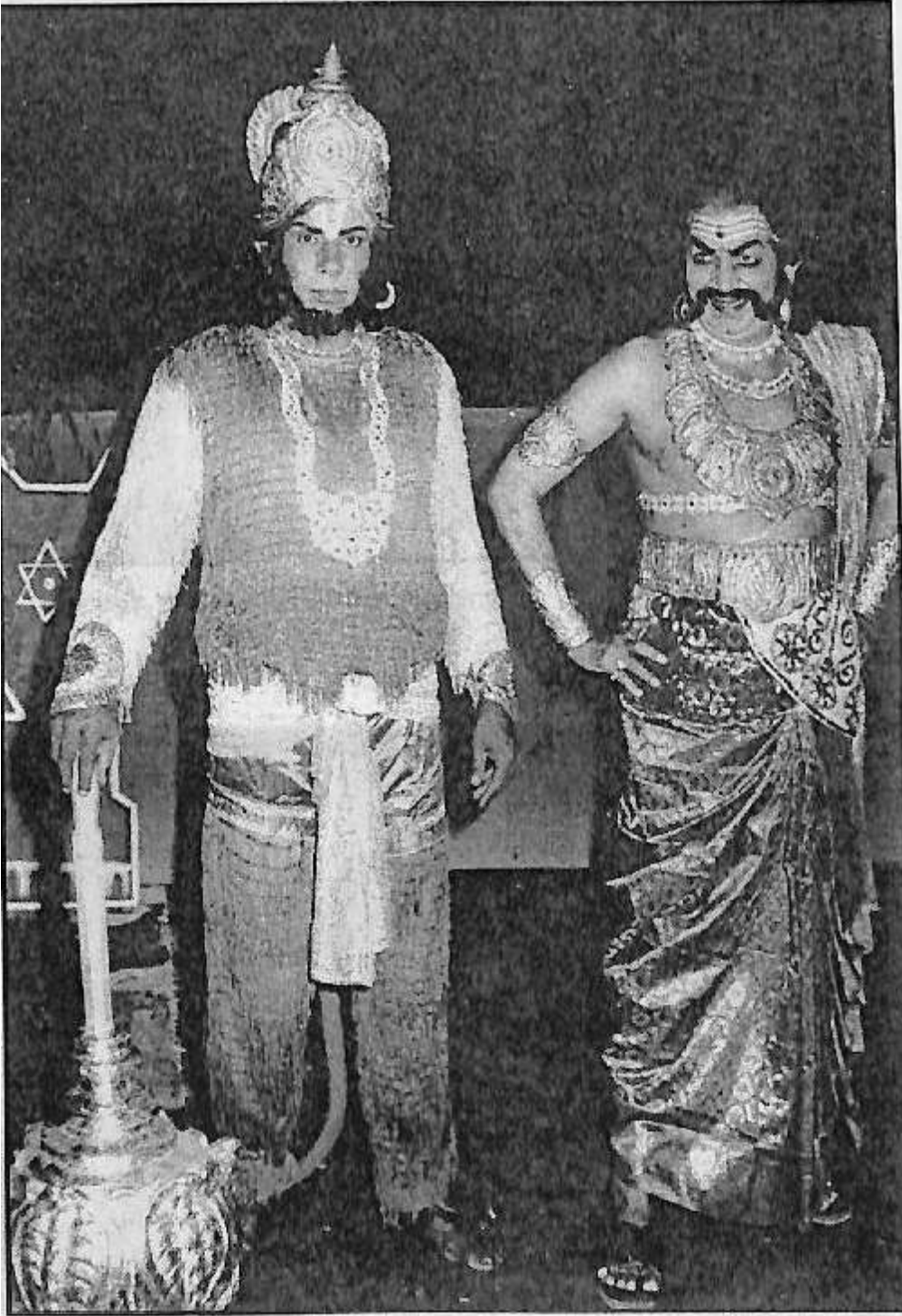
‘ ಪ್ರಚಂಡ ರಾವಣ ’ ನಾಟಕದಲ್ಲಿ ಎಚ್. ಟಿ. ಅರಸು ಹಾಗೂ ಸಹಕಲಾವಿದ