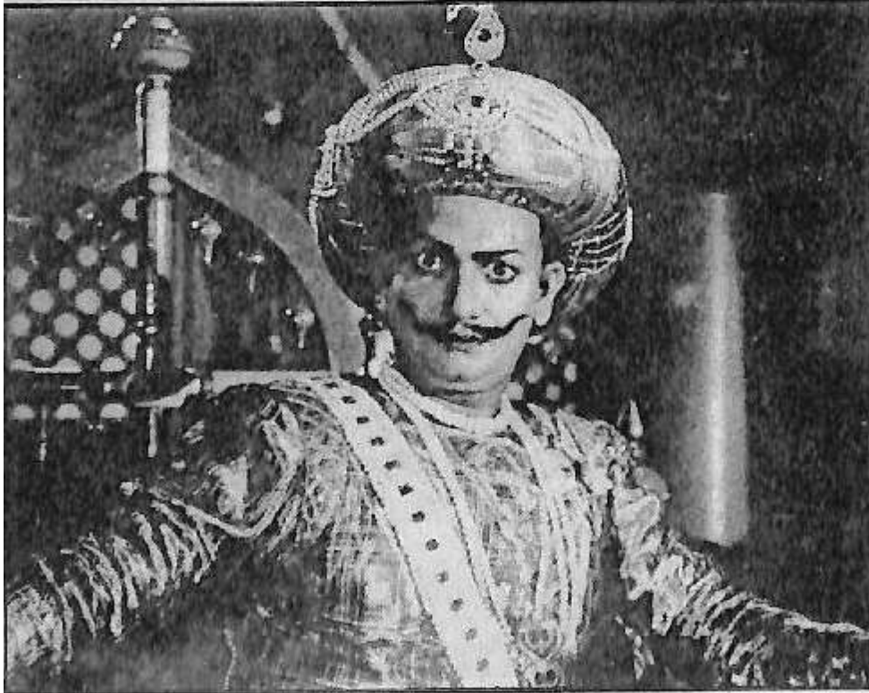
'ಕಿತ್ತೂರು ಚೆನ್ನಮ್ಮ' ಚಿತ್ರದಲ್ಲಿ ಟಿಪ್ಪುಸುಲ್ತಾನ್ ಪಾತ್ರದಲ್ಲಿ