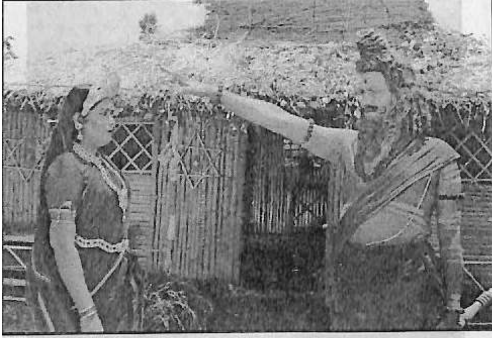
'ನಂಜುಂಡೇಶ್ವರ ಮಹಾತ್ಮೆ' ಸಿನೆಮಾದಲ್ಲಿ ಜಮದಗ್ನಿ ಪಾತ್ರದಲ್ಲಿ