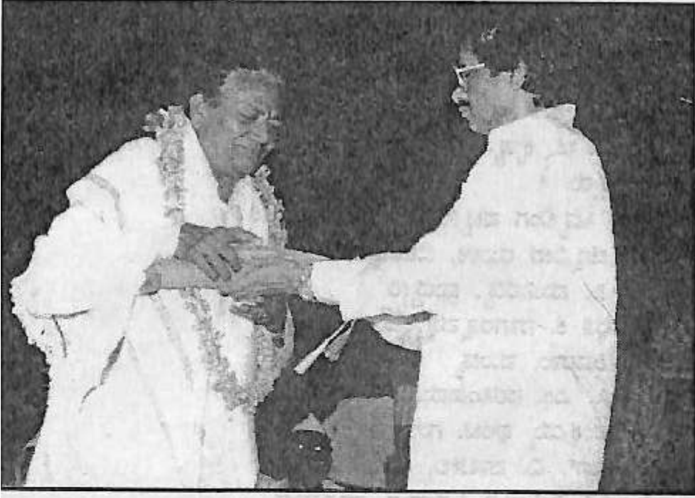
ಮುಖ್ಯಮಂತ್ರಿ ಬಂಗಾರಪ್ಪನವರಿಂದ ಕರ್ನಾಟಕ ರಾಜ್ಯೋತ್ಸವ ಪ್ರಶಸ್ತಿಯನ್ನು ಸ್ವೀಕರಿಸುತ್ತಿರುವುದು (೧೯೯೨)