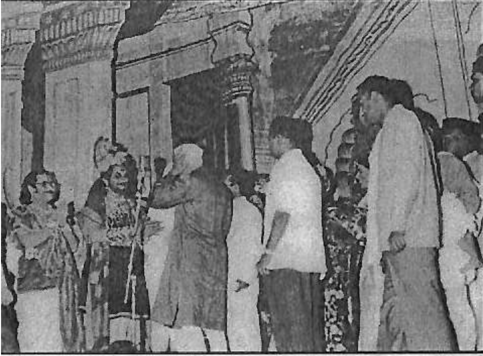
ಭಾರತದ ಪ್ರಧಾನಮಂತ್ರಿ, ಜವಾಹರಲಾಲರು ನಾಟಕ ನೋಡಿ ಪ್ರಶಂಸಿಸಿದರು