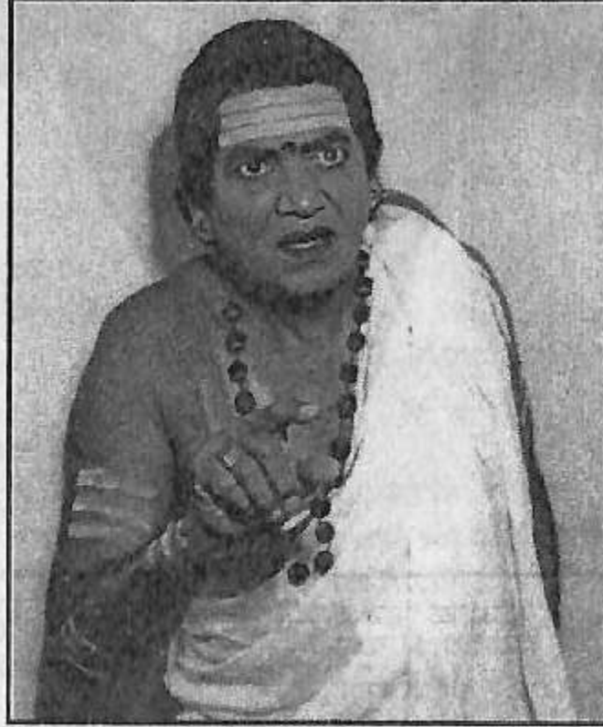
'ವಿಪ್ರ ದರ್ಶನ' ನಾಟಕದಲ್ಲಿ