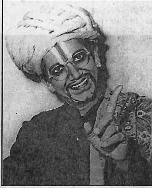
'ಅತ್ತೆ ಸೊಸೆ' ನಾಟಕದಲ್ಲಿ ಮಾರವಾಡಿ ಪಾತ್ರದಲ್ಲಿ