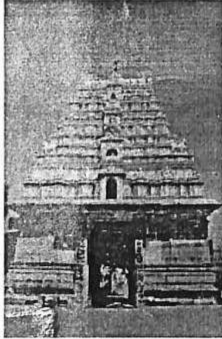
ಗದುಗಿನ ಶ್ರೀ ವೀರನಾರಾಯಣ ದೇವಸ್ಥಾನ