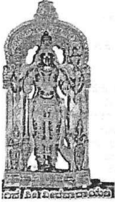
ಹುಯಿಲಗೋಳ ನಾರಾಯಣರಾಯರ ಆರಾಧ್ಯ ದೈವ ಗದುಗಿನ ಶ್ರೀ ವೀರನಾರಾಯಣ