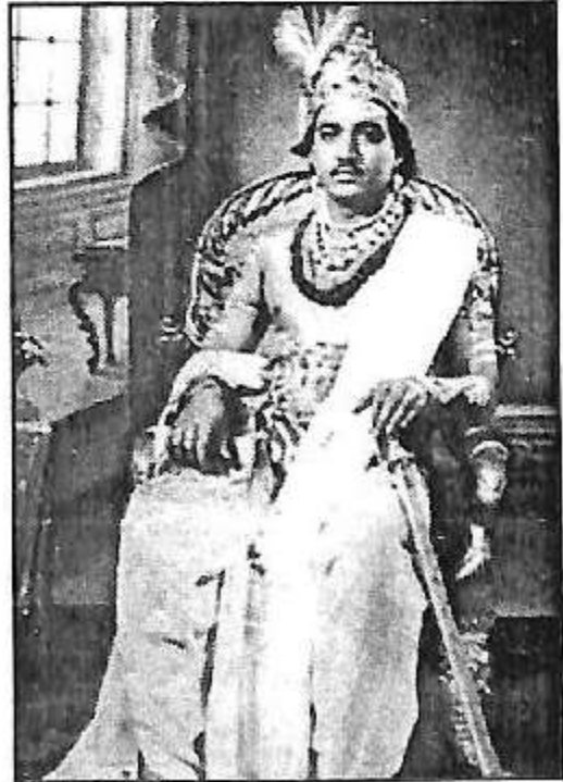
ಜಗಜ್ಯೋತಿ ಬಸವೇಶ್ವರ ಪಾತ್ರದಲ್ಲಿ ಸಿದ್ದರಾಜ್ ಉಜ್ಜಯಿನಿ ಮಠ(ಕಂಚಿಕೇರಿ ಕಂಪನಿ)