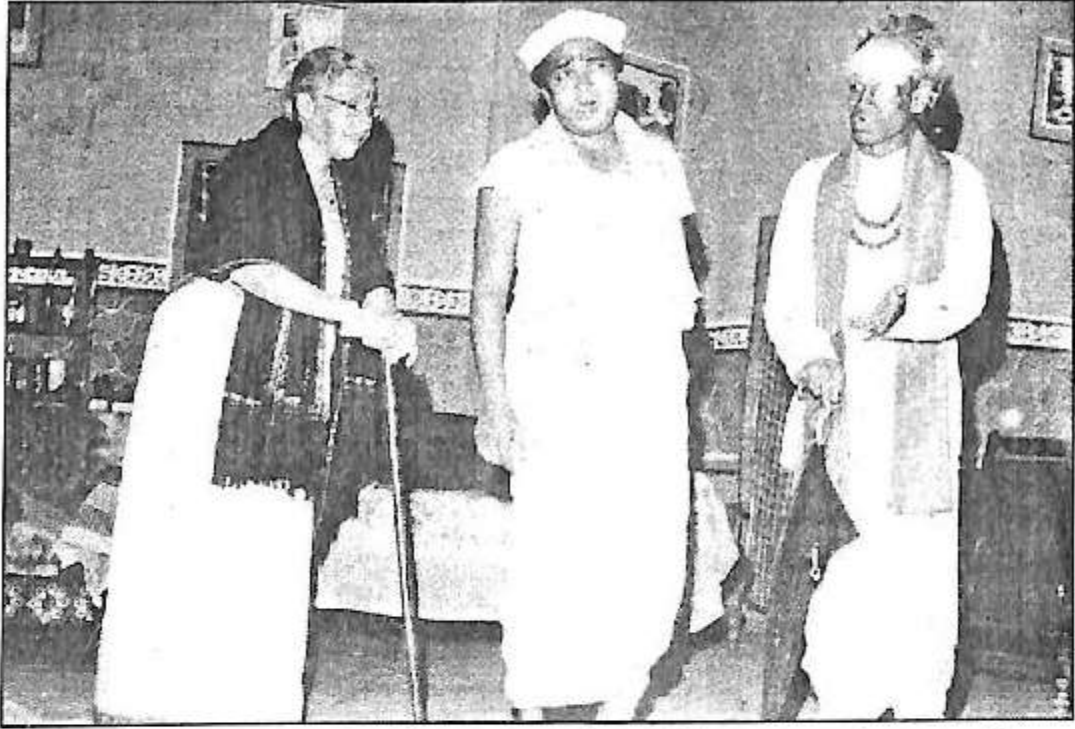
ಕಲಬುರ್ಗಿ-1966 ಖಾದಿಪೀಠೆ ನಾಟಕ ಯಶೋದರಮ್ಮ (ಎಂ.ಎಲ್.ಎ. ಪಾತ್ರ) ಓಬಳೇಶ್ವರ, ಕಂಚಿಕೇರಿ ಶಿವಣ್ಣ