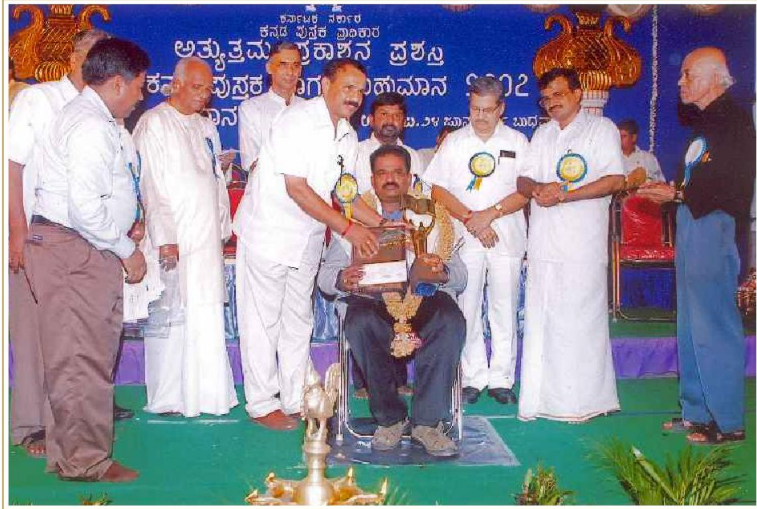
ಕನ್ನಡ ಪುಸ್ತಕ ಪ್ರಾಧಿಕಾರದಿಂದ 'ಕರ್ನಾಟಕ - ವಾಸ್ತುಶಿಲ್ಪ ಉದ್ಯಾನ' ಪುಸ್ತಕಕ್ಕೆ ಅತ್ಯುತ್ತಮ ಪ್ರಕಾಶನ ಪ್ರಶಸ್ತಿ ಪ್ರದಾನ ಸಮಾರಂಭ