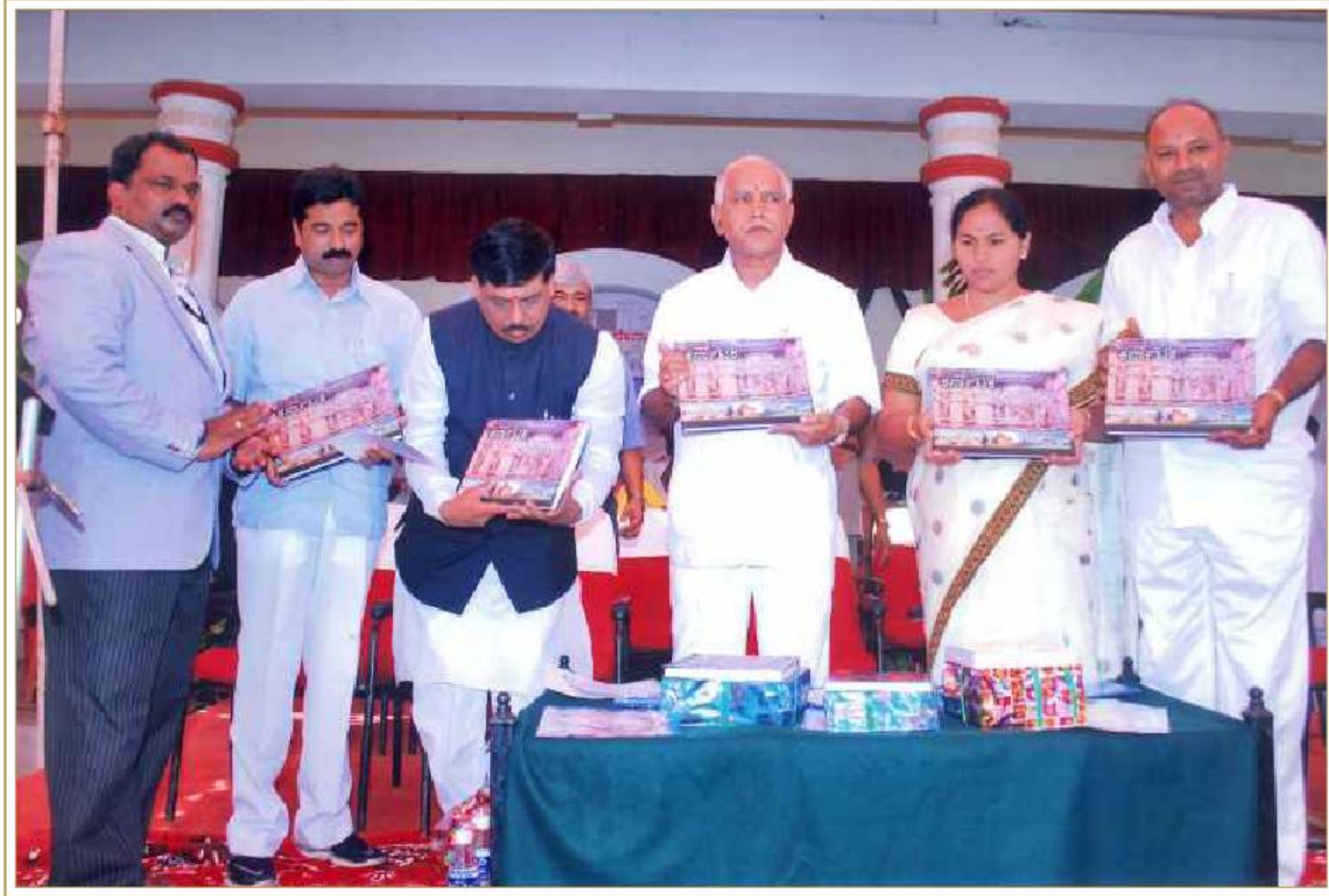
ಸನ್ಮಾನ್ಯ ಮುಖ್ಯಮಂತ್ರಿಗಳಾದ ಶ್ರೀ ಬಿ.ಎಸ್ ಯಡ್ಕೂರಪ್ಪ ಅವರಿಂದ 'ಕರ್ನಾಟಕ - ವಾಸ್ತುಶಿಲ್ಪ ಉದ್ಘಾಟನೆ' ಪುಸ್ತಕ ಬಿಡುಗಡೆ ಸಮಾರಂಭ