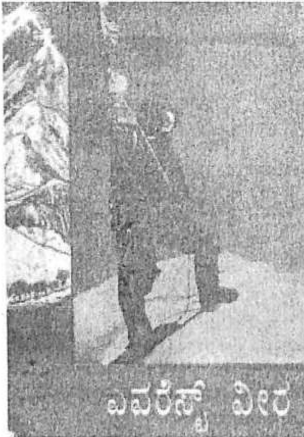
'ಎವರೆಸ್ತ್ ವಿಲರ' ಪುಸ್ತಕದ ಮುಖಪುಟ