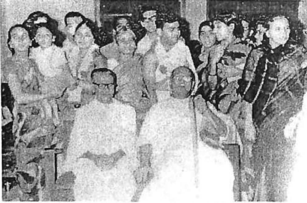
ಕೌಟುಂಬಿಕ ಸಮಾರಂಭದಲ್ಲಿ ಡಿ.ವಿ. ಗುಂಡಪ್ಪನವರು.