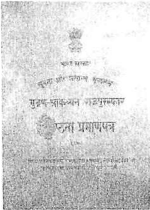
'ಎವರೆಸ್‌ಟ್‌ ಎಲೆ' ಕೃತಿಗೆ ರಾಷ್ಟ್ರೀಯ ಪುರಸ್ಕಾರ