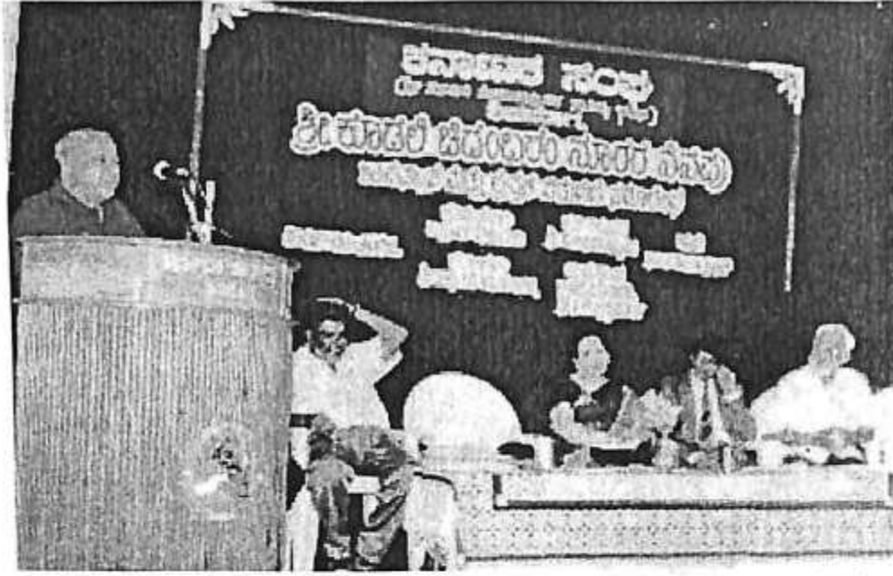
'ಶಿವಮೊಗ್ಗ ಕರ್ನಾಟಕ ಸಂಘ' ದಿಂದ ಕೂಡಲಿ ಚಿದಂಬರಂ ನೂರರ ನೆನಪು ಸಮಾರಂಭ.