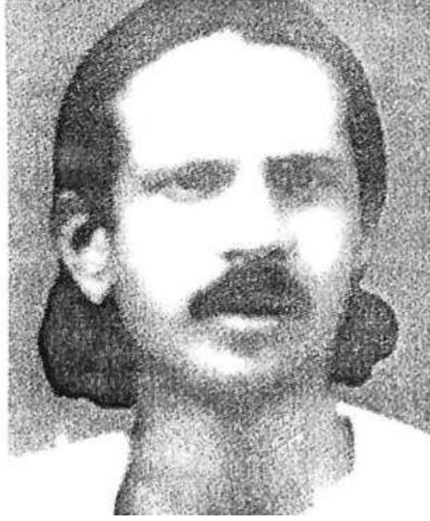
ಸಹೋದರ ನರಸಿಂಹ ಕಾರಂತ