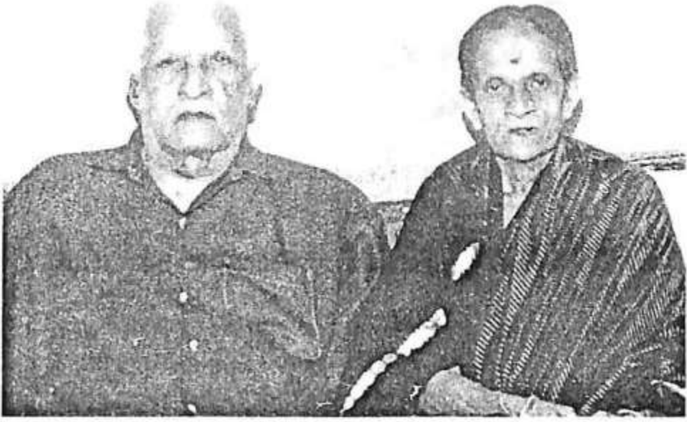
ಕೆ.ಆರ್. ಕಾರಂತರು ಪತ್ನಿ ರಮಾ ಅವರೊಂದಿಗೆ