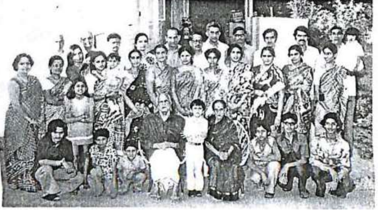
ತಮ್ಮ ಲಂನೇ ಹುಟ್ಟುಹಬ್ಬದ ಸಂದರ್ಭದಲ್ಲಿ ಕುಟುಂಬವರ್ಗದವರೊಂದಿಗೆ ತೆಗೆಸಿಕೊಂಡ ಛಾಯಾಚಿತ್ರ