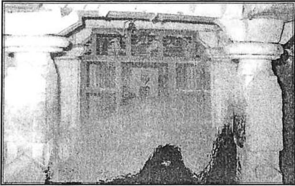
ಕಂಚೇಶ್ವರ ದೇವಾಲಯ - ನಿಡಗುಂದಿ ಪ್ರೊ. ಭೂಸನೂರಮಠರು ಸ್ನೇಹಿತರೊಂದಿಗೆ ಚರ್ಚಿಸುತ್ತಿದ್ದ ಸ್ಥಳ