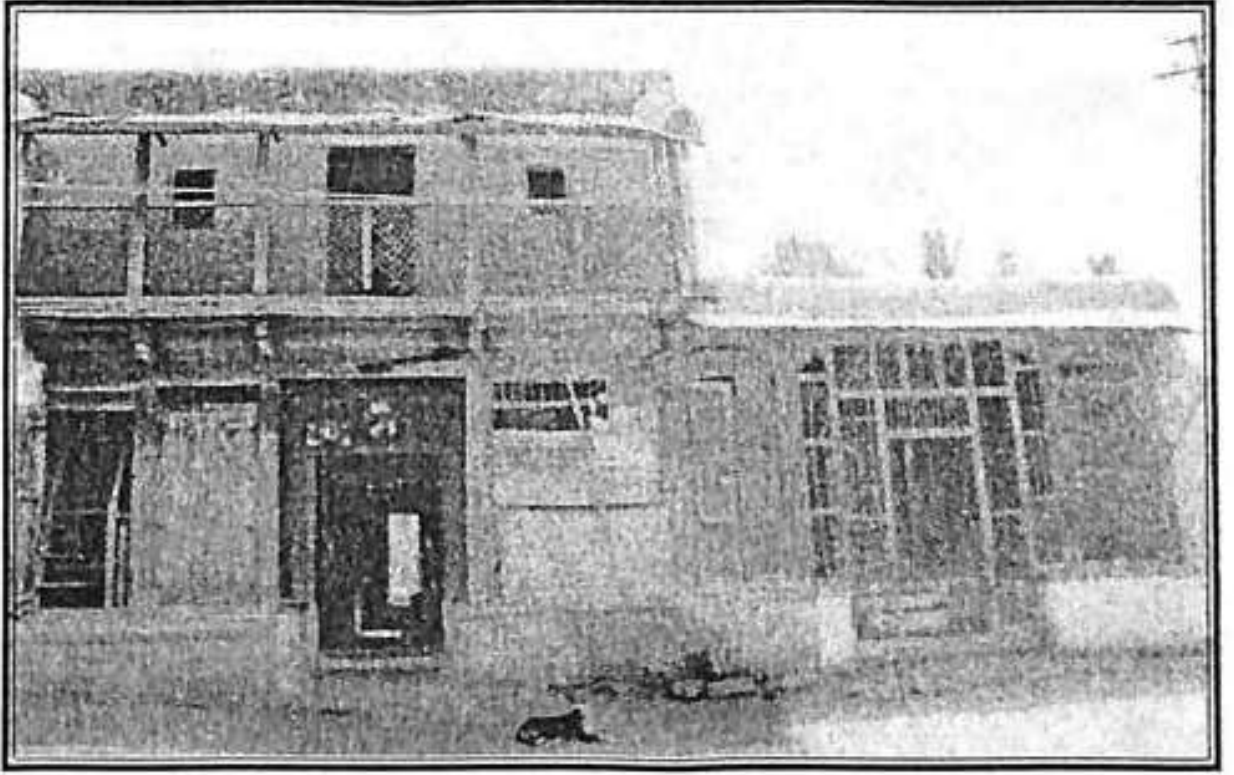
ಪ್ರೊ. ಭೂಸನೂರಮಠರು ಹುಟ್ಟಿದ ಮನೆ - ನಿಡಗುಂದಿ