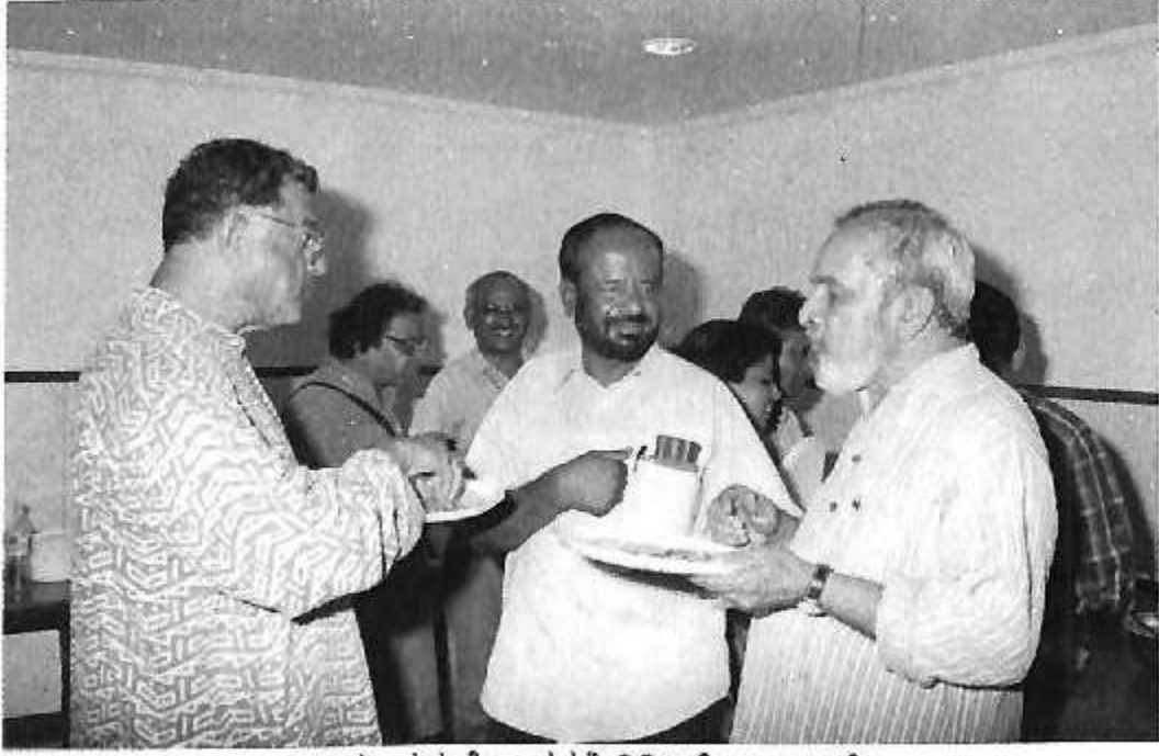
ಕಾರ್ಯಕ್ರಮರೂಂದರಲ್ಲಿ ಗಿರೀಶ್ ಕಾರ್ನಾಡ್, ಡಾ|| ಯು.ಆರ್. ಅನಂತಮೂರ್ತಿರವರೂಂದಿಗೆ