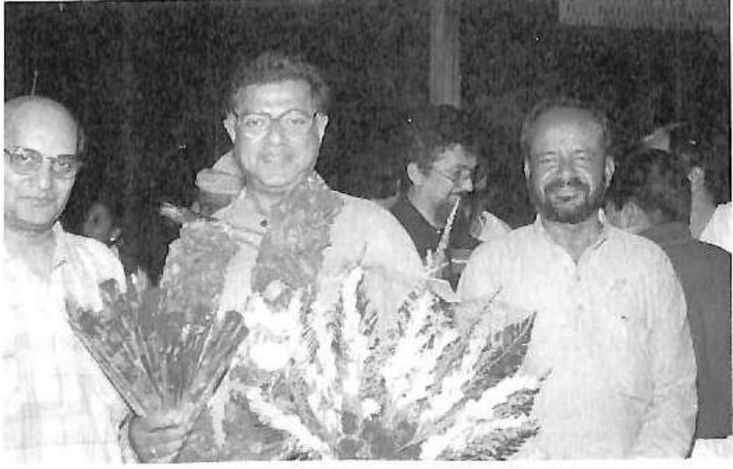
ಖ್ಯಾತ ನಾಟಕಕಾರ ಗಿರೀಶ್ ಕಾರ್ನಾಡ್ ಅವರೊಂದಿಗೆ