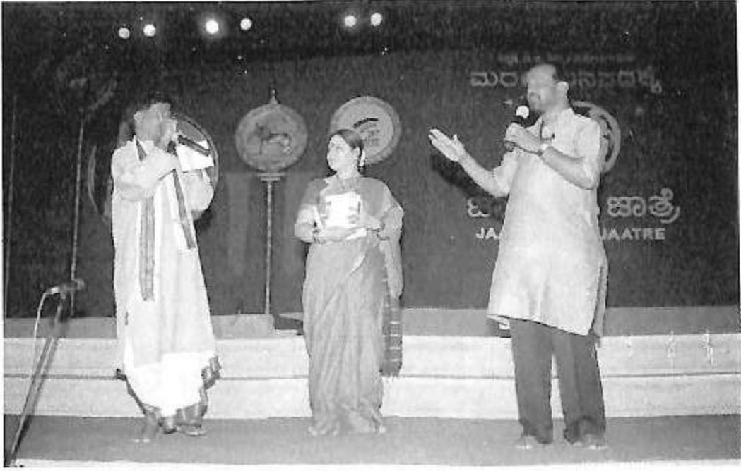
ಜಾನಪದ ಜಾತ್ರೆ ಕಾರ್ಯದಲ್ಲಿ