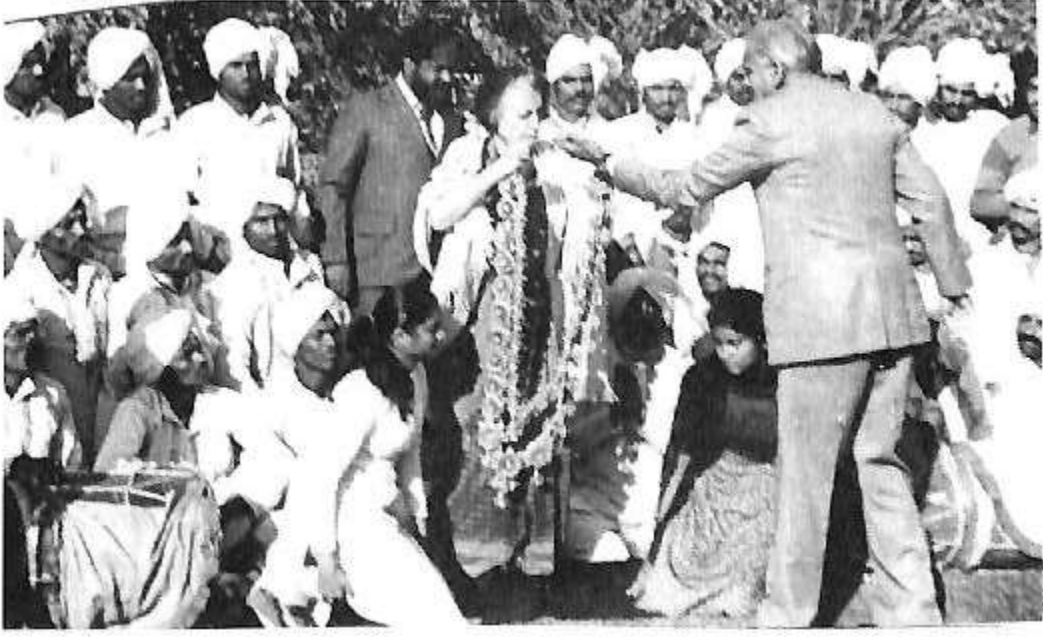
ಪ್ರಧಾನ ಮಂತ್ರಿ ಶ್ರೀಮತಿ ಇಂದಿರಾಗಾಂಧಿ ಅವರಿಗೆ ಗೌರವ ಸಮರ್ಪಣೆ