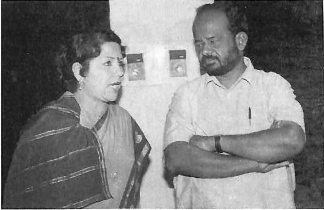
ಪದ್ಮಶ್ರೀ ಚಿಂದುಡಿ ಲೀಲಾ ಅವರೂಂದಿಗೆ ಸಮಲೂಚನೆ