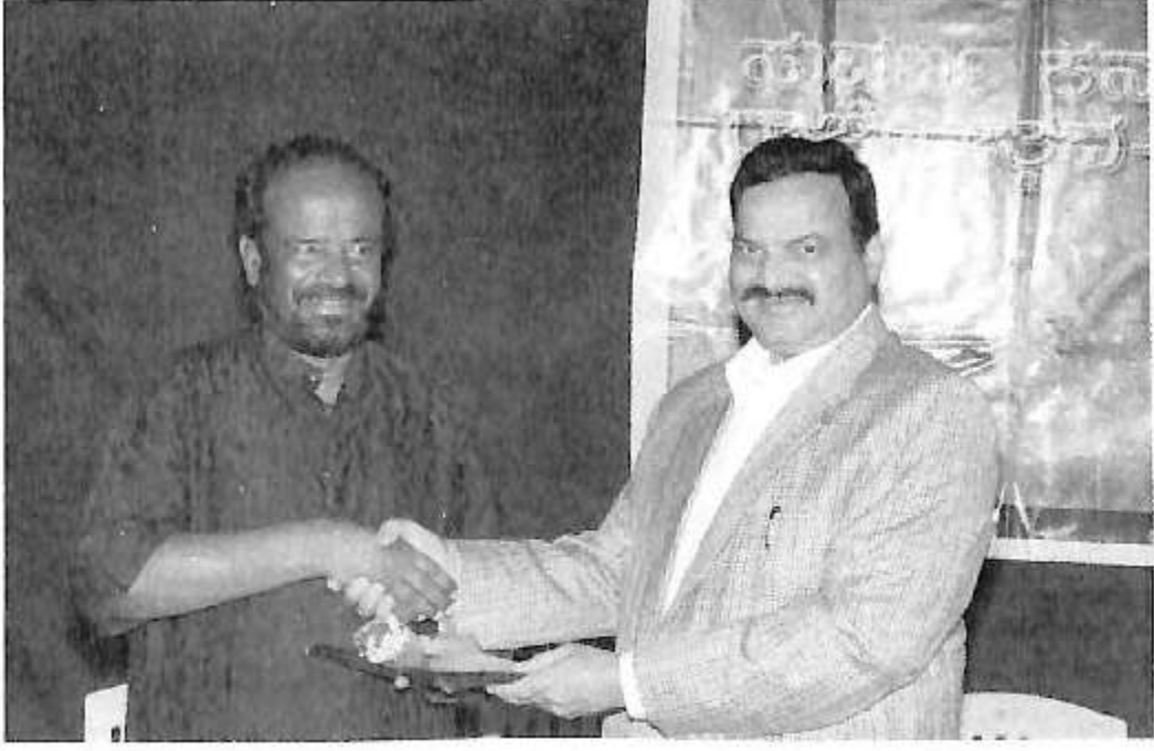
ಹಿರಿಯ ಐ.ಎ.ಎಸ್ ಅಧಿಕಾರಿ ಐ.ಎಂ ವಿಠಲಮೂರ್ತಿ ಅವರೊಂದಿಗೆ