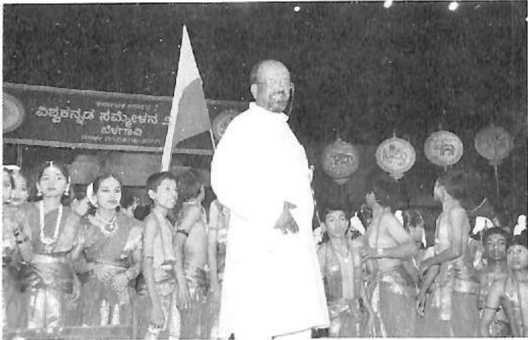
ಬೆಳಗಾವಿ ವಿಶ್ವ ಕನ್ನಡ ಸಮ್ಮೇಳನ ವೇದಿಕೆಯಲ್ಲಿ