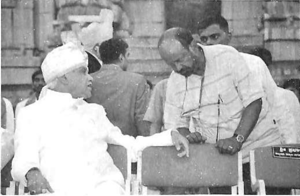
ಮುಖ್ಯಮಂತ್ರಿ ಬಿ.ಎಸ್. ಯಡಿಯೂರಪ್ಪ ಅವರೊಂದಿಗೆ