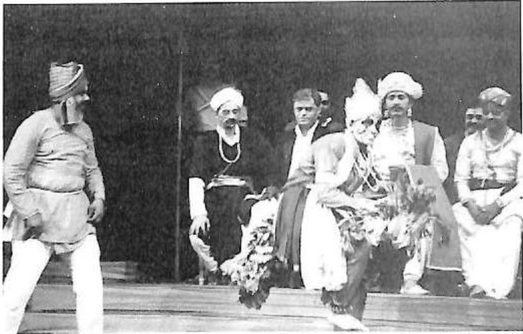
ಕಾಕನಕೋಟೆ ನಾಟಕದ ಒಂದು ದೃಶ್ಯ.