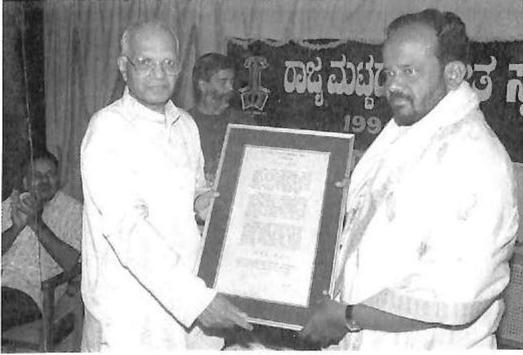
ರಾಷ್ಟ್ರಕವಿ ಡಾ|| ಜಿ.ವಿಸ್ ಶಿವರುದ್ರಪ್ಪ ಅವರಿಂದ ಗೌರವ ಸ್ವೀಕರ