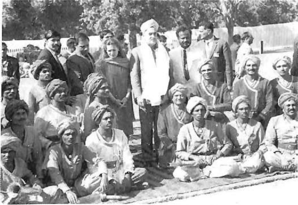
ಪ್ರಧಾನಿ ರಾಜೀವ್ ಗಾಂಧಿ ಅವರೊಂದಿಗೆ