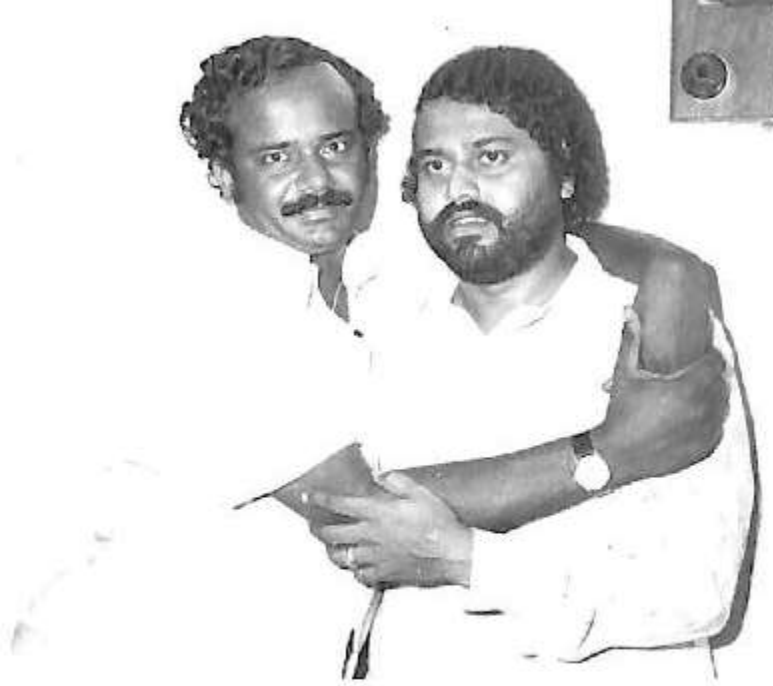
ಖ್ಯಾತ ನಟ ಲೋಕೇಶ್ ಅವರೊಂದಿಗೆ