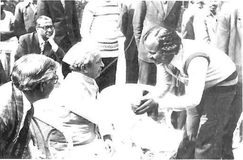
ಉಪರಾಜ್‍ಪತಿ ಬಿ.ಡಿ. ಜತ್ತಿ ಅವರಿಗೆ ವಿವರಣೆ