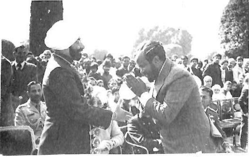
ರಾಜ್‍ಪತಿ ಜೈಲ್ ಸಿಂಗ್ ಅವರಿಗೆ ಗೌರವ ಸಮರ್ಪಣೆ