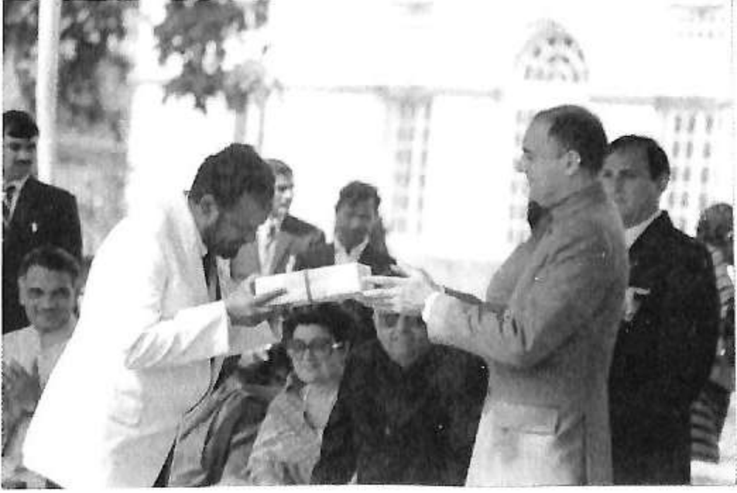
ಪ್ರಧಾನಿ ರಾಜೀವ್ ಗಾಂಧಿಯವರಿಂದ ಸ್ಮರಣಿಕೆ ಸ್ವೀಕಾರ