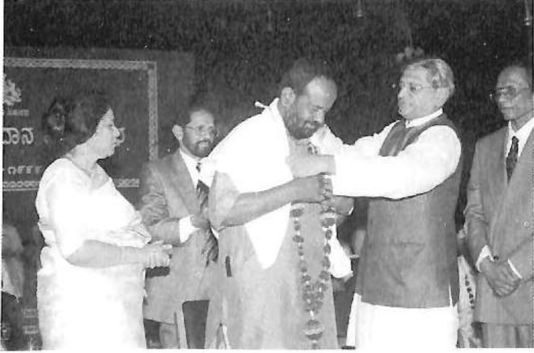
ಮುಖ್ಯಮಂತ್ರಿ ಎಸ್.ಎಂ ಕೃಷ್ಣ ಅವರಿಂದ ರಾಜೋತ್ಸವ ಪ್ರಶಸ್ತಿ ಸ್ವೀಕಾರ