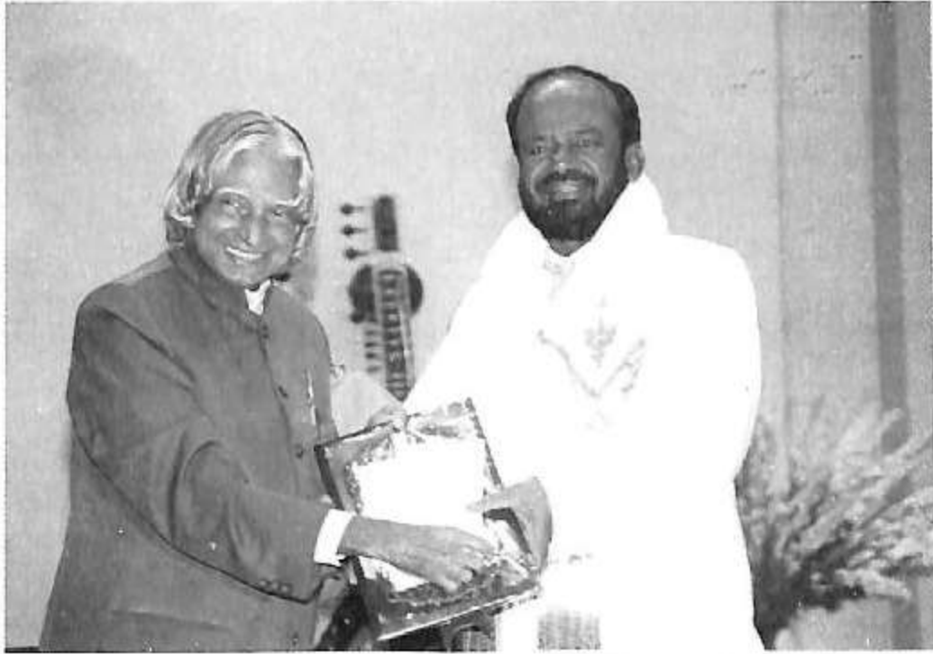
ರಾಷ್ಟ್ರಪತಿ ಅಬ್ದುಲ್ ಕಾಲಂ ಅವರಿಂದ ಪ್ರಶಸ್ತಿ ಸ್ವೀಕಾರ