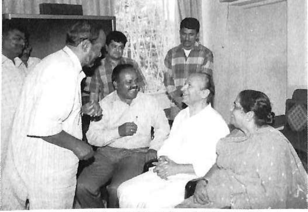
ಡಾ|| ರಾಜ್‌ಕುಮಾರ್ ಅವರೊಂದಿಗೆ ಒಂದು ಸರಸ ಸಂಭಾಷಣೆ