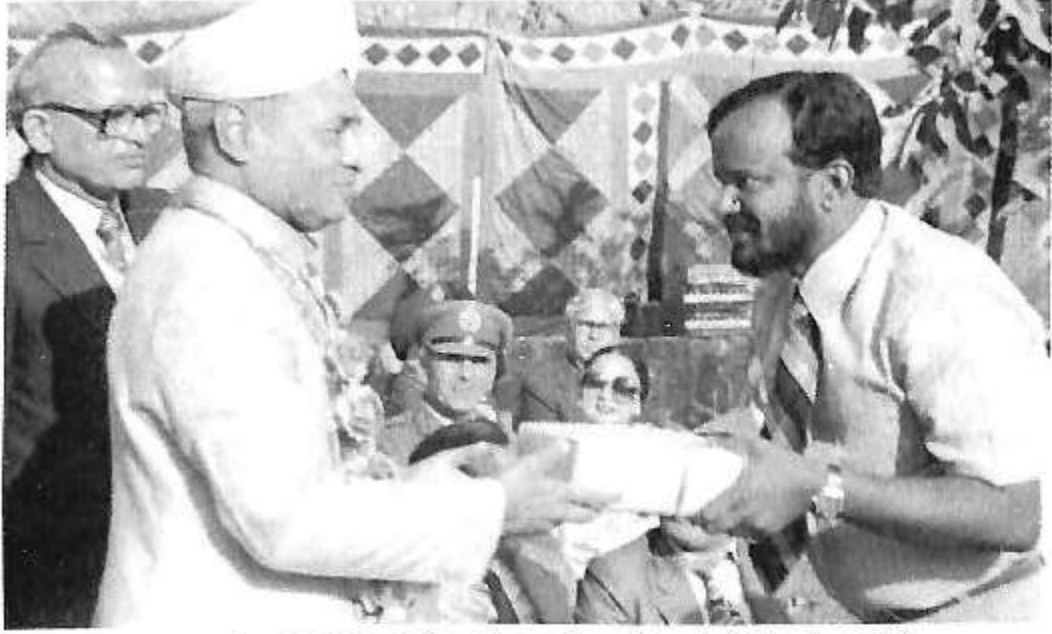
ಪ್ರಧಾನಿ ಪಿ.ವಿ ನರಸಿಂಹರಾವ್ ಅವರಿಂದ ನೆನಪಿನ ಕಾಣಿಕೆ