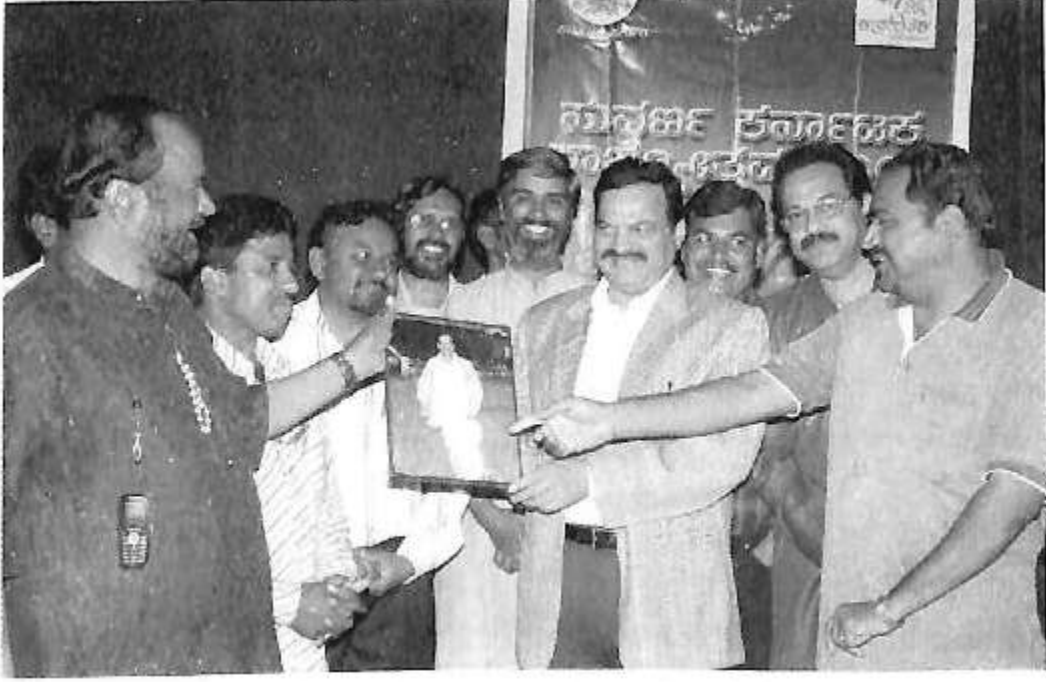
ಸುವರ್ಣ ಕರ್ನಾಟಕ - ಜಾನಪದ ಜಾತ್ರೆ ಕ್ರಿಯಾ ತಂಡದೊಂದಿಗೆ