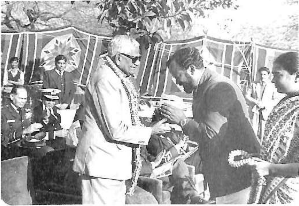
ರಾಷ್ಟ್ರಪತಿ ವೆಂಕಟರಾಮನ್ ಅವರಿಗೆ ಗೌರವ ಸಮರ್ಪಣೆ