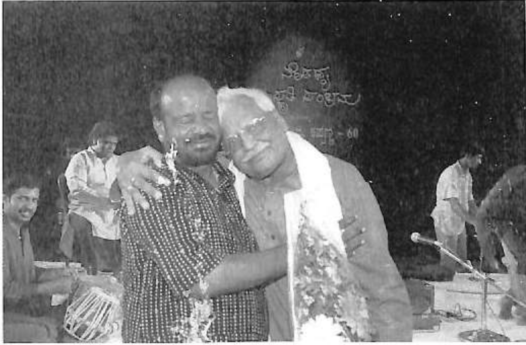
ಅಪ್ಪ ಗೆಲೆಯ ಖ್ಯಾತ ಗಾಯಕ ಸಿ. ಅಶ್ವತ್ಥರವರೊಂದಿಗೆ