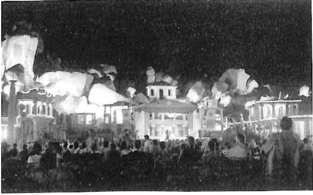
ಹಂಪೆ ಉತ್ಸವದಲ್ಲಿ ಬಂಡೆಗಳಲ್ಲಿ ವರ್ಣ ವೈಭವ