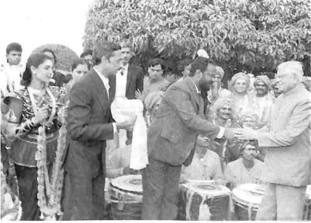
ರಾಷ್ಟ್ರಪತಿ ವಿ.ವಿ. ಗಿರಿ ಅವರಿಂದ ಹಸ್ತಲಾಘವ