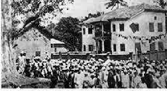
ಅಂಕೋಲಾ ಕಾಂಗ್ರೆಸ್ ಕಾರ್ಯಾಲಯದಿಂದ (ಏಪ್ರಿಲ್ ೧೨, ೧೯೨೦) ಉಪ್ಪಿನ ಸತ್ಯಾಗ್ರಹಕ್ಕೆ ಹೊರಟ ಬೃಹತ್ ಮೆರವಣಿಗೆ

೫೨ / ಸ್ವಾತಂತ್ರ್ಯ ಹೋರಾಟದಲ್ಲಿ ಕರ್ನಾಟಕ - ಅಂಕೋಲಾ