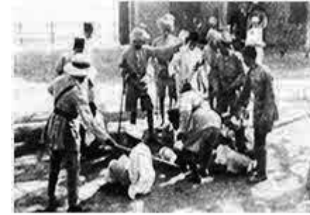
ಅಂಕೋಲಾದ ಇಟ್ಟಘಟ್ಟದಲ್ಲಿ ಜಂಗಲ್ ಸತ್ಯಾಗ್ರಹಿಗಳನ್ನು (ಆಗಸ್ಟ್ ೨೮, ೧೯೫೦) ಪೊಲೀಸರು ಮೆರವಣಿಗೆಯನ್ನು ತಡೆದ ದೃಶ್ಯ.