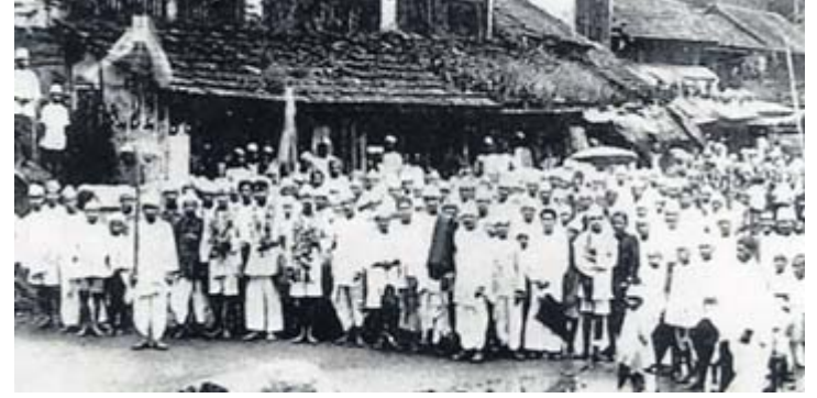
ಅಂಕೋಲಾ ತಾಲೂಕಿನಲ್ಲಿ ಕರ ನಿರಾಕರಣೆ ಚಳವಳಿಯ ಮೊದಲಸಭೆ ಸೇರಿದ ಸೂರ್ವೆಯ ಕಳಸ ದೇವಸ್ಥಾನ