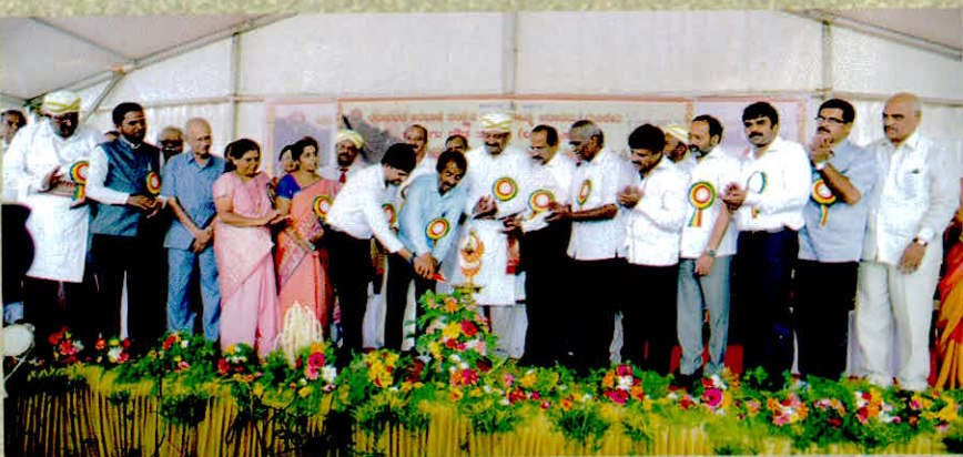
ಮೈಸೂರಿನಲ್ಲಿ 'ಅರೆಭಾಷೆ ಐಸಿರಿ' ಉದ್ಘಾಟನೆ