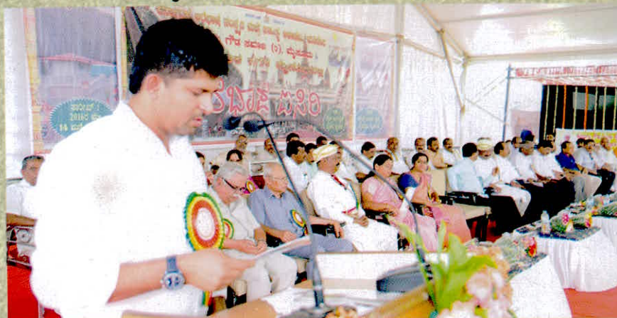
ಮೈಸೂರಿನಲ್ಲಿ 'ಅರೆಭಾಷೆ ಐಸಿರಿ' - ಮಾನ್ಯ ಸಂಸದ ಪ್ರತಾಪ್ ಸಿಂಹ ಅವರಿಂದ ಭಾಷಣ