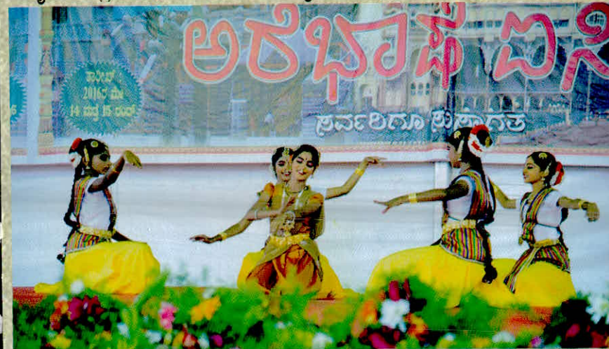
ಮೈಸೂರಿನಲ್ಲಿ 'ಅರೆಭಾಷೆ ಐಸಿರಿ' - ಸಾಂಸ್ಕೃತಿಕ ಕಾರ್ಯಕ್ರಮ