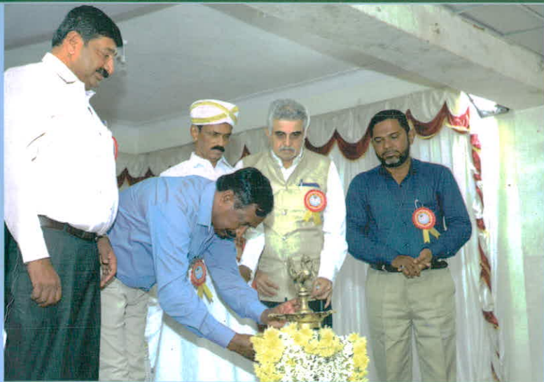
15-12-2018 ರಂದ್ ಮಡಿಕೇರಿಲಿ ನಡ್ಡ ಅಕಾಡೆಮಿಯ 7ನೇ ವಾರ್ಷಿಕೋತ್ಸವ ಮತ್ತೆ ಭಾಷಾ ಸೌಹಾರ್ದ ಜಂಬರದ ಉದ್ಘಾಟನೆ