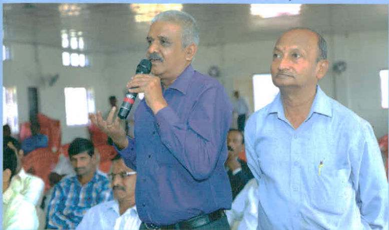
15-12-2018 ರಂದ್ ಮಡಿಕೇರಿಲಿ ನಡ್ಡ ಅಕಾಡೆಮಿಯ 7ನೇ ವಾರ್ಷಿಕೋತ್ಸವ ಮತ್ತೆ ಭಾಷಾ ಸೌಹಾರ್ದ ಜಂಬರಲಿ ಅಭಿಪ್ರಾಯ ಕೊಡ್ತಿರುವ ಸಭಿಕರ್