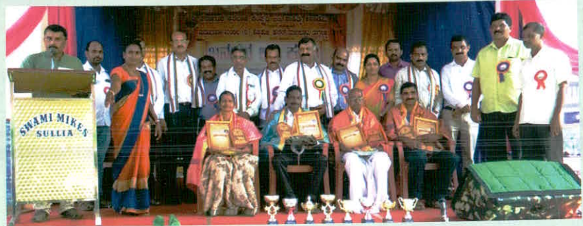
17-2-2019 ರಂದು ಸರ್ಕಾರಿ ಪ್ರೌಢಶಾಲೆ, ದುಗ್ಗಲಡ್ಡಲಿ ನಡೆದ ಅರಬಾಪ್ಪ ಜನಪದ ಆಟಕೂಟದ ಒಂದು ನೋಟ