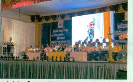
3-2-2019 ರಂದ್ ಗೌಡ ಸಮುದಾಯ ಭವನ, ಕೊಡಿಯಾಲ್ ಬಯಲ್, ಸುಳ್ಳಲಿ ನಡೆ ಅರೆಭಾಷೆ ಸುರೂನ ಸಾಹಿತ್ಯ ಸಮ್ಮೇಳನದ ಒಂದು ನೋಟ