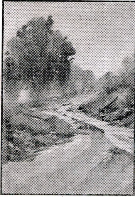
ಲ್ಯಾಂಡ್ ಸ್ಕೇಪ್ ವಾಟರ್ ಕಲರ್ ಸ್ಕೆಚ್ : ಮೇಲುಕೋಟೆ