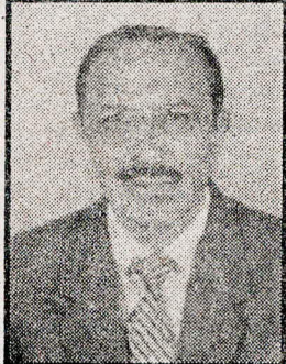
ಫೆಬ್ರವರಿ 2001 ರ ಒಳಗಡೆ ಸಮ್ಮೇಳನ ಗೌಡ ಸಮ್ಮೇಳನಕ್ಕಾಗಿ ಪೂರ್ವಭಾವೀ ಸಭೆ

ಸುಳ್ಯದಲ್ಲಿ ಗೌಡ ಸಮ್ಮೇಳನ ನಡೆದು ಹಲವು ವರುಷಗಳೇ ಉರುಳಿವೆ. ಇಂದು ಕೊಡಗಿನಲ್ಲಿ ಗೌಡ ಜನಾಂಗದ ಇರುವಿಕೆಯ ನೆಲೆಯೇ ಶಿಥಿಲಗೊಂಡಿದೆ. ಅದುದರಿಂದ ಗೌಡ ಜನಾಂಗದ ಸಂಘಟನೆಯನ್ನು ಸಮರ್ಥಗೊಳಿಸಲು, ತಮ್ಮ ಇರುವಿಕೆಯನ್ನು ಜಗಜ್ಜಾಹೀರಗೊಳಿಸಲು ಬೃಹತ್ ಗೌಡ ಸಮ್ಮೇಳನವನ್ನು ಮಡಿಕೇರಿಯಲ್ಲಿ ಸಂಘಟಿಸುವುದಕ್ಕಾಗಿ, ಅಕ್ಟೋಬರ್ 15ರಂದು ಮಡಿಕೇರಿಯ ಗೌಡ ಸಮಾಜದಲ್ಲಿ ಪೂರ್ವಭಾವಿ ಸಭೆ ನಡೆಯಿತು. ಕೊಡಗು ಗೌಡ ಸಾಂಸ್ಕೃತಿಕ ಅಕಾಡೆಮಿ ಈ ಸಭೆಯನ್ನು ಆಯೋಜಿಸಿತ್ತು.