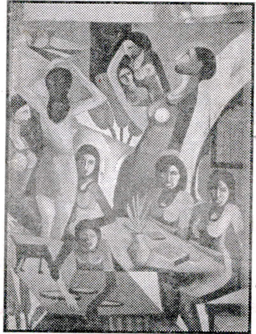
ಡಿ. ಲೇಡಿಸ್ ಹಾಸ್ಟೆಲ್, ಆಯಿಲ್ ಕಲರ್ ಮಾಡ್ರನ್ ಪೈಂಟಿಂಗ್