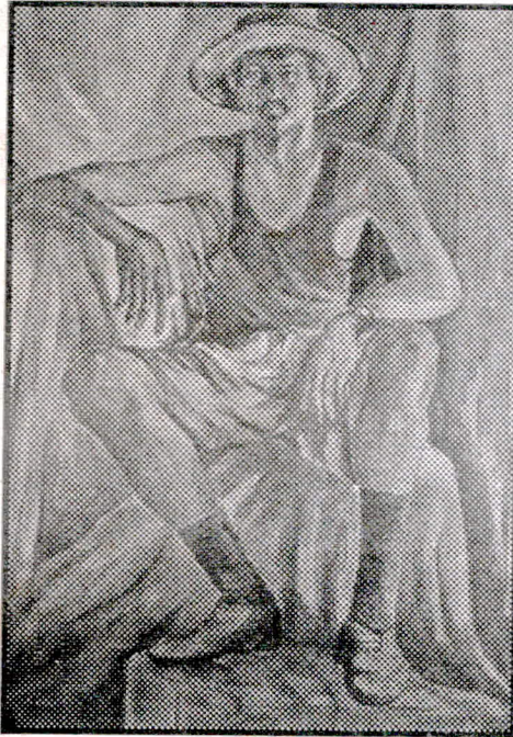
ಲೈಫ್ ಪೈಂಟಿಂಗ್, ವಾಟರ್ ಕಲರ್, ಮಾಡಲ್