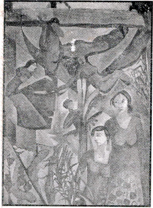
ವಿವಿಧ ಭಂಗಿಗಳಲ್ಲಿ ಸ್ತ್ರೀಯರು ಪೊಸ್ಟರ್ ಕಲರ್, ಮಾಡ್ರನ್ ಕಲರ್