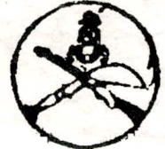
ಕೊಡಗು ಗೌಡ ಸಾಂಸ್ಕೃತಿಕ ಅಕಾಡೆಮಿ ಮಡಿಕೇರಿ