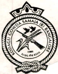
ಕೊಡಗು ಗೌಡ ಸಮಾಜ ಬೆಂಗಳೂರು - 1969