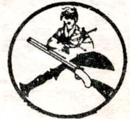
ಕೊಡಗು ಗೌಡ ಮಾಜಿ ಸೈನಿಕರ ಕ್ಷೇಮಾಭಿವೃದ್ಧಿ ಸಂಘ-2000