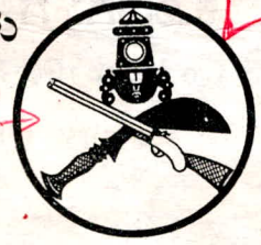
ಕೊಡಗು ಸಂಗಾತಿ 9-4-1997

- ತೇನನ ರಾಜೇಶ್, ಬೆಂಗಳೂರು ಚಿಹ್ನೆ ಸಂಗ್ರಹ : ಪಟ್ಟಿಡ ಪ್ರಭಾಕರ್