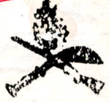
ಕೊಡಗು ಗೌಡ ವಿದ್ಯಾಸಂಘ, ಮಡಿಕೇರಿ