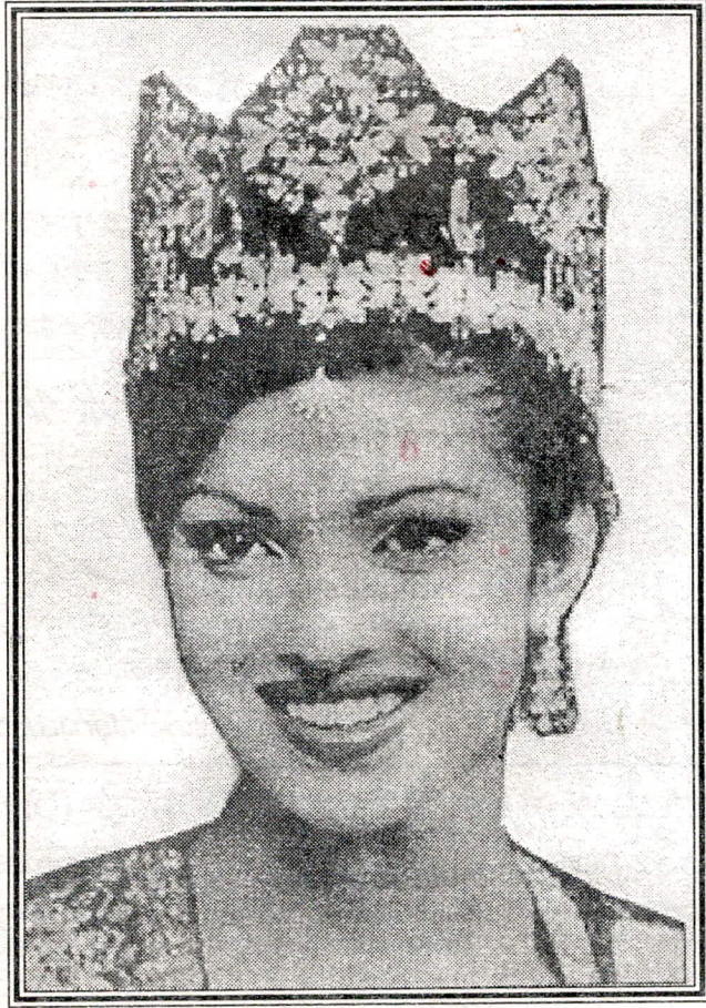
ಲೇಖನ : ಒಳಪುಟಗಳಲ್ಲಿ

Reg. No. KA/SK/MYS-88 ಸಂಪುಟ : 4 ಸಂಚಿಕೆ : 23 ಪುಟಗಳು : 24 ಬೆಲೆ ರೂ. : 6-00