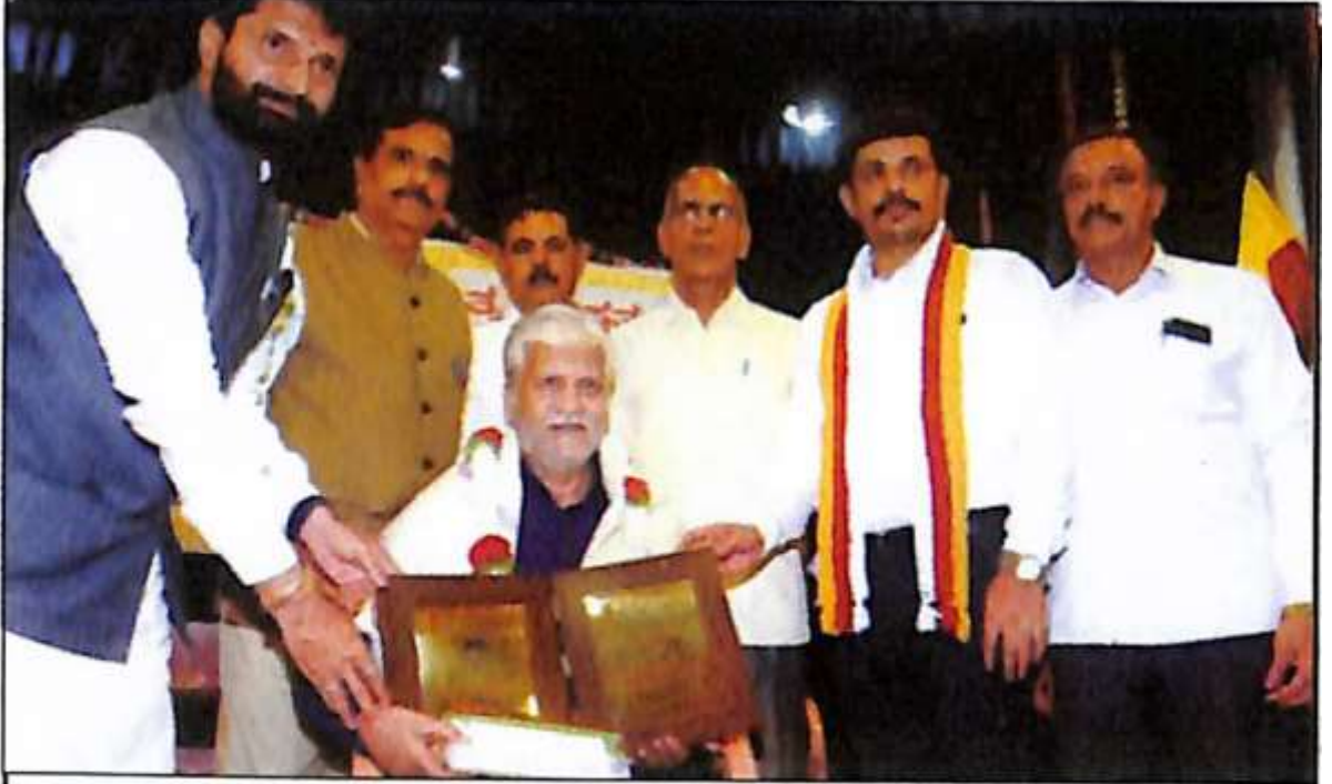
೨೦೧೯ನೇ ಸಾಲಿನ ಅಭಿನಯ ಛಾತ್ರರ ಡಾ. ವಿಷ್ಣುವರ್ಧನ ಪ್ರಶಸ್ತಿಯನ್ನು ಹಿರಿಯ ಚಲನಚಿತ್ರ ನಿರ್ದೇಶಕರಾದ ಶ್ರೀ ರಾಜೇಂದ್ರ ಸಿಂಗ್ ಬಾಬು ಅವರಿಗೆ ಕನ್ನಡ ಮತ್ತು ಸಂಸ್ಕೃತಿ ಇಲಾಖೆ ಸಚಿವರಾದ ಶ್ರೀ ಸಿ.ಉ. ರವಿ ಅವರು ಪ್ರದಾನ ಮಾಡಿದರು. ಅಧ್ಯಕ್ಷರಾದ ನಾಡೋಪ ಡಾ. ಮನು ಐಞಗಾರ್ ಅವರೊಂದಿಗೆ ಇತರ ಗಣ್ಯರು ಉಪಸ್ಥಿತರಿದ್ದರು.