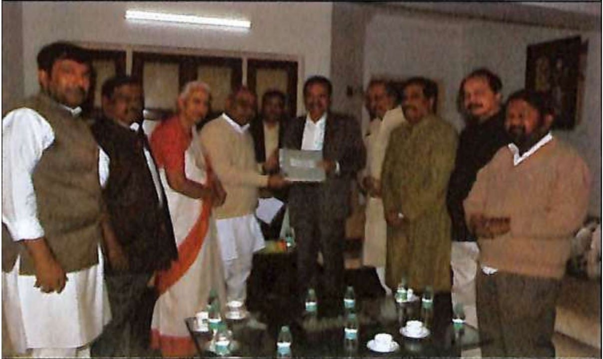
ಕೇಂದ್ರ ಸರ್ಕಾರ / ಬ್ಯಾಂಕ್‌ಗಳ ನೇಮಕಾತಿಗಳ ಸ್ಥಳೀಯದಲ್ಲಿ ಪ್ರತಿಷ್ಠಾನಕ್ಕೆ ಕಲ್ಪಿಸುವುದೂ ನೇರದಂತೆ ಇನ್ನಿತರೆ ಕನ್ನಡ ಕೆಲಸಗಳ ಬಗ್ಗೆ ಮಹತ್ವ ಪ್ರಮುಖವೆಂತೆ ಅಧಿಕಾರಿ ಕನ್ನಡ ಅಭಿವೃದ್ಧಿ ಪ್ರಾಧಿಕಾರದ ನಿಯೋಗದೊಂದಿಗೆ ಅಧ್ಯಕ್ಷರಾದ ಡಾ. ಮನು ಐತಗಾರ್ ಅವರು ಜಿ.ಎಸ್.ಎಸ್. ಸಿದ್ದರಾಮಯ್ಯ ಅವರೊಡನೆ ಕೇಂದ್ರ ಸರ್ಕಾರದ ಡಾ. ಎ.ಎ. ಸರಾನಂದಗೌಡ ಅವರಿಗೆ ಮನವಿ ಸಲ್ಲಿಸುತ್ತಿರುವುದು.