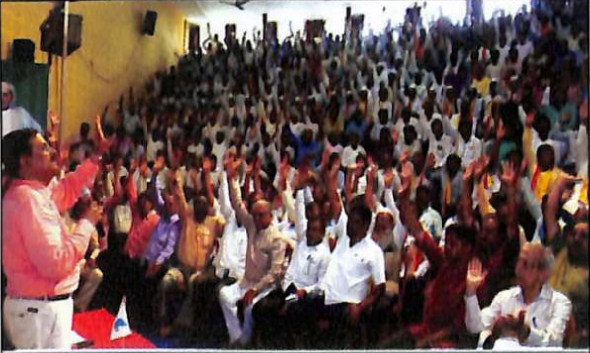
ಗಣಿ ಮಾಜ್ಕ್ ೨೦೧೮ರಂದು ಕೋಟಿ ಗ್ರಾಮದಲ್ಲು 'ಕನ್ನಡ ಸಾಹಿತ್ಯ ಪರಿಷತ್ತಿನ ವಿಲೇವಿ ಸಕಲ ಸದಸ್ಯರ ಸಭೆ' ಅತ್ಯಂತ ಯಶಸ್ವಿಯಾಗಿ ಜರುಗಿತು. ಲೇ. ೯೯.೧೨% ರಷ್ಟು ಸದಸ್ಯರು ಅಭೂತಪೂರ್ವ ಬೆಂಬಲ ನೀಡಿದ್ದರಿಂದ ಪ್ರಸ್ತಾವಿತ ಅಧ್ಯಕ್ಷರಣಿಲ್ಲವೂ ಯಥಾವತ್ತಾಗಿ ಸ್ವೀಕಾರಗೊಂಡು ನಿಬಂಧನೆಗಳ ಅಧ್ಯಕ್ಷರಣಿ ಸಭೆ ಅನುಷ್ಠಾನಿಸಿತು.