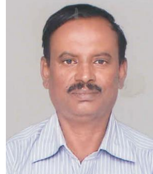
ಎಸ್. ಎಚ್. ಶಿವರುದ್ರಪ್ಪ