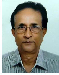
ಗಿಂಡೇಮನೆ ಮೃತ್ಯುಂಜಯ ಸಹ ಸಂಪಾದಕರು