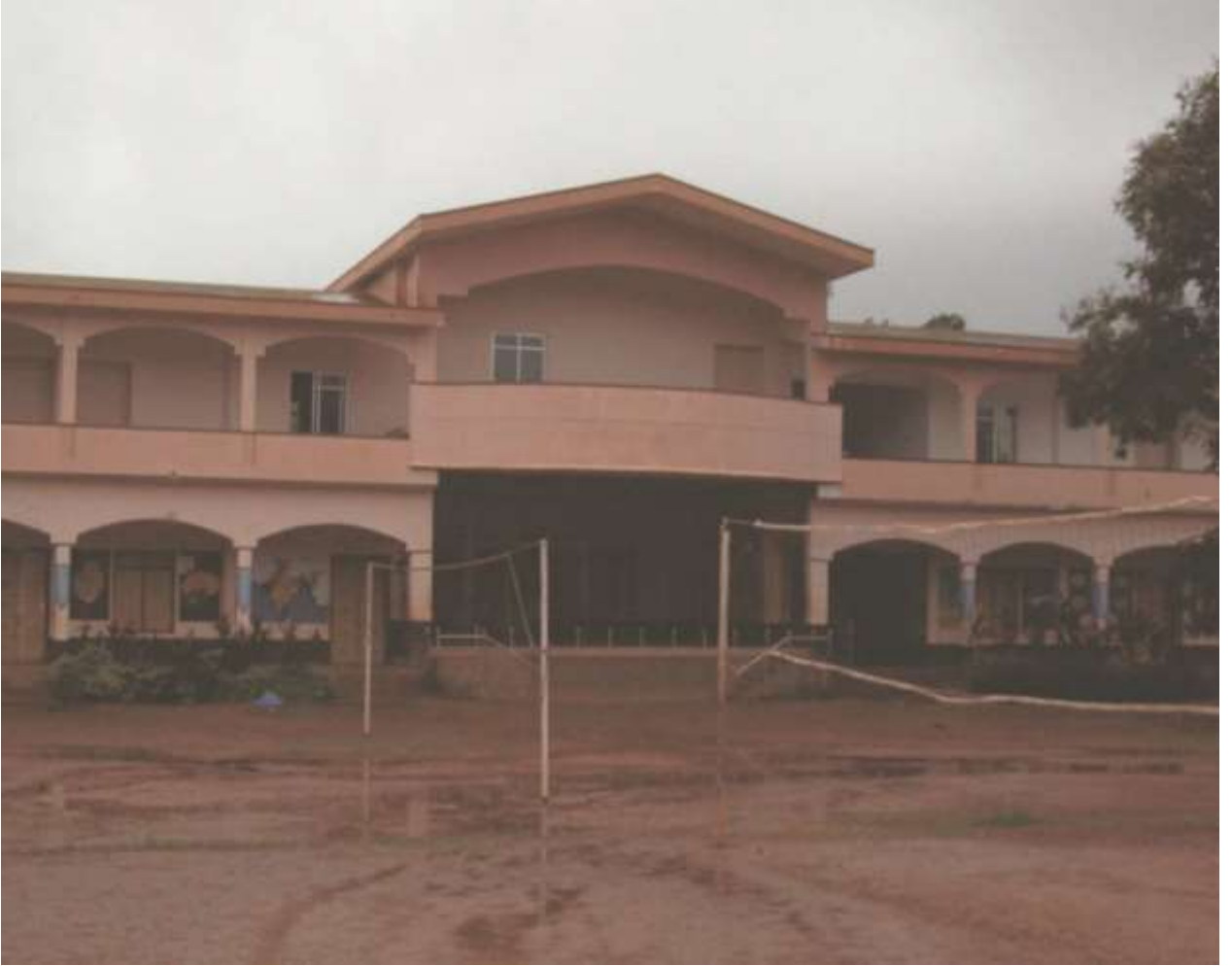
ಕುವೆಂಪು ಸರ್ಕಾರಿ ಮಾದರಿ ಪ್ರಾಥಮಿಕ ಶಾಲೆ

ರಾಷ್ಟ್ರಕವಿ ಕುವೆಂಪು ಶತಮಾನೋತ್ಸವ ಸ್ಮಾರಕ ಶಾಲೆ, ಇಲ್ಲಿ ಎಲ್ಲಾ ಶೈಕ್ಷಣಿಕ ಚಟುವಟಿಕೆಗಳನ್ನು ಅಳವಡಿಸಿಕೊಳ್ಳಲಾಗಿದೆ. ಇಲ್ಲಿ ೪೦೦ಕ್ಕೂ ಮಿಕ್ಕಿ ವಿದ್ಯಾರ್ಥಿಗಳು ವ್ಯಾಸಂಗ ಮಾಡುತ್ತಿದ್ದು, ಸಿರಾಮಿಕ್ ಗ್ರೀನ್ ಬೋರ್ಡ್‌ಗಳನ್ನು ಅಳವಡಿಸಲಾಗಿದೆ. ಸುಸಜ್ಜಿತ ಕೊಠಡಿ, ಶೌಚಾಲಯ, ಸಭಾಭವನ, ರಂಗಮಂದಿರವಿದ್ದು, ಡ್ರಾಯಿಂಗ್, ವೃತ್ತಿ, ಹೊಲಿಗೆ, ಸಂಗೀತ, ಗ್ರಂಥಾಲಯ, ಕಂಪ್ಯೂಟರ್, ಯೋಗ, ಯಕ್ಷಗಾನ ಮುಂತಾದ ಪಾಠ್ಯೇತರ ಚಟುವಟಿಕೆಗಳಿವೆ. ಇದು ರಾಜ್ಯದಲ್ಲೇ ಉತ್ತಮ ಶಾಲೆಯೆಂಬ ಹೆಸರು ಪಡೆದಿದೆ.