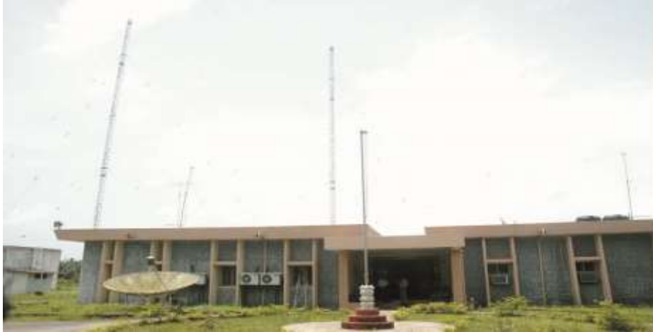
ಬ್ರಹ್ಮಾವರ ಕೆಮಿಕಲ್ಸ್ ಹಾಗೂ ವೆಸ್ಟ್‌ಕೋಸ್ಟ್ ಕೆಮಿಕಲ್ಸ್

ಇಲ್ಲಿ ಕೇಟನಾಶಕ ಮತ್ತು ಇತರ ರಾಸಾಯನಿಕ ಘಟಕ ತಯಾರಿಕೆಯನ್ನು ನೋಡಿ ತಿಳಿದುಕೊಳ್ಳಬಹುದು. ವೀಕ್ಷಣೆ ವೇಳೆ ಜಾಗರೂಕತೆ ಅಗತ್ಯ.