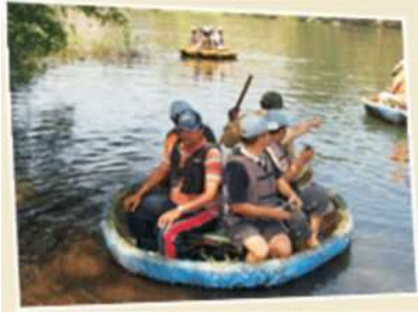
ಸಾತೋಡಿ ಫಾಲ್ಸ್ ೨೮ ಕಿ.ಮೀ.

ಯಲ್ಲಾಪುರ ಉತ್ತರ ಕನ್ನಡ ಜಿಲ್ಲೆಯಲ್ಲಿ ಸಣ್ಣ ಪಟ್ಟಣ. ತಾಲೂಕು ಕೇಂದ್ರವಾಗಿರುವ ಯಲ್ಲಾಪುರ ಪಶ್ಚಿಮ ಘಟ್ಟಗಳಲ್ಲಿ ಹುಟ್ಟಿರುವ ಪ್ರದೇಶ. ಯಲ್ಲಾಪುರವು ಪ್ರವಾಸಿ ತಾಣವಾಗಿದ್ದು ಸುಂದರವಾದ ಜಲಪಾತಗಳು ಹಾಗೂ ಬೆಟ್ಟ ಕಾಡುಗಳಿಂದ ಪ್ರವಾಸಿಗರ ಮನ ತಣಿಸುತ್ತದೆ.