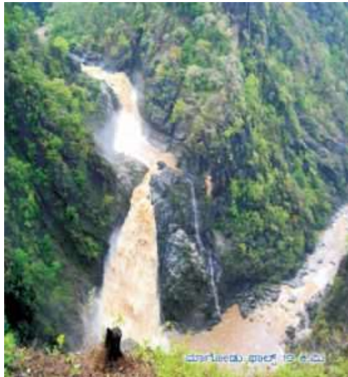
ಮಾಗೋಡು ಫಾಲ್ಸ್, ೧೯ ಕಿ.ಮೀ.