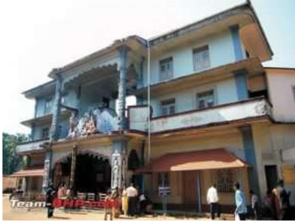
ಶ್ರೀ ಕ್ಷೇತ್ರ ಇಡಗುಂಜಿ

ಹೊನ್ನಾವರ ತಾಲೂಕಿನಲ್ಲಿರುವ ಇಡಗುಂಜಿಯು, ಶ್ರೀ ಮಹಾಗಣಪತಿ ದೇವರ ಪ್ರಸಿದ್ಧ ತಾಣ. ಇಡಗುಂಜಿ, ಇಡಕುಂಜ ಮತ್ತು ಕುಂಜವನ ಎಂಬ ಹೆಸರುಗಳಿಂದಲೂ ಪುರಾಣ ಪ್ರಸಿದ್ಧ.