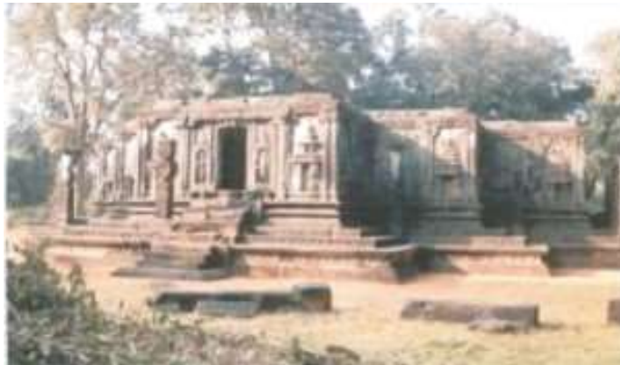
ಜೈನ ಬಸದಿ - ಗೇರುಸೊಪ್ಪ