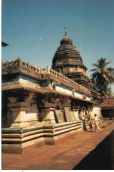
ಶ್ರೀ ಕ್ಷೇತ್ರ ಗೋಕರ್ಣ