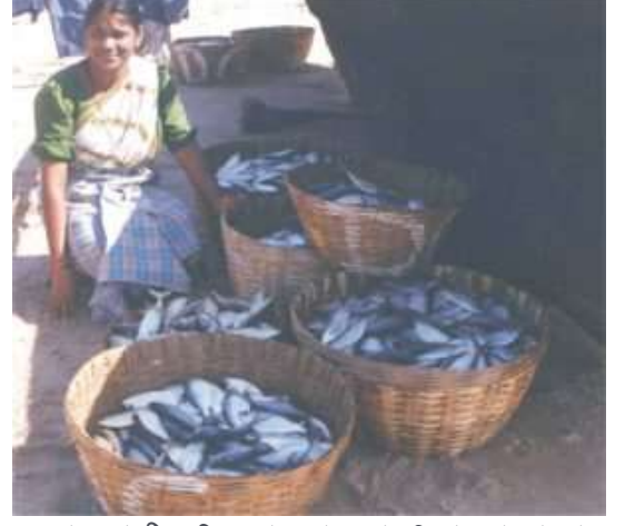
ಭಟ್ಕಳ ಬಂದರಿನಲ್ಲಿ ಮೀನು ಮಾರುತ್ತಿರುವ ದೃಶ್ಯ.

ಹೊನ್ನಾವರದಿಂದ ಭಟ್ಕಳ ಕಡೆಗೆ ಸಾಗುವಾಗ ಮಾರ್ಗ ಮಧ್ಯೆ ಹೆಬ್ಬಾಗಿಲೊಂದು ಪ್ರವಾಸಿಗರನ್ನು ಮುರ್ಡೇಶ್ವರಕ್ಕೆ ಸ್ವಾಗತಿಸುತ್ತದೆ. ಇಲ್ಲಿ ಏಷ್ಯಾದಲ್ಲಿಯೇ ಎರಡನೇಯದು ಎನ್ನಲಾಗುವ ಅತೀ ಎತ್ತರದ ಶಿವನ ಮೂರ್ತಿಯನ್ನು ಸ್ಥಾಪಿಸಲಾಗಿದೆ. ಇದು ಪ್ರವಾಸಿಗರನ್ನು ಆಕರ್ಷಿಸುತ್ತದೆ.