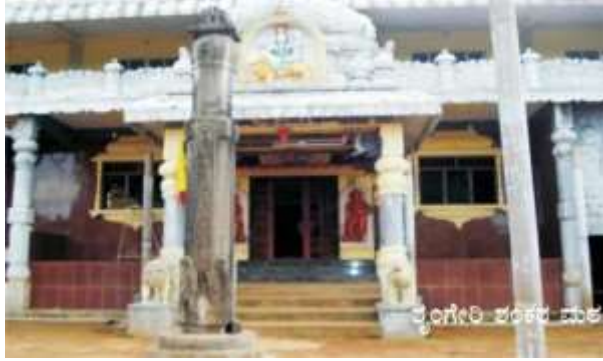
ಶೃಂಗೇರಿ ಶಂಕರ ಮಠ

ಸಿದ್ದಾಪುರ-ಕುಮಟಾ ಮಾರ್ಗದಲ್ಲಿರುವ ಆಧುನಿಕ ಶೈಲಿಯಲ್ಲಿ ನಿರ್ಮಾಣಗೊಂಡ ಈ ಶೃಂಗೇರಿ ಶಾಖಾ ಮಠ ಬಹಳ ಸುಂದರವಾಗಿದೆ. ಶಾರದೆ, ವಿನಾಯಕ, ಈಶ್ವರ ಮುಂತಾದ ದೇವತೆಗಳ ವಿಗ್ರಹಗಳನ್ನು ಸ್ಥಾಪಿಸಿ ಆಸ್ತಿಕರಿಗೆ ದೈವೀ ಕಾರ್ಯಗಳನ್ನು ನಡೆಸುವುದಕ್ಕೆ ವ್ಯವಸ್ಥೆ ಕಲ್ಪಿಸಲಾಗಿದೆ. ಧ್ಯಾನಕ್ಕೆಂದೇ ಶ್ರೀ ಶಂಕರಾಚಾರ್ಯರ ಪ್ರತಿಮೆಯನ್ನಿಟ್ಟು ವಿಶಾಲ ಮಂದಿರವನ್ನು ನಿರ್ಮಿಸಿದ್ದಾರೆ. ಸಾಂಸ್ಕೃತಿಕ ಕಾರ್ಯಕ್ರಮ ನಡೆಸಲು ಸುಂದರವಾದ ಭವ್ಯ, ದಿವ್ಯ ವೇದಿಕೆಯಿದೆ. ಇದು ಭುವನಗಿರಿ ಹಾಗೂ ಬಿಳಗಿ ತೆರಳುವ ಮಾರ್ಗದಲ್ಲಿಯೇ ಇದೆ.