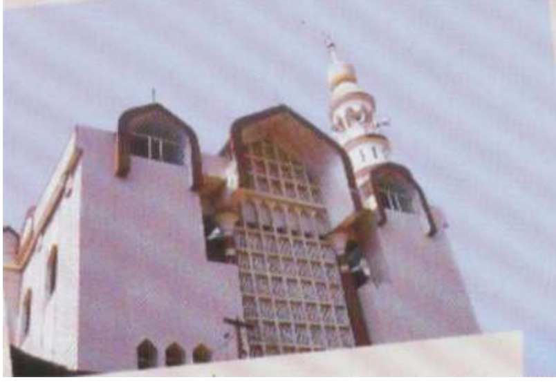
ಜುಮ್ಮಾ ಮಸೀದಿ ಭಟ್ಟಳ

ಹಾಡುವಳ್ಳಿ ಸಾಳುವ ರಾಜವಂಶದವರ ರಾಜಧಾನಿಯಾಗಿತ್ತು. ಇಲ್ಲಿ ಸುಮಾರು ಅರ್ಧ ಮೀಟರ್ ಎತ್ತರದ ೨೪ ಜೈನ ತೀರ್ಥಂಕರರ ಸಾಲು ಮೂರ್ತಿಗಳಿವೆ. ಯಕ್ಷಿ, ಪದ್ಮಾವತಿ, ಜೈನ ಸರಸ್ವತಿ ಹಾಗೂ ಕುದುರೆ ಮೇಲೆ ಕುಳಿತಿರುವ ಬ್ರಹ್ಮನ ಕಂಚಿನ ವಿಗ್ರಹ ಈ ಬಸದಿಯಲ್ಲಿವೆ. ಇಲ್ಲಿ ಚಂದ್ರಗಿರಿ ಹಾಗೂ ಇಂದ್ರಗಿರಿ ಎಂಬ ಎರಡು ಗುಡ್ಡಗಳಿದ್ದು, ಚಂದ್ರಗಿರಿಯ ರಡಿಯಲ್ಲಿ ವಿಜಯನಗರ ಕಾಲದ ಚಂದ್ರನಾಥ ಬಸದಿ ಇದೆ.