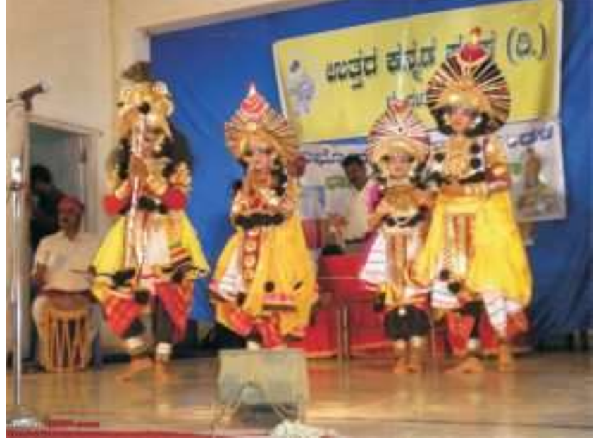
ಯಕ್ಷಗಾನ ಕಲೆ, ಉತ್ತರ ಕನ್ನಡ

ಹೊನ್ನಾವರದಿಂದ ಕುಮಟಾಕ್ಕೆ ಹೋಗುವ ಹೆದ್ದಾರಿಯಲ್ಲಿ ಬಲಭಾಗದ ಗುಡ್ಡದತ್ತ ಕಣ್ಣು ಹಾಯಿಸಿದರೆ, ಮುಗಿಲೆತ್ತರಕ್ಕೆ ನಿಂತ ಕಲ್ಲು ಕಂಬವೊಂದು ಗಮನ ಸೆಳೆಯುತ್ತದೆ. ಇದೇ ಕರ್ನಾಟಕ ಹಿಲ್.