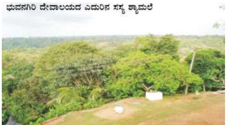
ಭುವನಗಿರಿ ದೇವಾಲಯದ ಎದುರಿನ ಸಸ್ಯಶ್ಯಾಮಲೆ