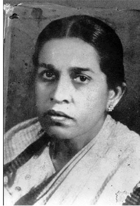
ಉಮಾಬಾಯಿ ಕುಂದಾಪುರ, ೧೮೯೨-೧೯೯೨

ತನ್ನ ೧೨ನೇ ವಯಸ್ಸಿನಲ್ಲಿ ಮದುವೆ, ೨೫ನೇ ವಯಸ್ಸಿಗೆ ವೈಧವ್ಯ, ೨೯ನೇ ವಯಸ್ಸಿಗೆ ಸ್ವಾತಂತ್ರ್ಯ ಹೋರಾಟ, ೩೦ನೇ ವಯಸ್ಸಿಗೆ ಸೇವಾದಳದ ನಾಯಕಿ ಪಟ್ಟ, ನಲವತ್ತನೇ ವಯಸ್ಸಿಗೆ ಜೈಲು ಶಿಕ್ಷೆ, ಬ್ರಿಟಿಷರಿಂದ ಚಿತ್ರಹಿಂಸೆ, ಭೂಗತರಾಗಿದ್ದ ಸ್ವಾತಂತ್ರ್ಯ ಹೋರಾಟಗಾರರಿಗೆ ತನ್ನ ಮನೆಯಲ್ಲೇ ಆಶ್ರಯ,