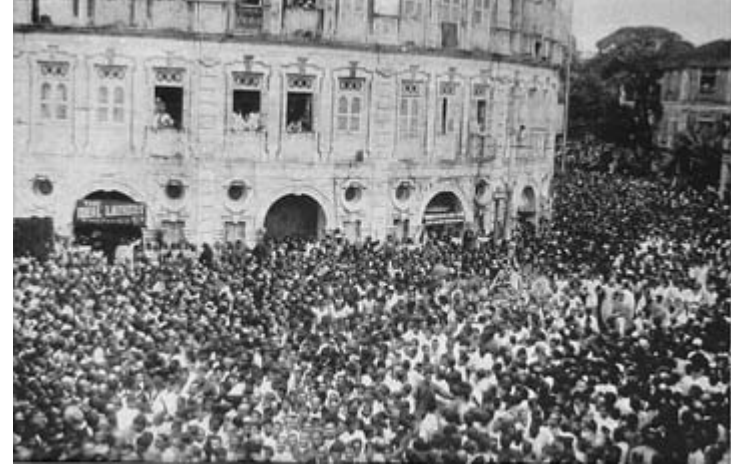
ಬಾಲಗಂಗಾಧರ ತಿಲಕರ ಅಂತಿಮ ಮೆರವಣಿಗೆ