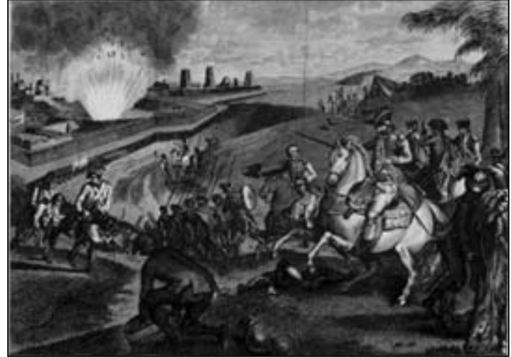
ಚಿತ್ರ: ಸ್ಟೋರ್ಮಿಂಗ್ ಆಂಡ್ ಟೇಕಿಂಗ್ ಬ್ಯಾಂಗಲೋರ್, ಮಾರ್ಕಿಸ್ ಕಾರನ್ ವಾಲಿಸ್.