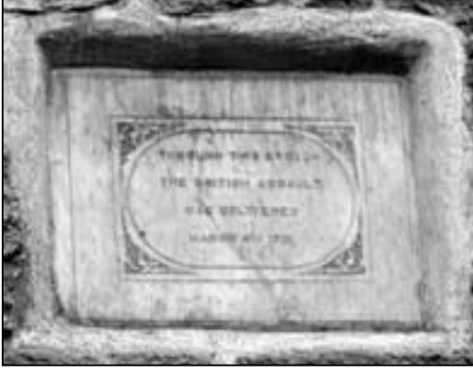
ಬೆಂಗಳೂರನ್ನು ವಶಪಡಿಸಿಕೊಂಡಿದ್ದರ ಗುರುತಿಗೆ ಬ್ರಿಟಿಷರು ಅಳವಡಿಸಿರುವ ಫಲಕ

ಅಲ್ಲಿಂದ ಬರೋಬ್ಬರಿ ಎರಡು ಶತಮಾನ ಯಾವುದೇ ಹೋರಾಟಗಳಲ್ಲಾಗಲಿ, ಯುದ್ಧದಲ್ಲಾಗಲಿ ಉಲ್ಲೇಖಗಳು ಕಂಡುಬರುವುದೇ ಇಲ್ಲ. ಆನಂತರ ಮೊದಲಿಗೆ ಈ ಸ್ಥಳ ಮತ್ತೆ ಮುನ್ನೆಲೆಗೆ ಬಂದದ್ದು ಬ್ರಿಟಿಷ್ ಆಡಳಿತದ ಕೊನೆಯ ಚರಣದಲ್ಲಿ.