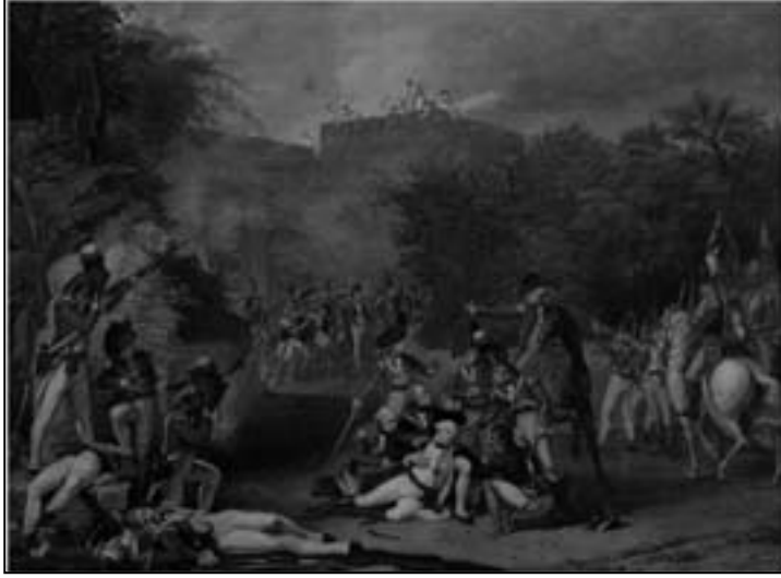
ಚಿತ್ರ: ರಾಬರ್ಟ್ ಹೋಮ್(೧೭೯೩).