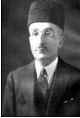
ದಿವಾನ್ ಮಿರ್ಜಾ ಇಷಾಯಿಲ್

“ಜರ್ಮನಿಯಲ್ಲಿ ಹಿಟ್ಲರ್, ಇಟಲಿಯಲ್ಲಿ ಮುಸ್ಸೋಲಿನಿ, ರಷ್ಯಾದಲ್ಲಿ ಸ್ಟಾಲಿನ್‌ನಂಥ ಸರ್ವಾಧಿಕಾರಿಗಳು ಅಧಿಕಾರಕ್ಕೆ ಬಂದಿದ್ದಾರೆ. ಪ್ರಜಾತಂತ್ರ ಹುಟ್ಟಿದ ನಾಡಾದ ಯೂರೋಪ್‌ನಲ್ಲೇ ಅದು ಕಣ್ಮರೆಯಾಗುತ್ತಿದೆ. ಇಂಥ ಕಾಲದಲ್ಲಿ ನಮ್ಮ ಕೆಲವು ನಾಯಕರಿಗೆ ಜವಾಬ್ದಾರಿ ಸರ್ಕಾರ, ಪ್ರಜಾತಂತ್ರ ಬೇಕು. ಇದು ಎಂಥ ವಿಪರ್ಯಾಸ” ಎಂದಿದ್ದರು.