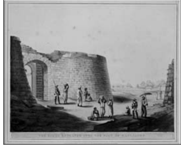
ಯುದ್ಧದ ನಂತರ ಹಾನಿಯಾಗಿದ್ದ ಕೋಟೆಯ ಭಾಗಗಳನ್ನು ಟಿಪ್ಪು ಸೈನಿಕರ ಸಹಾಯದಿಂದ ಬ್ರಿಟಿಷರು ದುರಸ್ತಿ ಮಾಡಿಸುತ್ತಿರುವುದು.