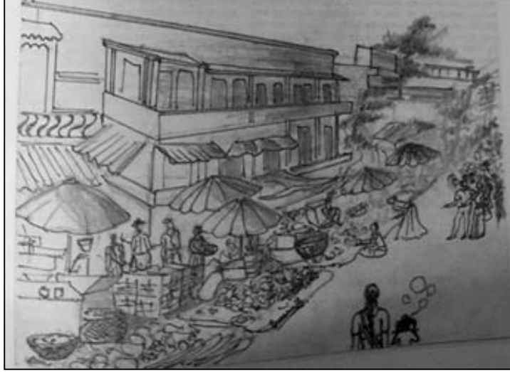
ಕಲಾವಿದನ ಕಣ್ಣಲ್ಲಿ ಬೆಂಗಳೂರು ಪೇಟೆ.