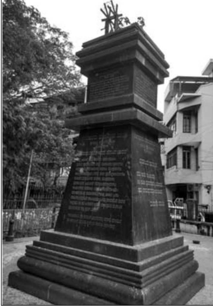
ಬನಪ್ಪ ಪಾರ್ಕಿನಲ್ಲಿರುವ ಸ್ವಾತಂತ್ರ್ಯ ಸ್ಮೂಪ

ಅದೇ ದಿಕ್ಕಿನ ಕೆಳಭಾಗದಲ್ಲಿ ಭಾಗದಲ್ಲಿ “ಸ್ವರಾಜ್ಯದ ಸಾಫಲತೆ: ನಮ್ಮ ಅಂತಃಶಕ್ತಿಯನ್ನೂ ಅತಿ ಕಠಿಣ ಪ್ರಸಂಗಗಳನ್ನು ಎದುರಿಸುವ ನಮ್ಮ ಸಾಮರ್ಥ್ಯವನ್ನೂ ಅವಲಂಬಿಸಿದೆ. -ಮಹಾತ್ಮಾಗಾಂಧಿ” ಎಂದು ಬರೆಯಲಾಗಿದೆ.