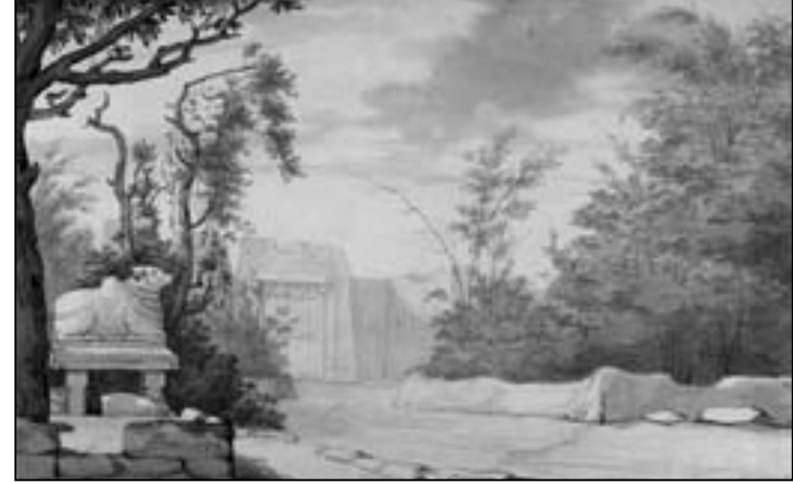
ಬೆಂಗಳೂರು ಪೇಟೆ ಗೇಟ್ ಕೋಟೆಯ ವಿಹಂಗಮ ನೋಟ

ಬೆಂಗಳೂರು ನಗರ ನಿವಾಸಿಗಳಾದರೋ ತಮ್ಮ ಆತ್ಮರಕ್ಷಣೆಯತ್ತ ಮೊದಲು ಗಮನ ಹರಿಸಿದರು. ಅನೇಕರು ತಮ್ಮಲ್ಲಿದ್ದ ನಗದು, ಒಡವೆ ವಸ್ತು ಇತ್ಯಾದಿಗಳನ್ನು ತಂತಮ್ಮ ಹಿತ್ತಲುಗಳಲ್ಲಿ ಹಳ್ಳ ತೆಗೆದು ಹೂತಿಟ್ಟರು. ಹೊರಗಡೆಯಿಂದ ಬರುತ್ತಿದ್ದ ಸರಕುಗಳು ನಿಂತುಹೋದವು. ತರಗು ಪೇಟೆಯಲ್ಲಿ ದಿನಸಿ ಪದಾರ್ಥಗಳು