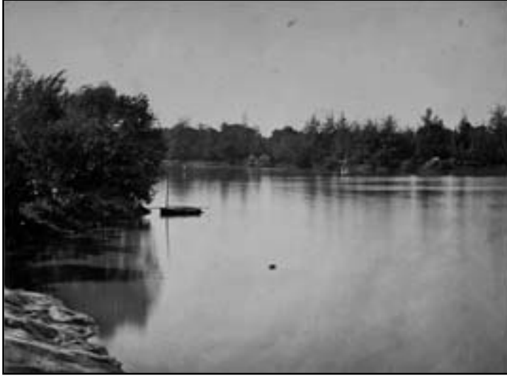
(ಹಲಸೂರು ಕೆರೆಯ ಚಿತ್ರ )

ಬೆಂಗಳೂರು ಪರಿಸರದ ಭೌಗೋಳಿಕ ಹಿನ್ನೆಲೆಯು ಪ್ರಾಚೀನ ಕಾಲದಿಂದಲೂ ಹಲವು ಧಾರ್ಮಿಕ ಕೇಂದ್ರಗಳನ್ನು ಒಳಗೊಂಡಿದೆ. ಅವುಗಳ ಪೈಕಿ ಹಲಸೂರು ಒಂದು. ಬೆಂಗಳೂರು ಕೋಟೆಯಿಂದ ಈಶಾನ್ಯಕ್ಕೆ ಸುಮಾರು ೫ ಕಿ.ಮಿ ದೂರದಲ್ಲಿರುವ ಪ್ರಾಚೀನ ಊರೇ ಹಲಸೂರು. ಬೆಂಗಳೂರು ಸ್ಥಾಪನೆಗೂ ಪೂರ್ವದ ನೆಲೆಯಾಗಿರುವ ಹಲಸೂರು ದಕ್ಷಿಣ ಪಿನಾಕಿನಿ ನದಿಯ