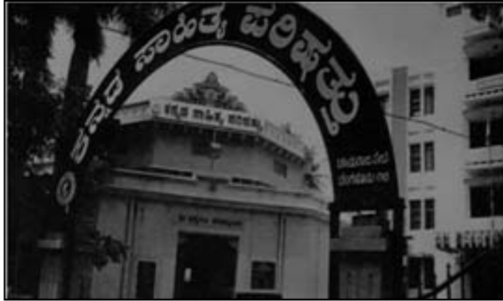
(ಕನ್ನಡ ಸಾಹಿತ್ಯ ಪರಿಷತ್ತು)

ಪತ್ರಿಕೋದ್ಯಮ ಕ್ಷೇತ್ರಕ್ಕೆ ೨೦ನೇ ಶತಮಾನದ ಪೂರ್ವಾರ್ಧದಲ್ಲಿ ಡಿವಿಜಿಯವರ ಕೊಡುಗೆ ಅಮೋಘ. ಡಿವಿಜಿಯವರು ಪತ್ರಿಕೆಯಲ್ಲಿ ಸೇರಿ ಕೆಲಸಮಾಡಿದರು, ಬೇರೆ ಪತ್ರಿಕೆಗಳಿಗೆ ಅಂಕಣಗಳನ್ನು ಬರೆದರು, ತಾವೇ ಪತ್ರಿಕೆಗಳನ್ನು ಆರಂಭಮಾಡಿ ನಡೆಸಿದರು. ಪತ್ರಿಕಾ ವೃತ್ತಿಯನ್ನೇ ಬೆಳೆಸಿ, ನಿಶ್ಚಿತ ಧೋರಣೆಗಳನ್ನು ಕೊಟ್ಟು ಆ ವೃತ್ತಿಯ ಮೌಲ್ಯವನ್ನು ಹೆಚ್ಚಿಸಲು ಆಗ್ರಹಿಸಿದರು.